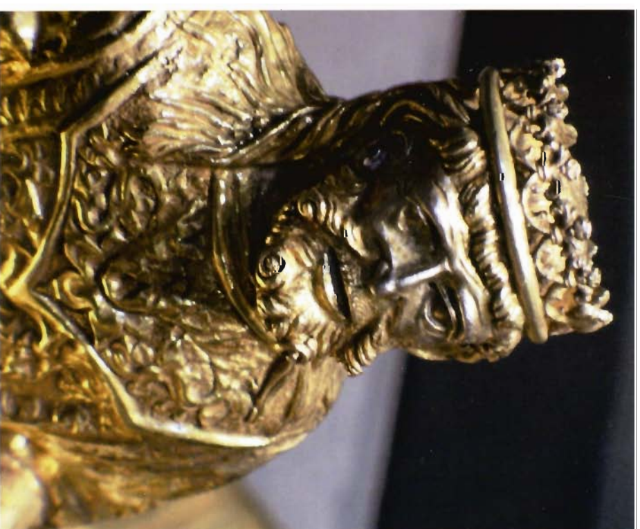
Profeta de la custòdia del Corpus

El convent de Sant Agustí té al retesagrari un conjunt de pintures barroques molt interessants i que encara no ha estat estudiat com mereix. Hi trobem el pelicà, l'ocell eucarístic que representa el sacrifici de Crist. Algunes escenes dels