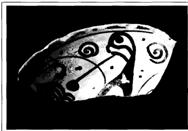
Fragment d'escudella medieval (s. XV), que representa una au; trobat al terme. Col·lecció particular