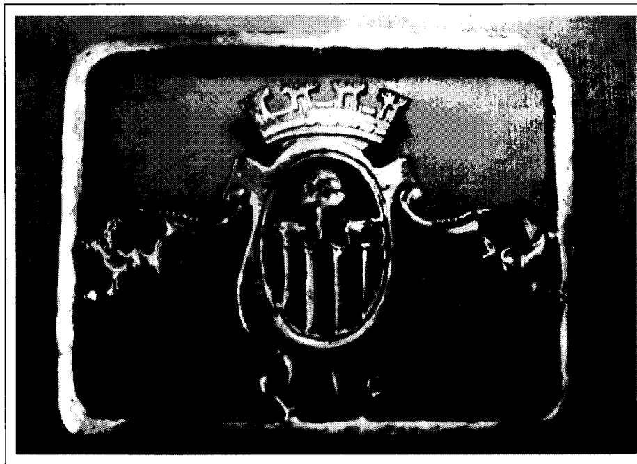
Escut de l'Olleria amb corona mural de la I República. Col.lecció particular.

L a Vall d'Albaida té un Patrimoni Històric i Artístic més ric del que podria creure's a primera vista. Potser perquè és una comarca que compta amb nombrosos nuclis de població, amb llurs esglésies parroquials i sovint ermites i convents, alguns castells, palaus senyoriais, cases de vila, edificis interessants, ximeneres industrials de rajola, plafons ceràmics de devoció popular.