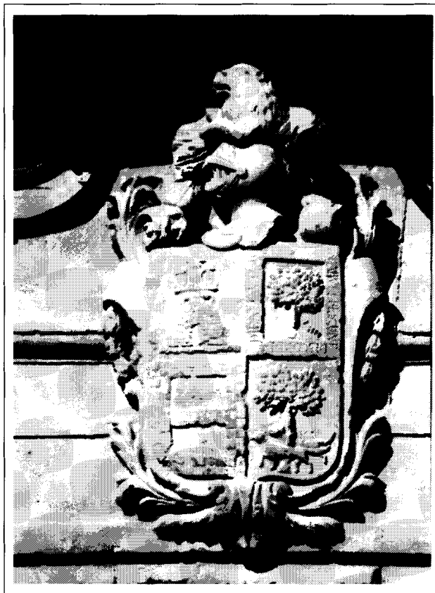
Escut nobiliari de la Casa Santonja.