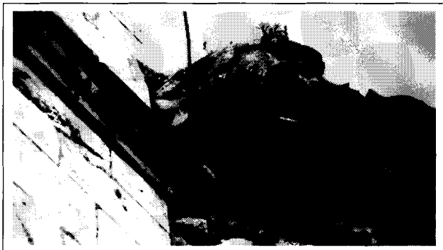
Gàrgola del campanar de la Magdalena

Acompanyem unes imatges que anticipen diversos aspectes que formen part de l'estudi que s'està realitzant.