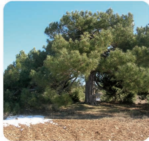
Pinus nigra. La Yesa