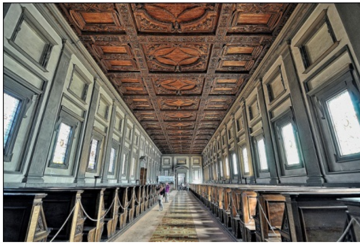
Miquel Àngel: Sala de lectura de la biblioteca Laurenziana, Florència.

La correspondència de les pilastres i les bigues es una herència del Quattrocento , no obstant el nou paràmetre que utilitza per tractar les pilastres no es utilitzat per ningú abans, es basa en un esglaonament a tres nivells: el nivell més profund conté els marcs de les finestres, el del mig conté les obertures tapiades del pis superior i els rectangles en que es situen les finestres i finalment el superior està format per les pilastres i la seua basa. Les motlures dels marcs són de pietra serena i la resta del mur d'estuc blanc. La finalitat d'aquest esglaonament és dotar la sala d'una major profunditat, al mateix temps es produeix una fusió d'elements tridimensionals amb elements bidimensionals combinant el pla dels murs i els elements que contenen.