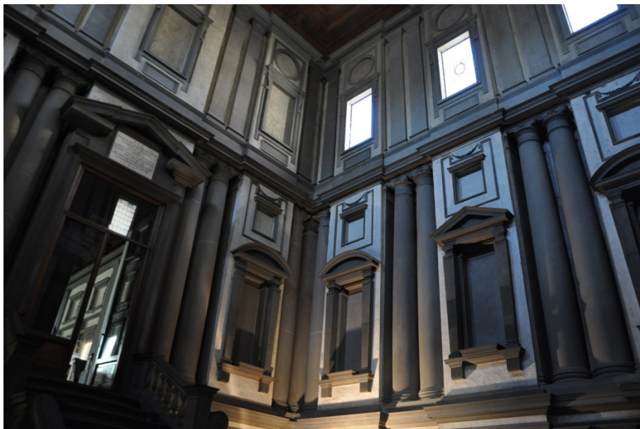
Miquel Àngel: Ricetto de la biblioteca Laurenziana, San Llorenç, Florència.

part del mur i que s'introdueixen dins d'un paràmetre que sembla un bloc tridimensional que segueix cap a l'interior de les parets. Al conjunt del segon nivell, per tant, es situen sis columnes i tres superfícies murals decorades amb tots aquest aspectes descrits, tot açò ho podem veure a la següent imatge.