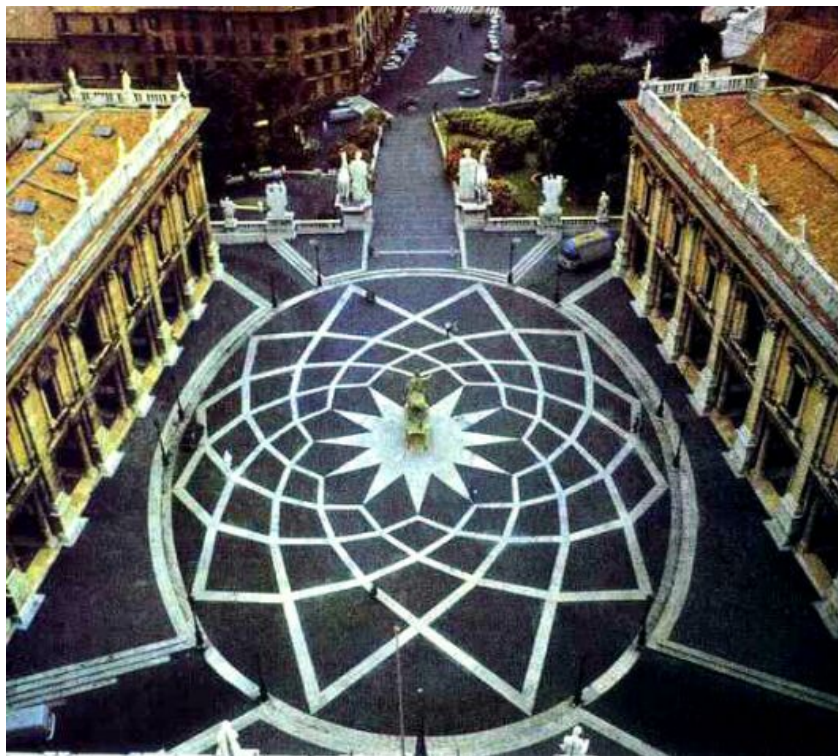
Miquel Àngel: Paviment de la plaça del Campidoglio , Roma.

perfectament a la forma de la cordonata i la forma dels edificis que l'envolten creant un equilibri i una simetria exquisida.