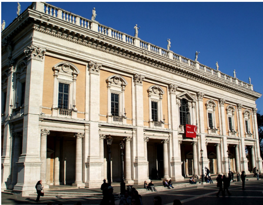
Miquel Àngel: Palazzo Nuovo, Plaça del Campidoglio, Roma.

Al final de l'escala trobem la plaça del Campidoglio on els detalls escultòrics i ornamentals capten tota l'atenció. L'entrada a la plaça es troba envoltada per un conjunt de baranes balustrades que formen el costat més ampli del trapezi, decorades amb diverses escultures afegides amb posterioritat i des d'on parteixen dos edificis amb angle obert: el Palazzo dei Conservatori i el Palazzo Nuovo . Les façanes dels edificis bessons es troben unificades per un ordre gegantí amb grans pilastres llises, i distribuït en dos pisos; el pis inferior està entès com un pòrtic, realitzat amb caràcter rústic i que no es veu des de una certa distància. Aquest pòrtic es situa entre columnes i pilastres, descansa sobre un entaulament amb dues columnes jòniques en cada va tant a l'exterior del pòrtic com als edicles de l'interior on s'emmarquen finestres amb frontó triangular i la porta al centre baix de la finestra del segon pis que marca l'eix central. L'ordre gegantí es veu representat en les pilastres corínties que abasten les dues plantes fins arribar al pis superior, que s'unifica amb les gegantines pilastres adherint-se a les cornises i els arquitraus. Aquest segon pis contraposa el gegantisme amb les treballades finestres i frontons trencats, alternant formes concavoconvexes i triangulars com a marca de l'eix central. Tot el conjunt es corona amb un arquitrav sobre el qual es col·loca una balustrada clàssica ornamentada amb escultures en els eixos de les pilastres.