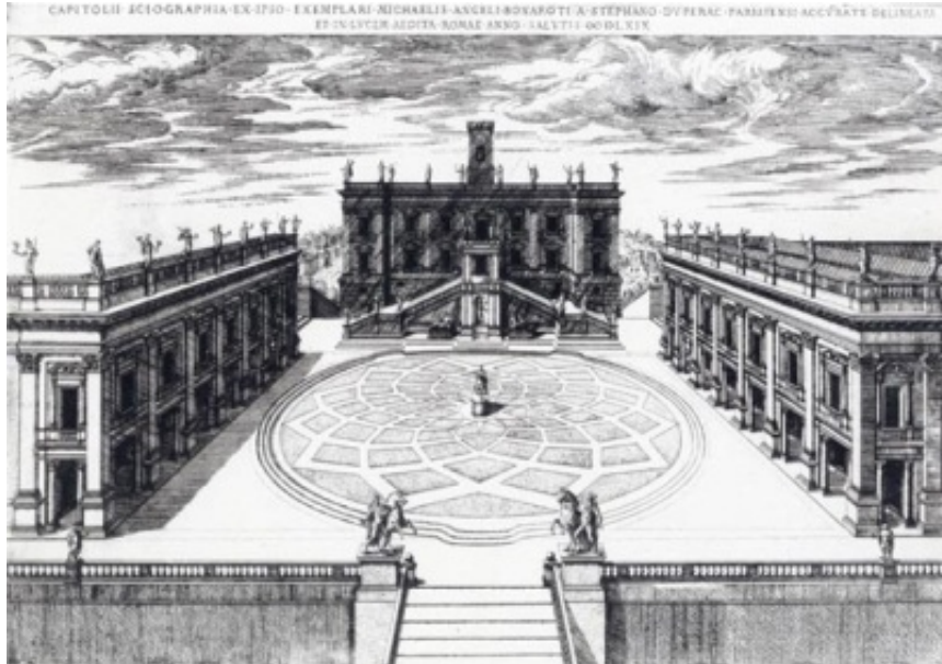
Etienne Dupérac: Projecte per a la Piazza del Campidoglio , Roma, 1569.

Actualment el Palazzo dei Conservatori i el Palazzo Nuovo s'han convertit en seu dels anomenats Musei Capitolini , un grup de museus que cobra vida al Palazzo dei Conservatori probablement al voltant de 1471 quan el papa Sixte IV decideix regalar al poble romà un conjunt d'estàtues de bronze provenint del Laterà de gran valor simbòlic com la Lloba Capitolina, la qual va instal·lar al pati del palau, convertint-se en el museu més antic del món. Després s'ampliarà amb la construcció del Palazzo Nuovo i les col·leccions Pau III i Pius V el qual va voler eliminar del Vaticà les escultures paganes.