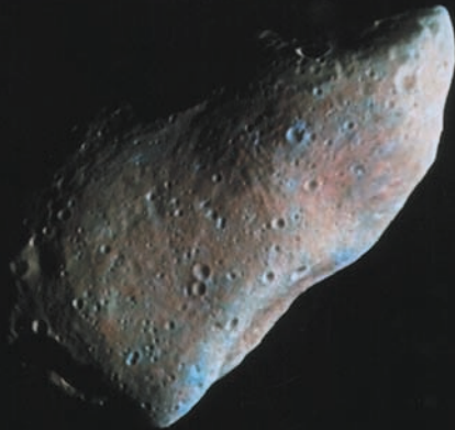
L'asteroide Gaspra fotografiat per la sonda espacial Galileu el 1991. Es tracta d'un cos irregular de dimensions aproximades de 19×12×11 km. En la seua superfície s'aprecien de forma molt evident els cràters produïts pels impactes amb altres cossos. De fet, és molt probable que el mateix Gaspra siga, en realitat, un dels trossos d'un asteroide inicialment més gran que es va trencar com a conseqüència d'una gran col·lisió.