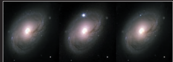
Les tres imatges de la galàxia M96, a 40 milions d'anys llum, es van fer amb el telescopi d'1.2 m de l'observatori Whipple, el 14-3-97 (esquerra), on no s'aprecia la supernova; el 18-5-98 (centre), on assoleix la màxima brillantor; i el 19-11-98 (dreta), on ja és evident que la lluminositat ha minvat.

La raó d'aquesta acceleració no és clara. Els cosmòlegs parlen, sense saber ben bé què és, d'energia fosca: no és matèria i per tant no es pot detectar per cap efecte gravitatori, tampoc no emet radiació. Es tracta d'una energia que s'associa al mateix espai buit, que actua com una gravetat repulsiva amb pressió negativa i que pot ser la responsable de l'acceleració còsmica... curiosament, això és el que fa la constant cosmològica. Molts s'han afanyat a replegar-la de la paperera d'Einstein i, encara que no siga l'única forma d'energia fosca –hi ha altres alternatives amb noms tan suggeridors com quintaessència–, la constant cosmològica produeix l'acceleració en l'expansió còsmica que les supernoves llunyanes han mostrat.