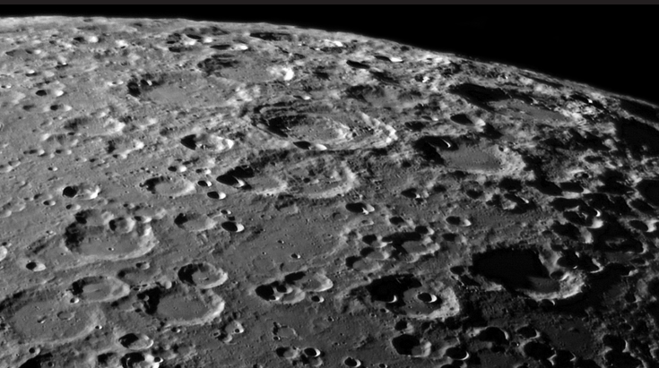
Els telescopis actuals ens mostren una Lluna plena de muntanyes, cràters i tot d'irregularitats. Galileu va ser el primer a dibuixar molts d'aquests detalls de l'orografia lunar.

«ALGUN TIPUS D'EXPLOSIÓ VA ENVIAR ELS EMBOLCALLS GASOSOS DE L'ESTEL V838 MONOCEROTIS AL MEDI INTERESTEL·LAR. AQUESTS S'ESTAN EXPANDINT. LA LLUM DE LES ÚLTIMES EXPLOSIONS DE L'ESTEL VIATJA CAP A LA POLS QUE CONFORMA LES CAPES EXTERNES I DES D'ALLÍ ES REFLECTEIX CAP A LA TERRA»