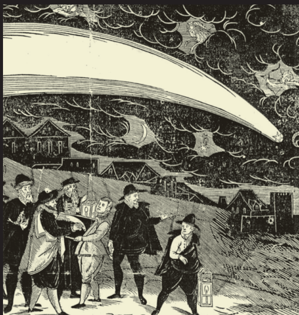
El cometa de 1577, en un detall d'una pintura sobre taula obra de Jiri Daschitzski, Praga.

L'observació del cel nit rere nit sembla abonar aquesta visió. Una vegada explicats els moviments dels astres errants que es veuen a simple vista: Mercuri, Venus, Mart, Júpiter, Saturn, el Sol i la Lluna, només l'aparició esporàdica de cometes semblava trencar aquesta visió del món. De fet, la concepció aristotèlica considera que els cometes eren fenòmens atmosfèrics, semblants als meteors o estels fugaçs, propis de la regió sublunar, encara que altres autors clàssics com ara Sèneca, Demòcrit i Anaxàgores es manifesten defensors del caràcter celeste dels cometes. Avui sabem que els cometes són petits cossos del Sistema Solar formats per acumulacions de gel d'aigua i de diòxid de carboni, mesclats amb metà i amoníac. Fan uns pocs quilòmetres de grans i giren al voltant del Sol, seguint òrbites el·líptiques bastant excèntriques. Quan s'acosten al Sol, part del material es vaporitza i arrossega partícules de pols que formen una atmosfera brillant dita cabellera . A causa de la radiació solar i de l'anomenat vent solar, els gasos i la pols de la cabellera surten expulsats lluny del