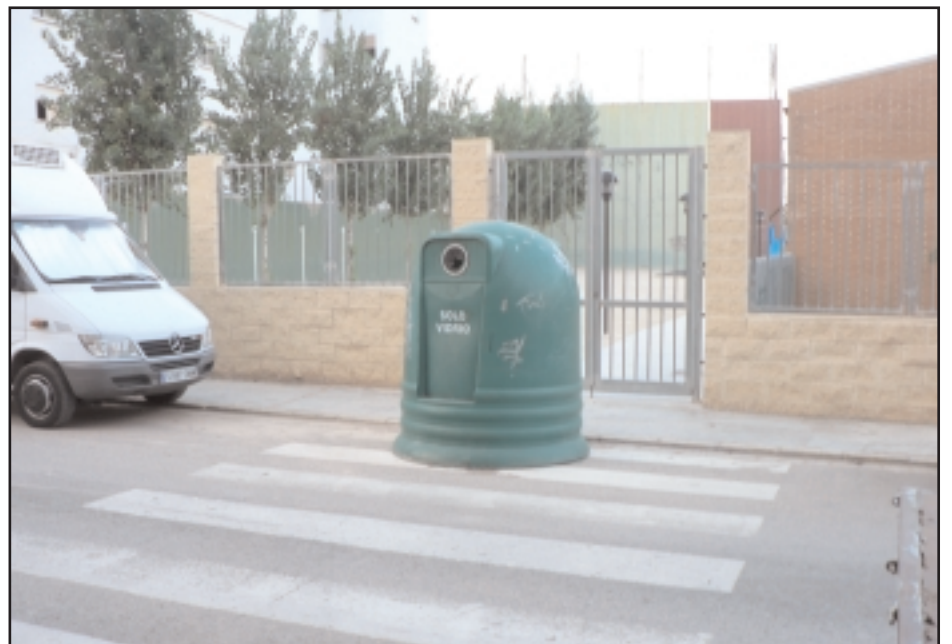
Hay que reciclar...¿el paso de peatones?