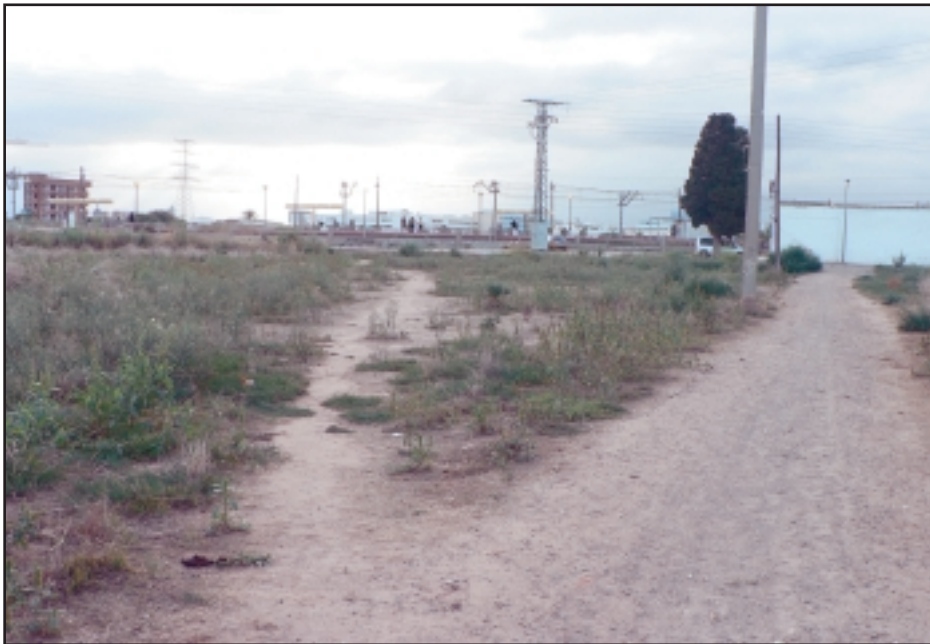
Avenida del Metro.