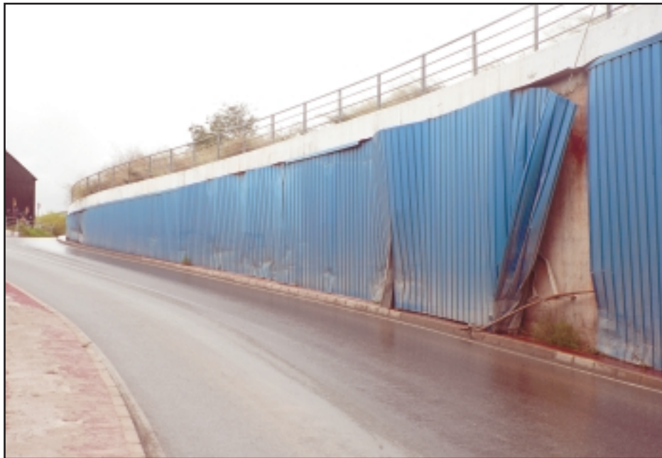
El túnel de La Patacona, "se pela".