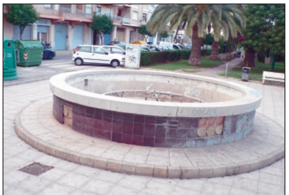
Las fuentes de "nunca acabar"