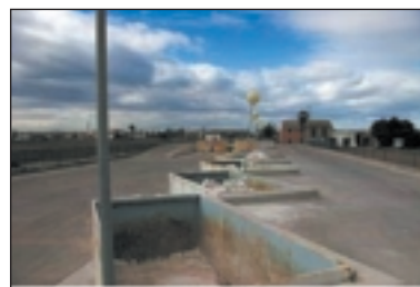
Ecoparc d'Alboraya (Horta Nord) Camí de calvet, parcel·la 41.