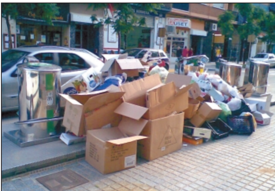
Operación imposible, ¿no cabe?