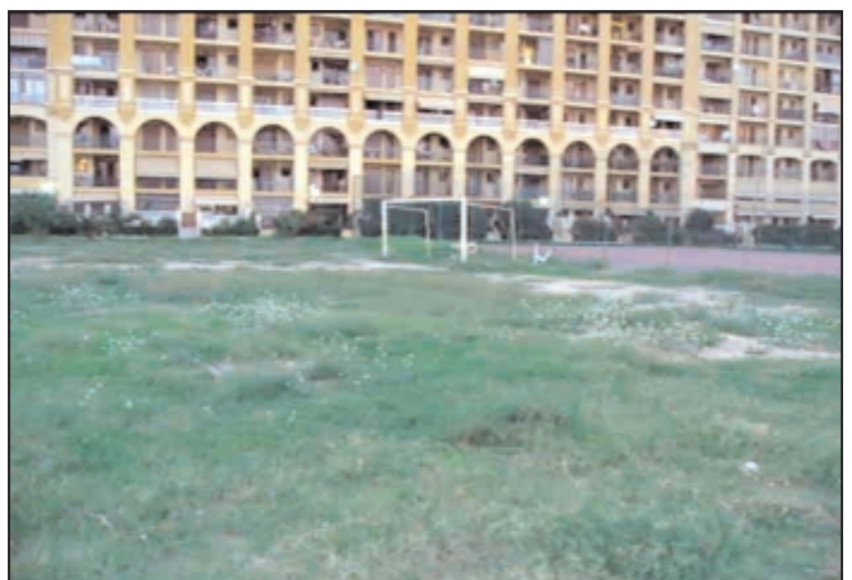
Fútbol en saplaya: todo sigue igual.