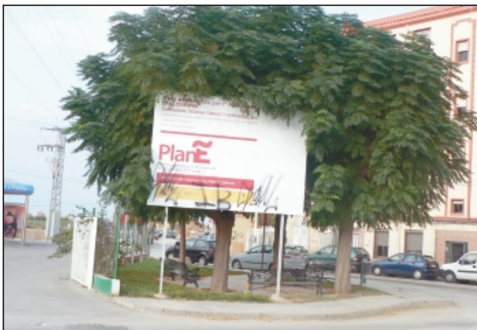
Cartel del Plan E Divino Maestro. Si lo buscas lo encuentras.