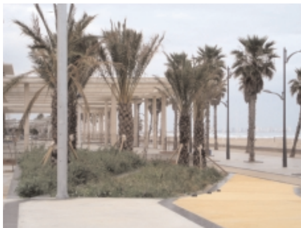
Per la desídia del govern municipal del PP els nous jardins llueixen un aspecte abandonat.