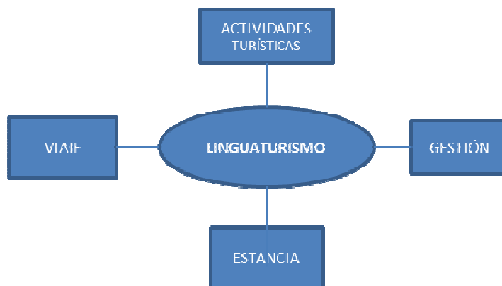
Figura 3. Subcampos del mapa Linguaturismo

Según las diferentes relaciones semánticas, hemos estructurado el mapa en cuatro subcampos: