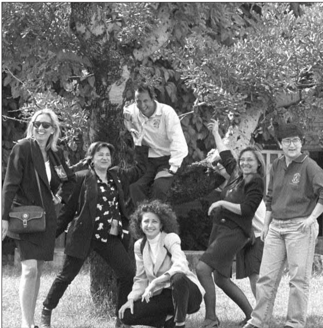
Alguns membres del Club del Desahogo mostren el seu bon humor des de distintes perspectives.

La major part dels seus components són dones. Tots treballen a la Universitat i busquen fugir de l'estrés. S'anomenen el Club del Desahogo. I Nou DISE els posa al descobert