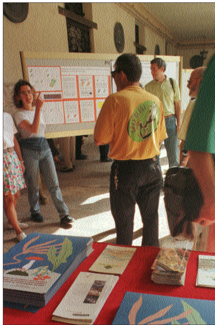
Participants en el congrés de Botànica Criptogàmica celebrat a València.

Inscripcions: Al Servei d'Educació Física i d'Esports de la Universitat de València. Lloc: Carrer de Menéndez y Pelayo, número 19. Dirigits a: Estudiants, PAS i PDI. Telèfon: 398 32 36.