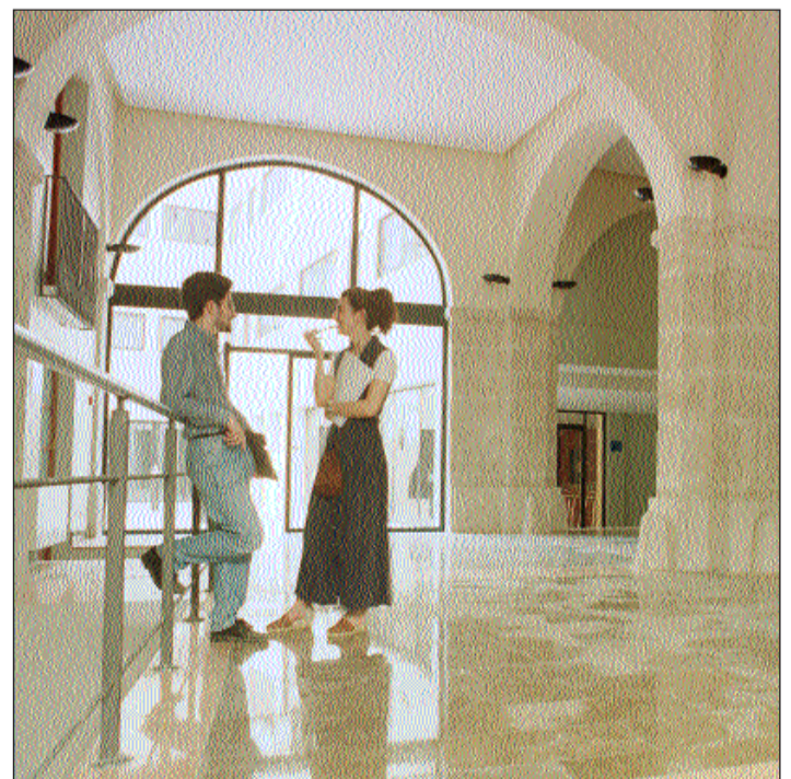
Interior del nou Col·legi Major de la Universitat.

En la rehabilitació s'han recuperat els elements significatius des del punt de vista patrimonial i arquitectònic, com ara la Muralla Islàmica (s. XI), la Torre Miramar (s. XVIII), la volta amb llanterna (s. XIX) que corona l'escala principal i les cornises i els ampits de la façana.