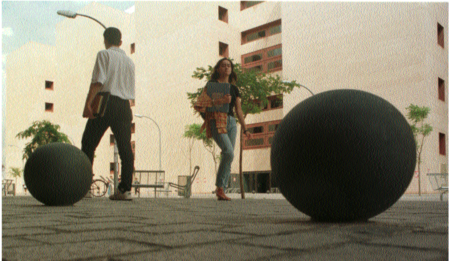
L'Aulari Nord del Campus dels Tarongers.