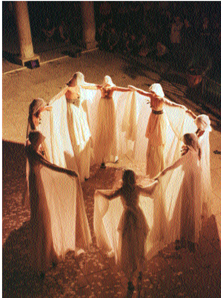
El grup Oniria Teatre, la nit de la cloenda al Claustre del carrer de la Nau.

Les vesprades les aules es convertiren en cuines temporals i s'ompliren d'espècies, de vins o d'espínacs. Al pati sonaren les castanyoles i les notes d'algunes danses tradicionals, i molts aprengueren a comunicar-se per signes. Eren els tallers de La Nau que aportaren als estudiants un component més vivencial i pràctic: Cuina medieval ; Fanzines ; Fer paper reciclat artesà ; Consum ecològic ; Llengua de signes ; Acció teatral ; Creació de pàgines web ; Com es parla en públic ; etc.