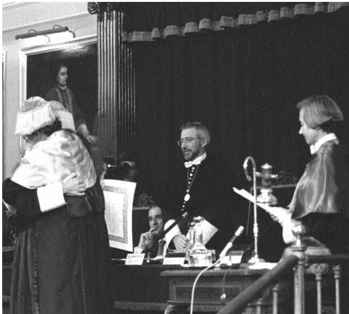
Investidura dels nous doctors, durant l'acte d'obertura del curs al Paraninf.

El rector va fer una defensa de l'autonomia universitària davant de l'intervencionisme polític. "Convé no oblidar -va dir- que aquesta autonomia ha estat sempre condicionada per l'interven-