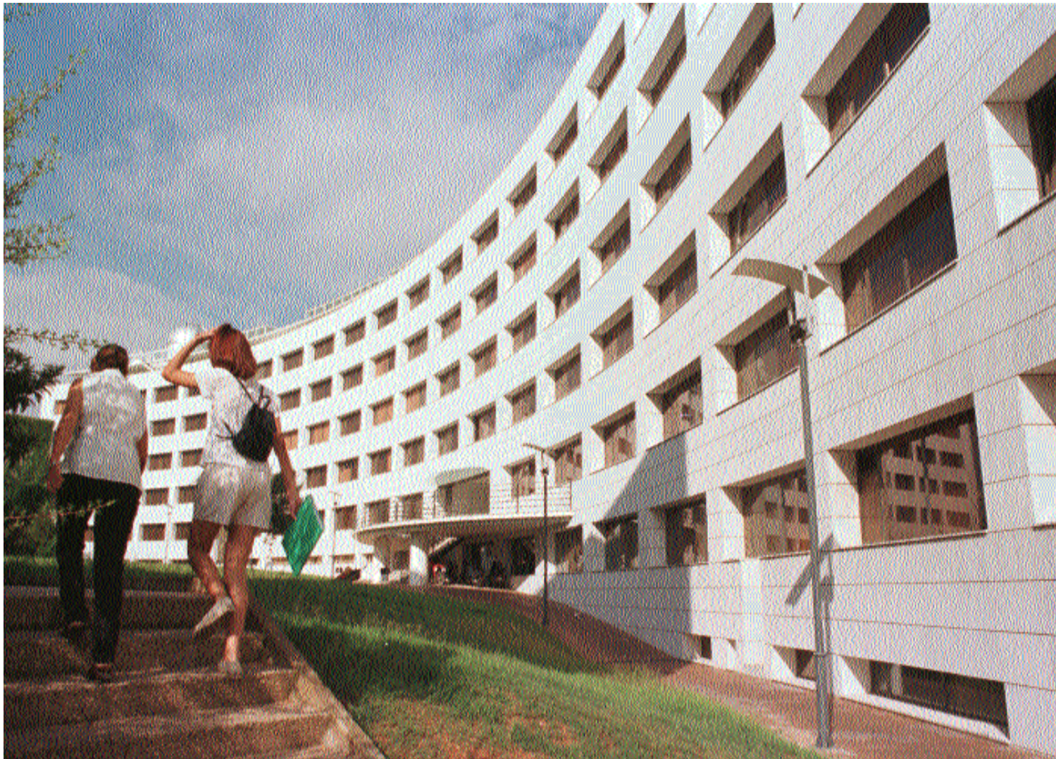
L'edifici d'investigació Jeroni Muñoz envolta el campus per l'oest.