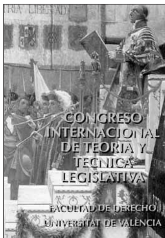
Fullet editat per al Congrés.