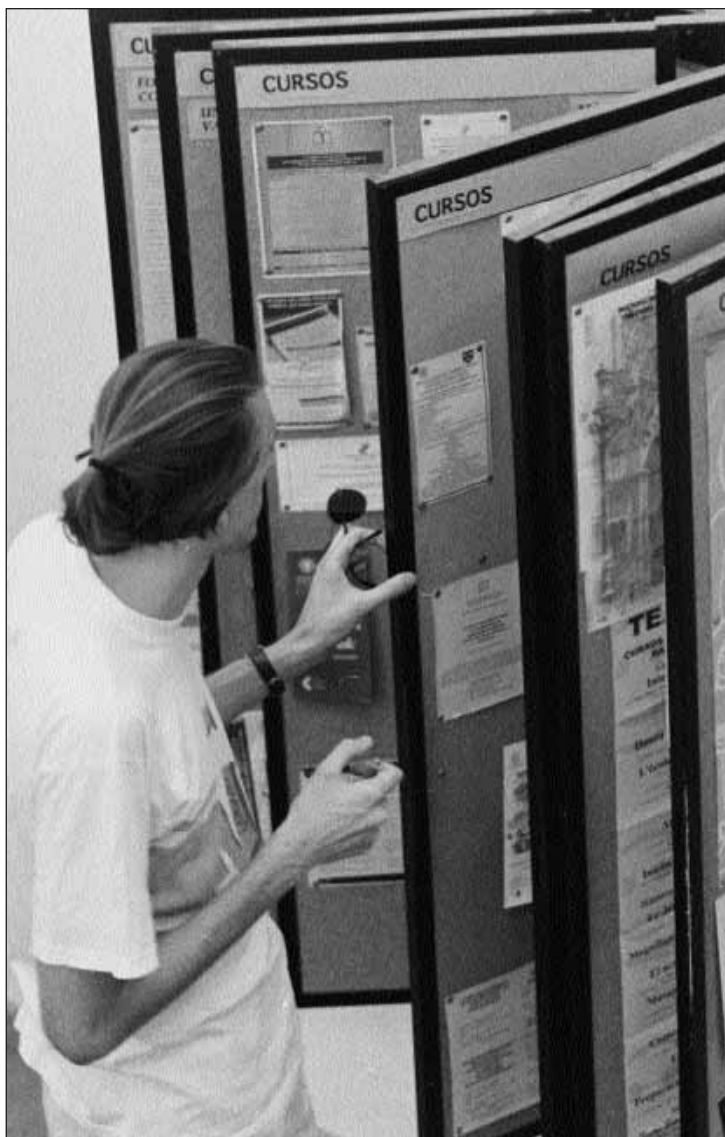
Al DISE es pot trobar informació actualitzada sobre l'oferta de beques.

El Consell Superior d'Esports ha posat en marxa el programa de formació pràctica de postgrau dirigit a titulats superiors i diplo-