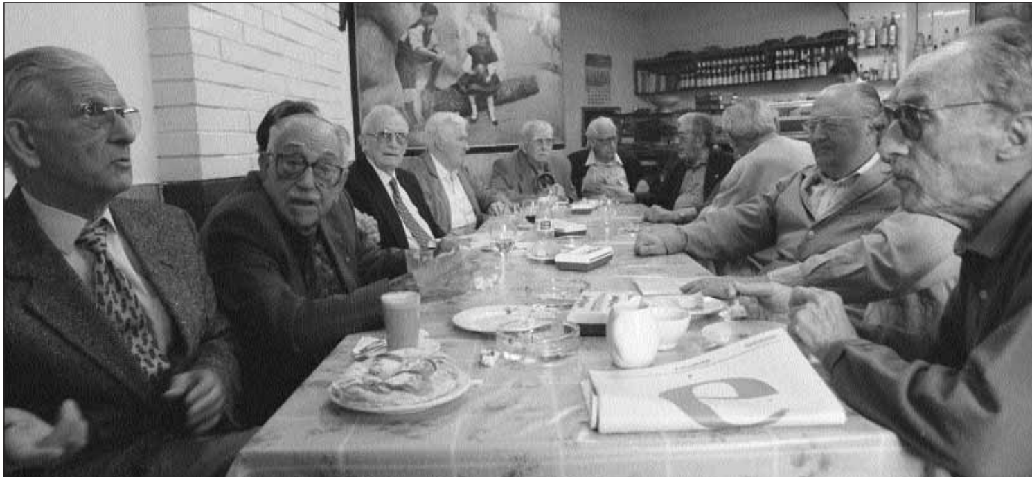
Alguns dels integrants de la FUE, durant el seu esmorzar setmanal a la Taverna Gallega.

Antics membres de la FUE continuen reunint-se cada setmana