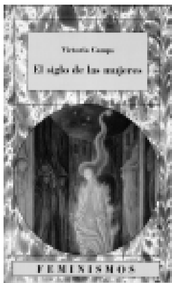
Portada del llibre de Victoria Camps

igualtats o vexacions que poden patir les dones" i recorda que per al feminisme "allò privat és polític". En el seu assaig parteix de dues propostes per al segle XXI força suggerents. Per una banda, la feminització dels homes. Això vol dir, prenent distàncies de l'anomenat feminisme de la diferència, que "de la mateixa manera que la dona s'ha fet més home i s'ha apropiat d'avantatges que foren exclusius dels barons, a aquests el pertocaria ara fer el moviment invers i aprendre de les vides de les dones allò que tenen socialment de positiu, que no és poc". La segona estratègia que proposa Victoria Camps és la universalització o mundialització del feminisme. "Universalitzar la causa feminista -escriu- significa no deixar-la només en mans de les dones, la qual cosa, a hores d'ara, significa a la vegada reduir-la a projectes marginals propis d'institucions i de ministeris d'afers socials". En canvi, Camps pensa que la causa