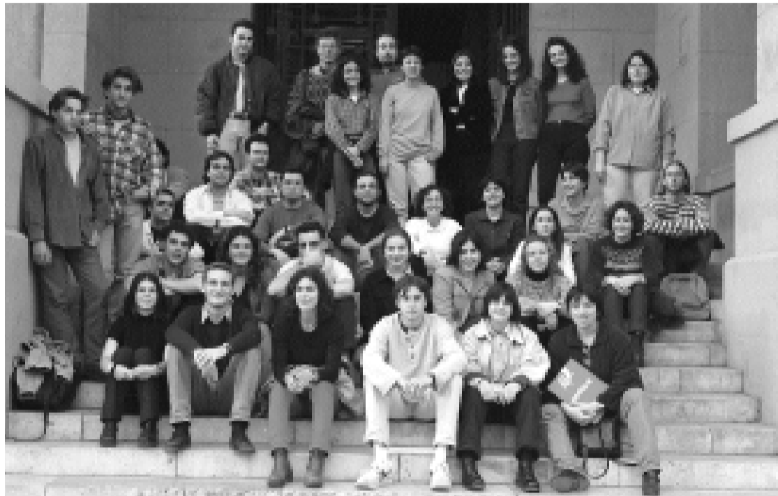
Els cinquanta estudiants de la Universitat que feren de guies als alumnes de COU, en les escales de l'antiga Facultat de Ciències

Al llarg dels mesos de febrer i març presentacions com ara aquesta han encapçalat els recorreguts dels guies col·laboradors de la Universitat de València. Són una cinquantena d'estudiants universitaris que s'han oferit com a voluntaris del programa Conèixer la Universitat . Aquesta iniciativa pretén que els estudiants del Curs d'Orientació Universitària (COU) tinguen un primer contacte físic i espacial amb la Universitat. Els guies s'han encarregat de conduir-los per les instal·lacions i explicar-los els serveis que ofereixen. És