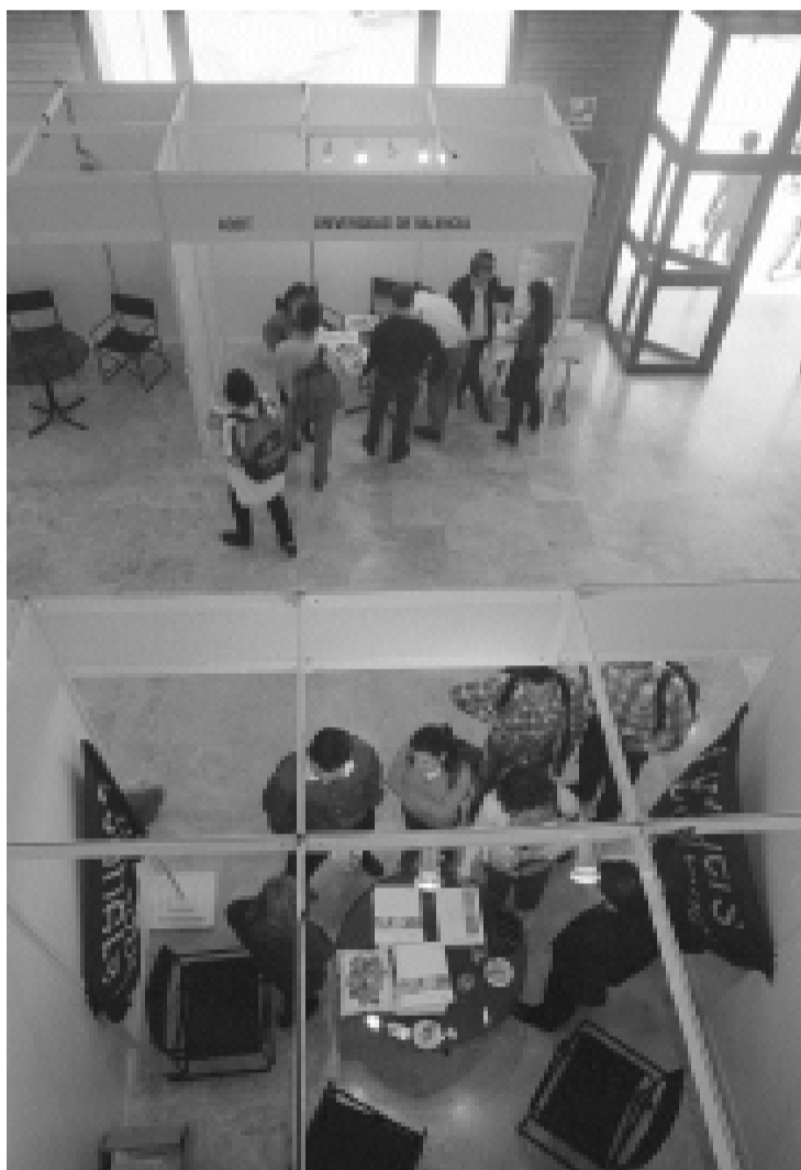
Una imatge de la Fira d'Empreses muntada al Campus dels Tarongers.

El CEV ha posat a l'abast dels visitants un llibre amb tests d'autoavaluació per a determinar les qualitats i possibilitats de triomfar en aquest camí tan difícil. "Crear una