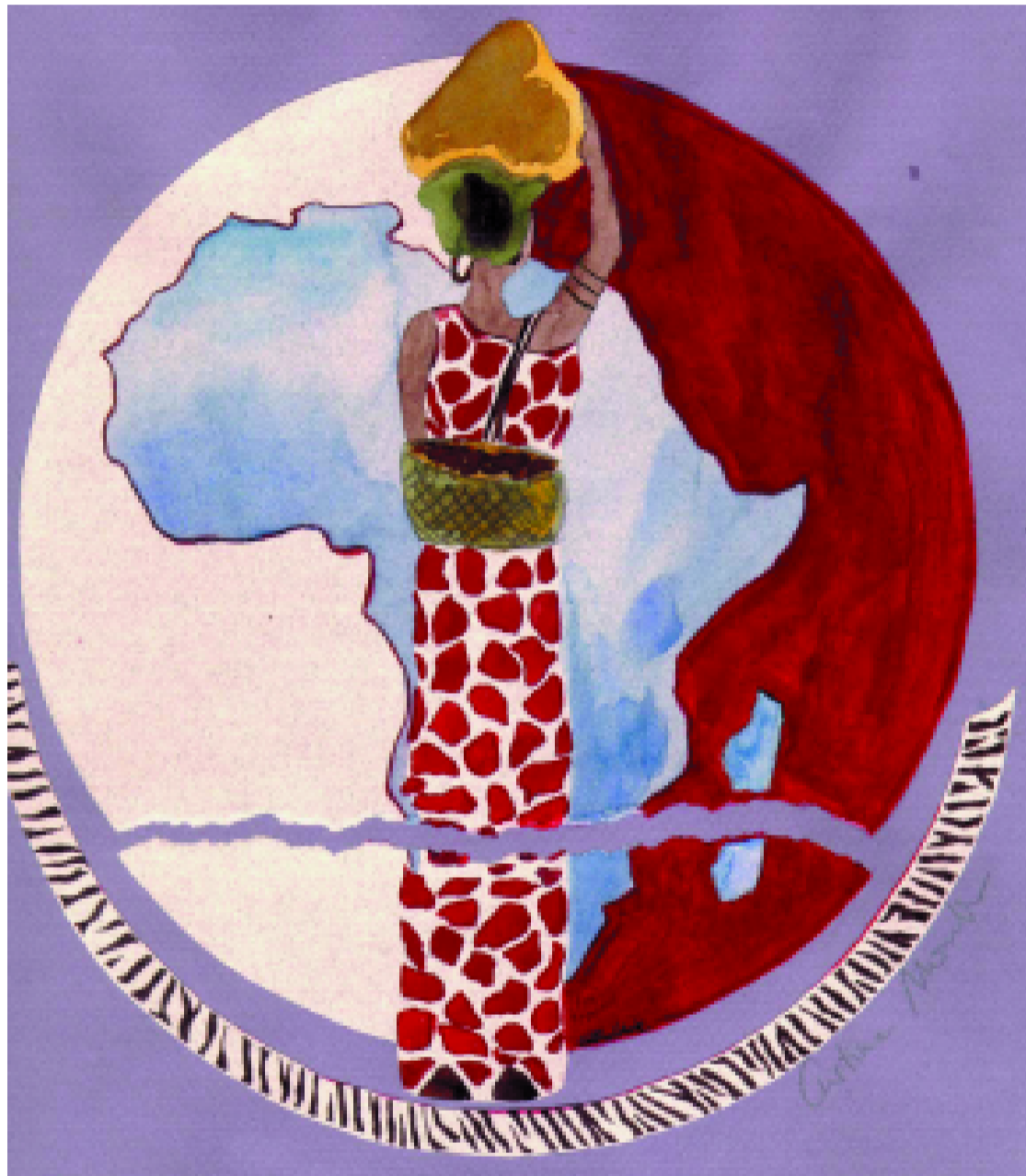
Detall del cartell de les jornades sobre Àfrica.

Partint de la idea que els mitjans de comunicació ens dibui-