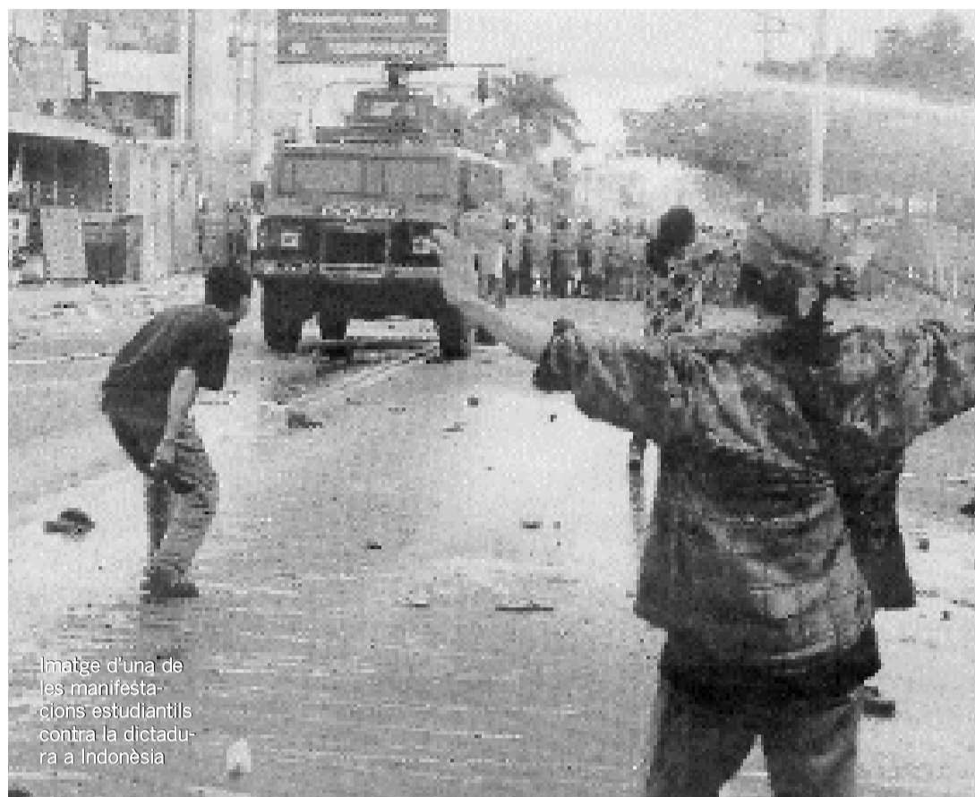
Imatge d'una de les manifestacions estudiantils contra la dictadura a Indonèsia