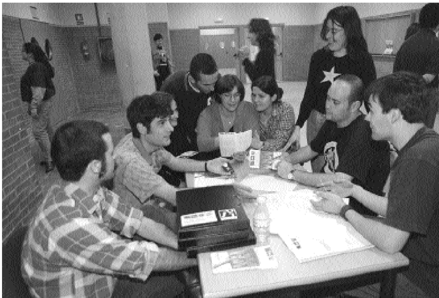
Estudiants participants en el II Congrés d'Associacionisme i Voluntariat Universitari al Campus del Riu Sec de Castelló.

Enguany, s'hi van crear quatre blocs d'interès: Els mitjans de comunicació en el món de l'associacionisme , amb especial atenció a la difusió d'activitats mitjançant noves tecnologies; Els problemes de la participació estudiantil ; Finançament i gestió econòmica de les associacions ; i Serveis universitaris , que incidia en els criteris d'avaluació com a guia del dinamisme i de l'adequació a les necessitats dels usuaris. La ponència marc d'aquest bloc va ser presentada per un