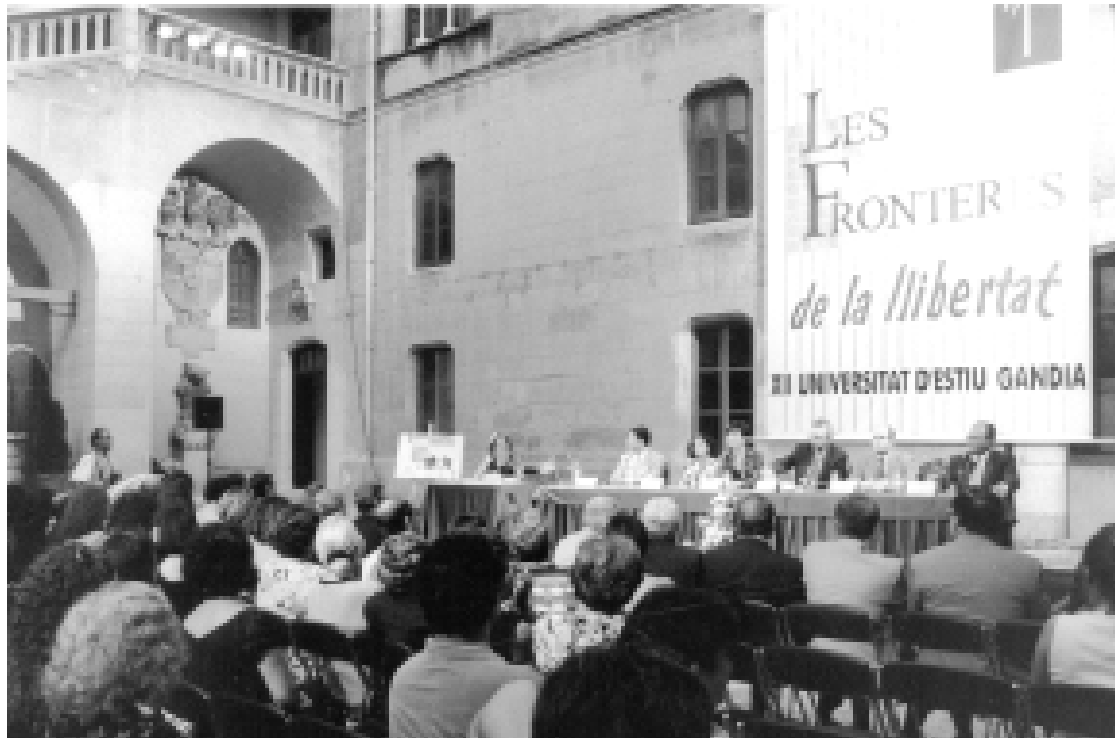
Un acte de la Universitat d'Estiu-Gandia, en una imatge d'una passada edició.

Noves històries , coordinat per Francesc Gimeno, reflexionarà sobre les contraposicions epistemològiques subjacents entre la història de l'estat burgès i la dels