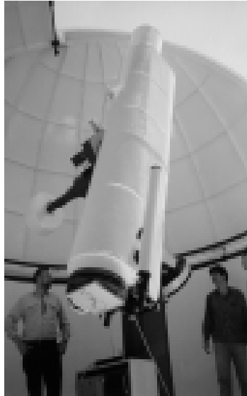
Imatge del telescopi.

objectiu fotogràfic de 30 cm de diàmetre, i la seua distància focal és de 3 m, segons la descripció feta pel professor Álvaro López, director del Centre Astronòmic. El sistema òptic està suportat per una robusta muntura equatorial, la qual compensa amb el seu moviment el de rotació de la Terra, permetent així l'orientació contínua i precisa de l'instrument cap a una regió del cel. El telescopi té un pes de 1.700 quilograms i s'assenta sobre un pilar de formigó d'una tona. El recinte de fusta circular on està ubicat té un sòl de fusta elevat per a evitar les vibracions i es cobreix amb un cúpula semiesfèrica de sis metres de diàmetre, que ha estat fabricada a València i té un pes de tres tones. Aquesta forma semiesfèrica disminueix la resistència al vent i atenua la temperatura interior, evitant que