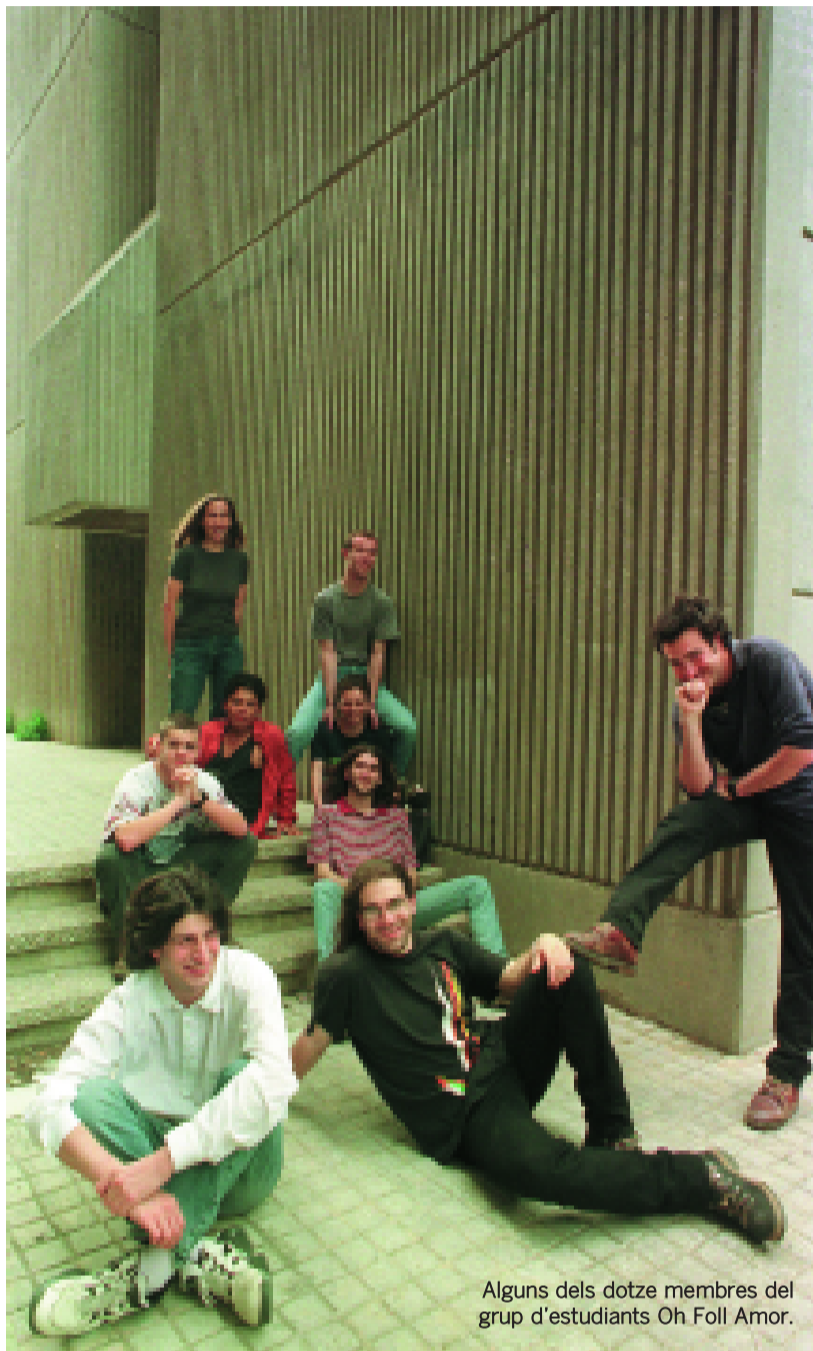
Alguns dels dotze membres del grup d'estudiants Oh Foll Amor.

Als qui diuen no entendre els poetes, Oh Foll Amor replica que la poesia és tot un món per descobrir i que només cal un xicotet esforç