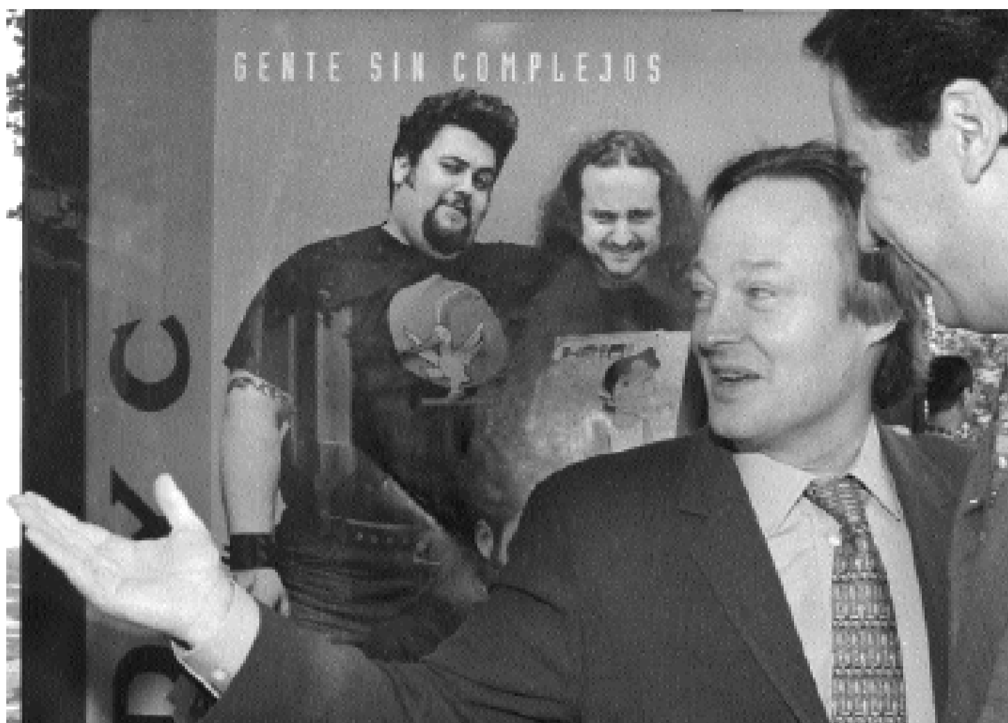
El ministre Josep Piqué i el president autonòmic, Eduardo Zaplana, en arribar a la Facultat de Medicina el passat dimecres.