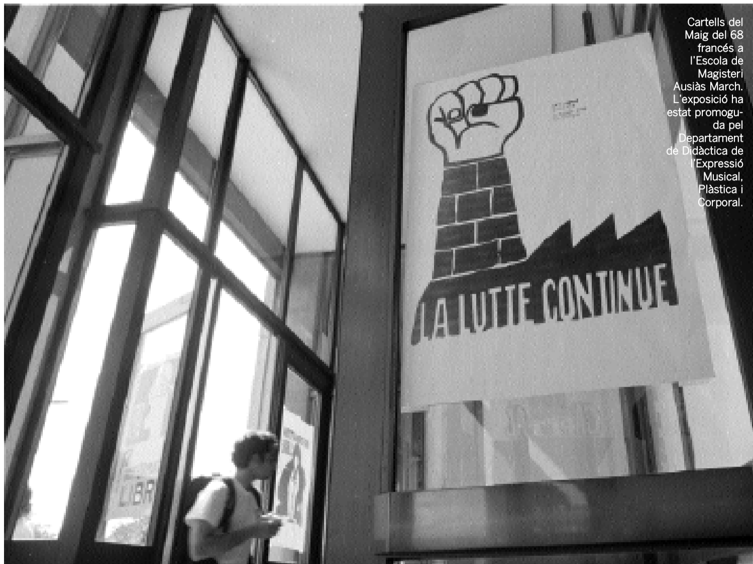
Cartells del Maig del 68 francès a l'Escola de Magisteri Ausiàs March. L'exposició ha estat promoguda pel Departament de Didàctica de l'Expressió Musical, Plàstica i Corporal.