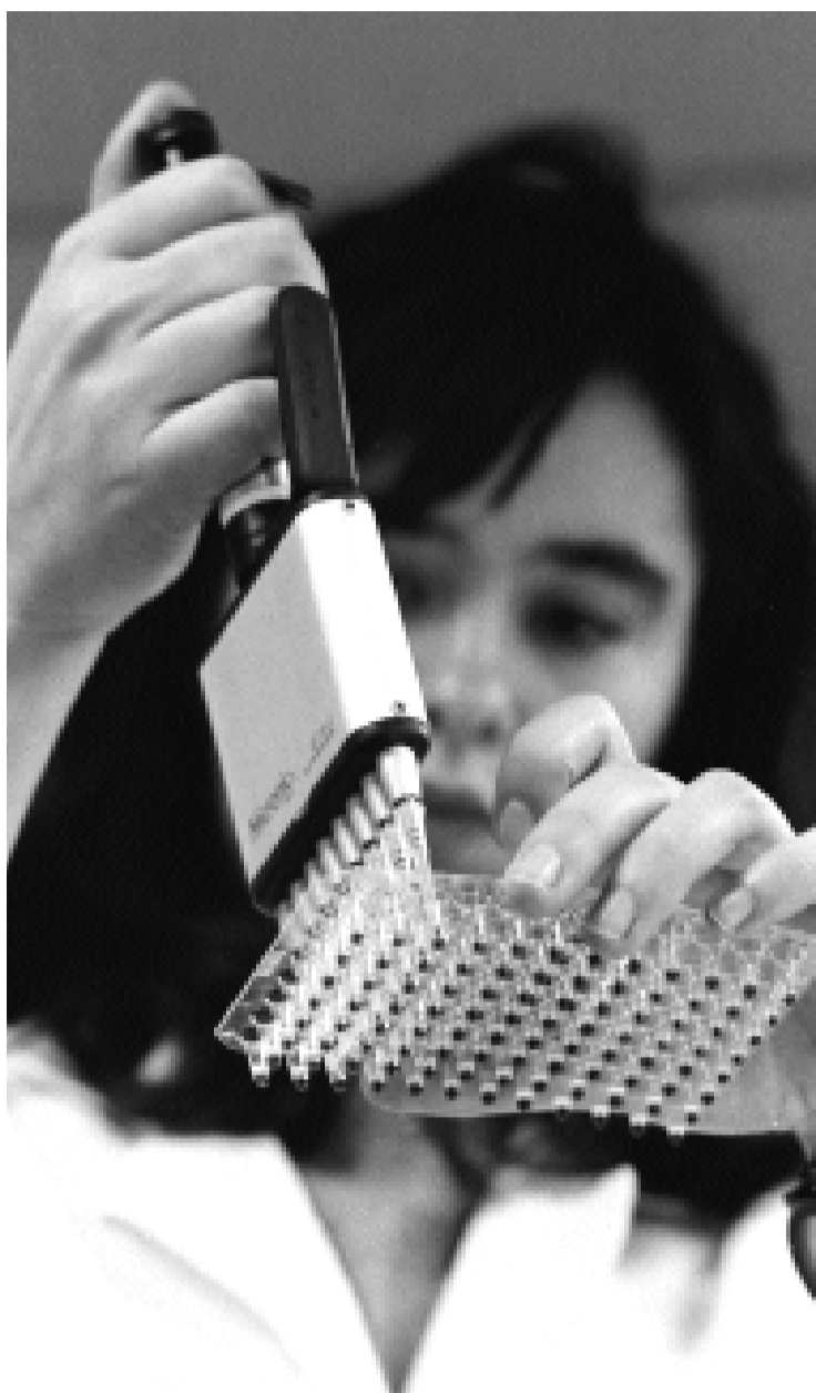
Una investigadora realitza el seu treball en un laboratori.