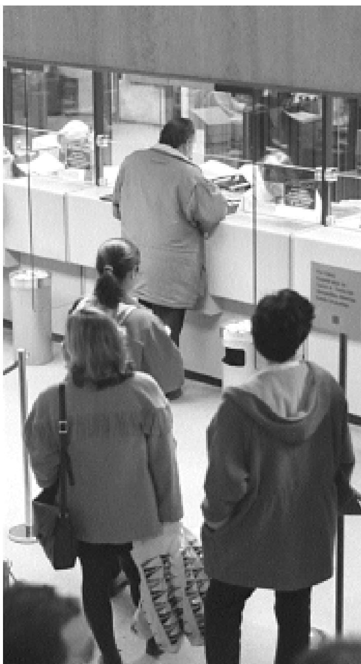
Clients fan cua en una oficina bancària.

Els sol·licitants del préstec no estan obligats a tornar els diners durant el primer any, però després