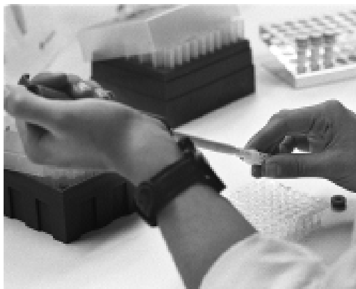
Treballs d'investigació en un laboratori de la Universitat.

Sobre les grans inversions en investigació militar, va assenyalar que des del Projecte Manhattan per a l'obtenció de la bomba atòmica el següent cas "que no va tindre resultat" fou la Guerra de les Galàxies de Reagan. "Però la investigació militar, que les administracions