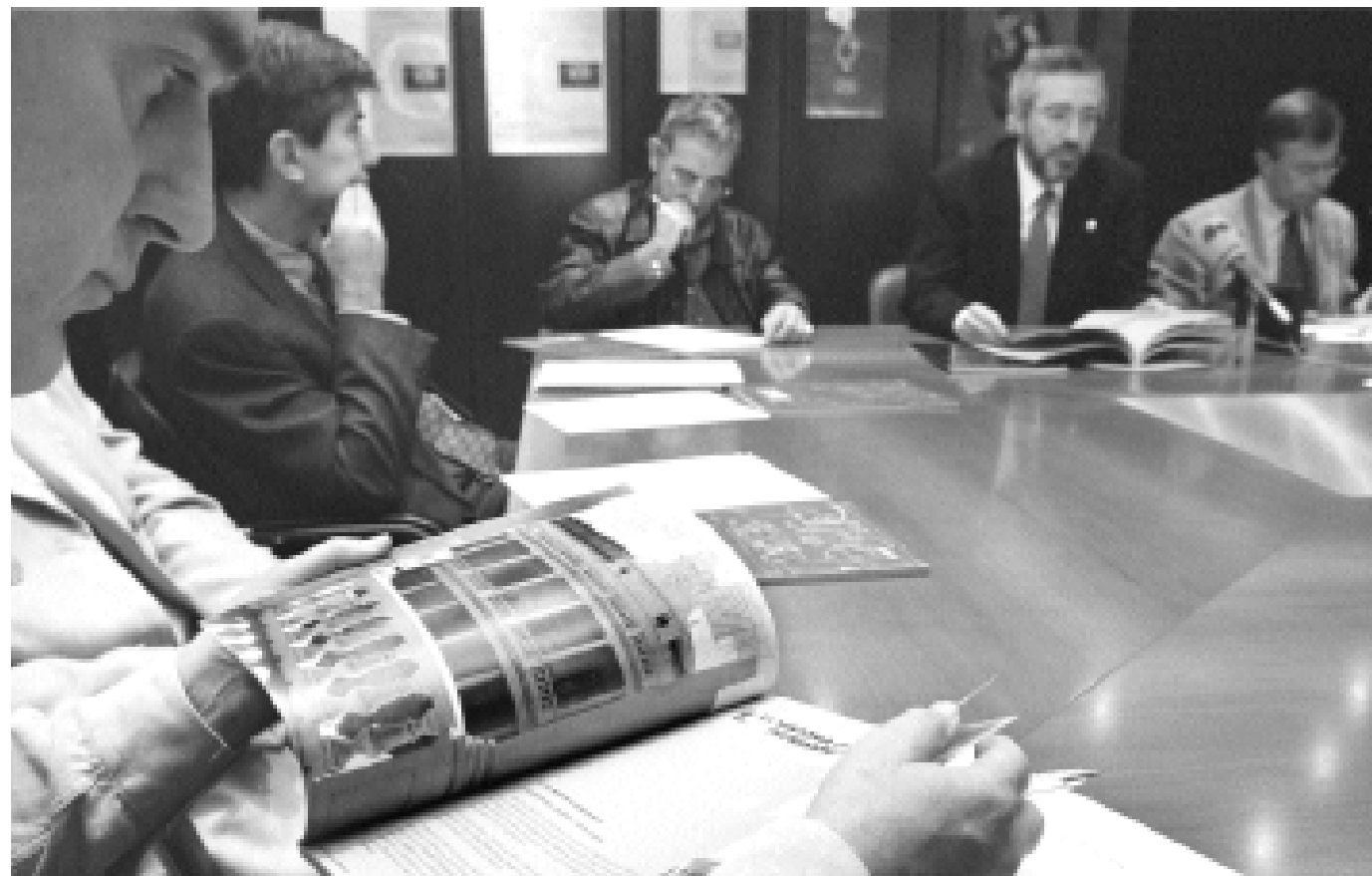
Una imatge de la presentació del catàleg de les activitats de Cinc Segles per a aquest curs.

SABIES QUE...? Els Jurats que el 30 d'abril del 1499 es reuniren amb el notari síndic Bernat d'Asís a casa del racional Gaspar Amat per aprovar les constitucions de l'Estudi General eren Jaume Vallès, Damià Bonet, Bernat Vidal, Lluís Amalrich i Pere Belluga.