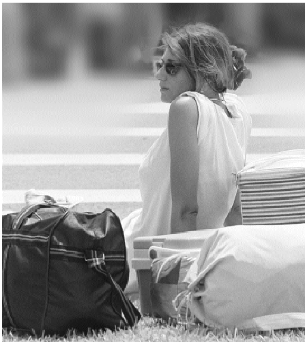
Una estudianta, amb la motxilla preparada, en una imatge d'arxiu.

La xarxa la componen deu albergs i tres campaments, però en les dates hivernals només n'hi ha disponibles sis. Tres d'ells són gestionats directament per l'IVAJ i els altres per empreses o entitats privades, però les tarifes són les mateixes en els sis. Fins als vint-i-cinc anys inclosos, en temporada alta que inclou Nadal, Setmana Santa i de maig a setembre, costa 1.700 pessetes al dia en pensió completa i, si només voleu allotjament i desdèjuni, 770. A partir dels vint-i-sis anys, en Nadal costa 2.225 pessetes la pensió completa i 1.240 l'allotjament i desdèjuni. A més, hi ha descomptes amb el Carnet Jove. Els albergs gestionats per l'IVAJ, L'Argentina a Benicàssim, Mar i Vent a la platja de Piles, i Torre