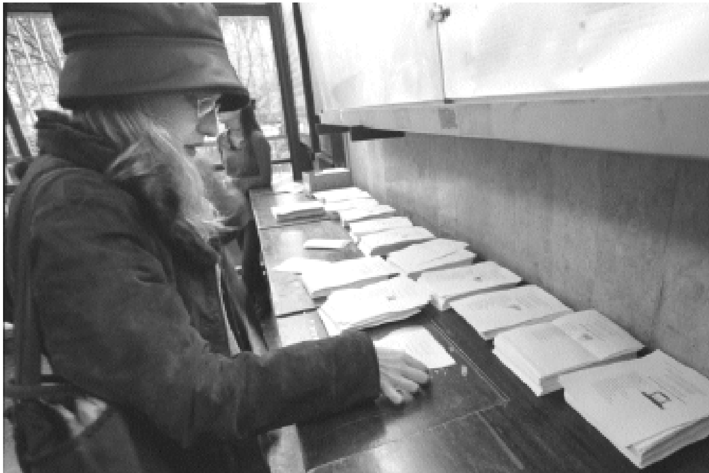
Una estudianta consulta les candidatures abans de votar en les passades eleccions al Claustre.