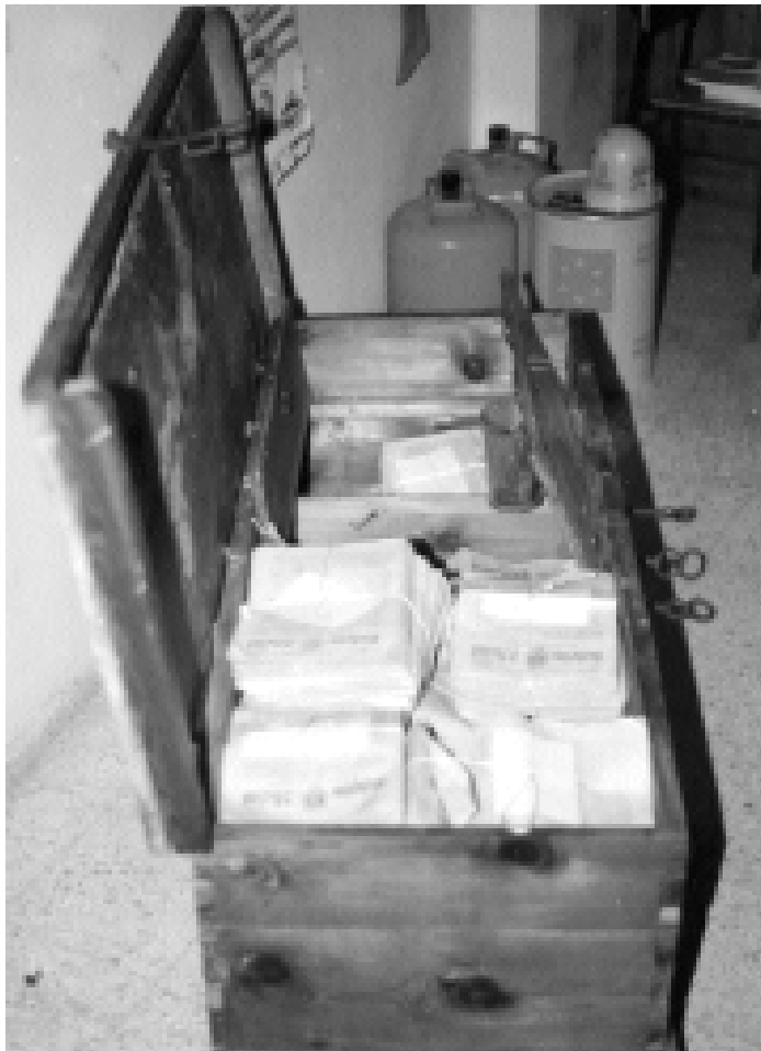
Arqueta de l'arxiu del Toro on estaven dipositats molts documents.

De resultes d'això, la tasca comença un fresc (massa) dia de principis de primavera. El grup de treball es reuneix i viatja al Toro per a prendre un primer contacte amb l'objecte del seu treball. Aquesta primera passa va consistir en una avaluació a colp d'ull del volum i caràcter divers de la documentació. A partir d'aquest moment, s'inicia la preparació de la faena, la qual restà fixada per al proper estiu. Calculem el nombre de caixes arxivadores i carpetes necessàries, el temps aproximat que ha de costar d'ordenar, inventariar i instal·lar la documentació. Una part d'aquesta, la més antiga, ja havia sigut ordenada i instal·lada en la prestatgeria per tècnics de la Diputació de Castelló. Així i tot, hi trobarem nombrosos documents pertanyents a aquest grup barrejats amb la resta. Una altra part, relacionada amb l'exèrcit (el Toro fou zona de front en la Guerra Civil i la presència militar, amb una base permanent de recolzament aeri, hi ha