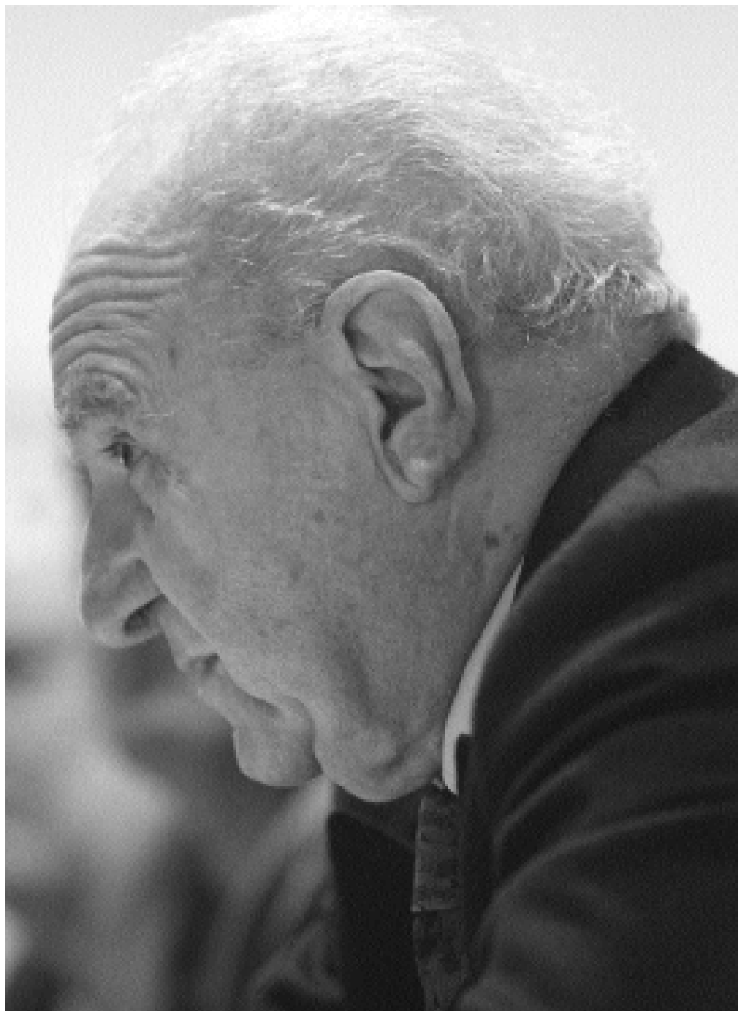
Roger Garaudy, durant la seua intervenció en el curs sobre les tres religions.