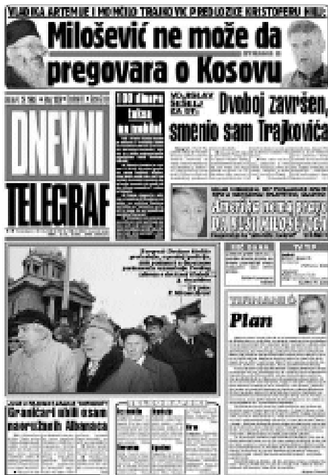
Portada d'un diari editat a Sèrbia.

A partir d'ací es posaren en marxa les mesures repressives del govern per a posar en vigor la llei contra l'o-