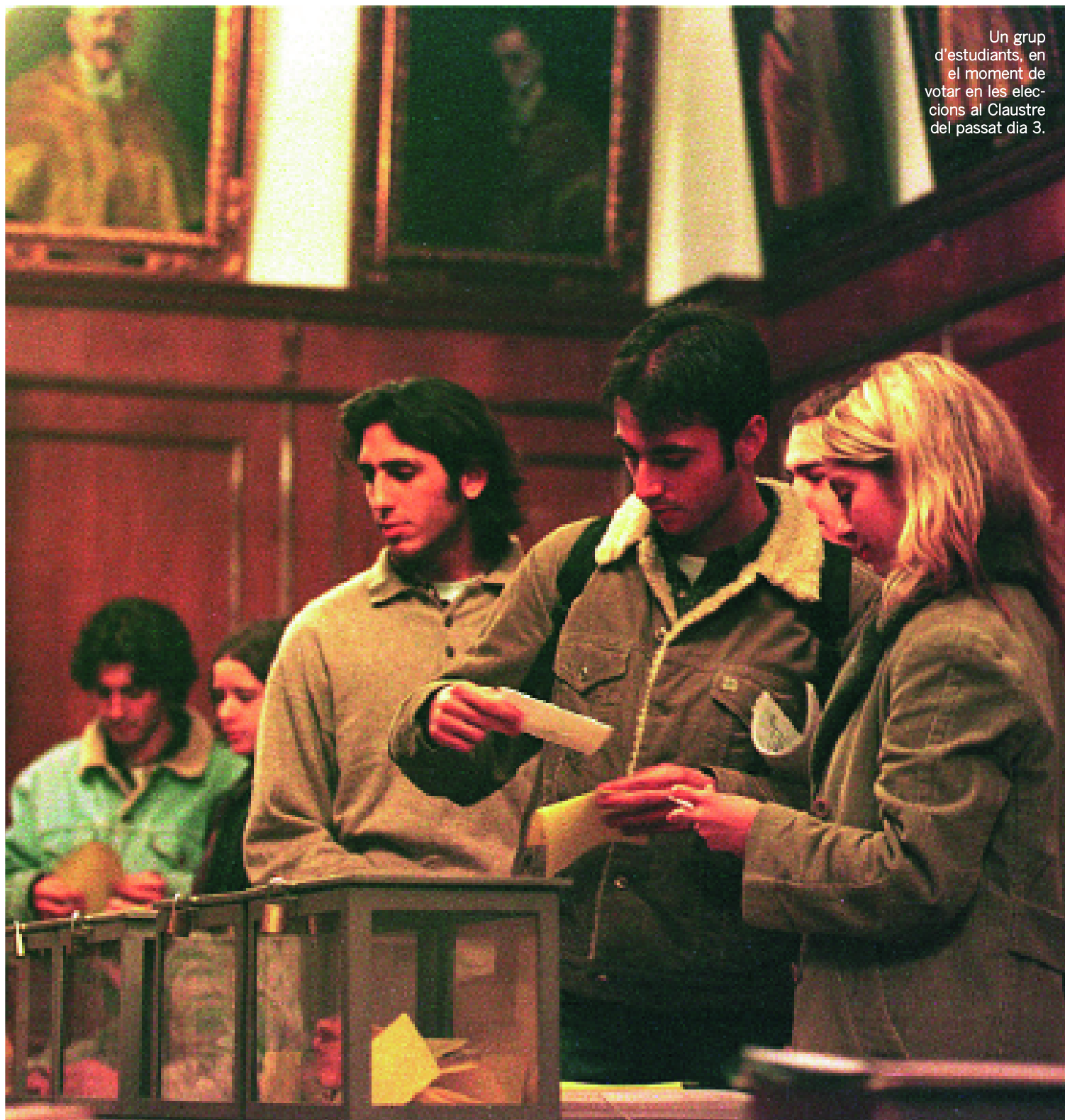
Un grup d'estudiants, en el moment de votar en les eleccions al Claustre del passat dia 3.