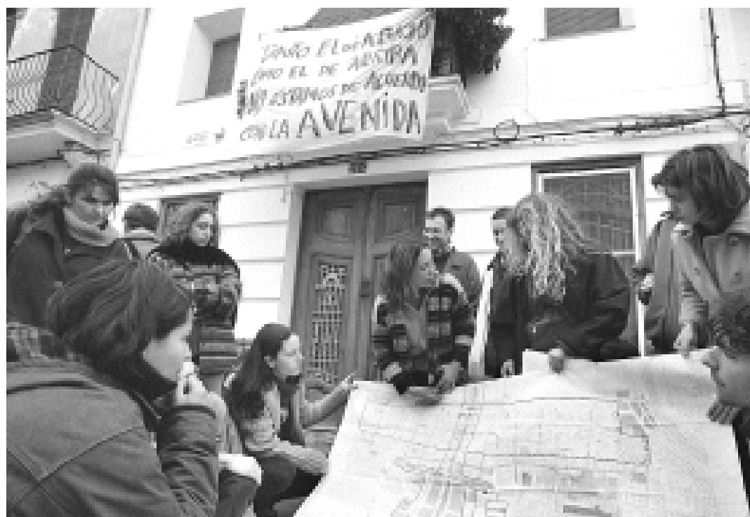
Alguns dels artistes planifiquen els espais de les exposicions.

Dos-cents artistes exposen les seues obres en una mostra reivindicativa