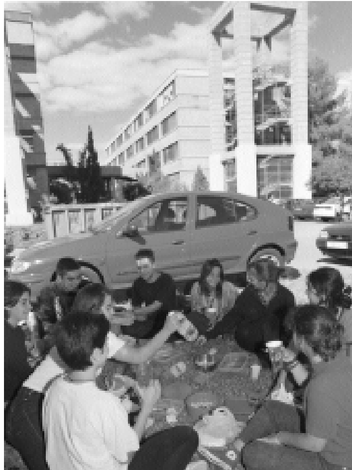
Estudiants, a l'hora de l'esmorzar en un jardí universitari.

Com a exemple d'un recordatori de 24 hores, ací tenim el següent. Per a un desdèjuni, en l'apartat d'aliment podem escriure: llet amb cacau en pols, galetes i dacsa torrada. Després, en l'apartat d'ingredients, concretament: llet sencera de vaca (marca xxx), sucre, cacau en pols (marca xxx), galetes de xocolata (marca xxx), flocs de dacsa torrada (marca xxx). En l'apartat de mesura casolana, posarem: una tassa de desdèjuni