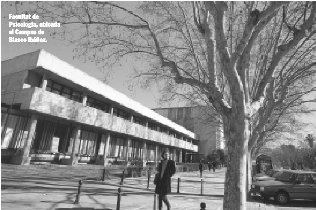
Facultat de Psicologia, ubicada al Campus de Blasco Ibáñez.

Un Congrés d'Ensenyament de la Psicologia per a celebrar l'aniversari