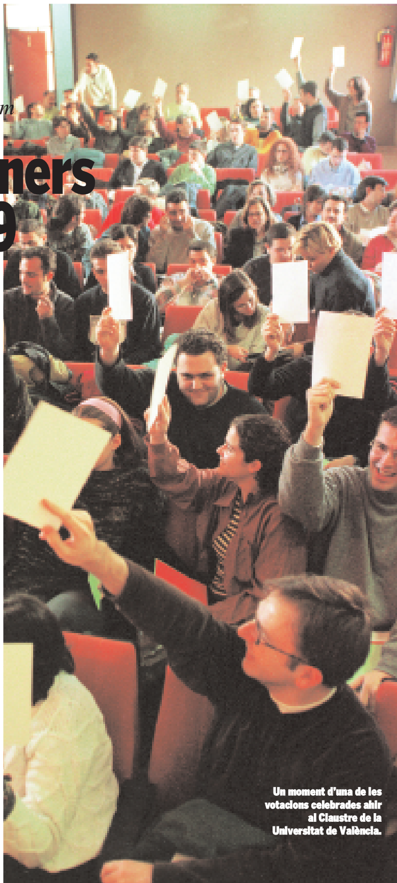
Un moment d'una de les votacions celebrades ahir al Claustre de la Universitat de València.