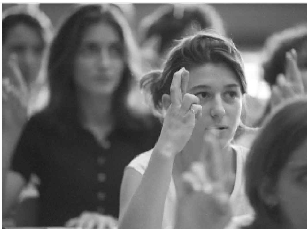
Taller de la Universitat per aprendre el llenguatge dels sords.