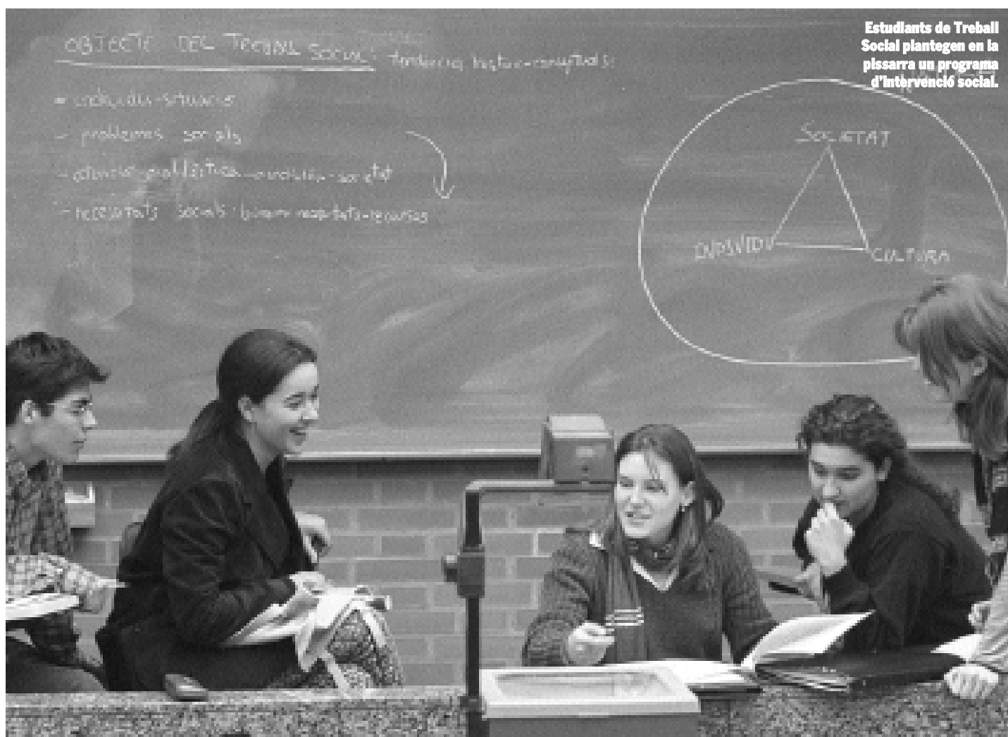
Departament de Treball Social i Serveis Socials

El seu punt de mira és el carrer. Allí és on investiguen els professionals del Departament de Treball Social de la Universitat. Estudien i avaluen programes d'intervenció amb famílies que pateixen mals tractes i crisis contínues, amb drogodependents, malalts mentals i persones que es troben en situacions de desigualtat i marginació. Són investigadors que s'enfronten, dia a dia, amb la realitat social més crua que tenim al nostre costat.