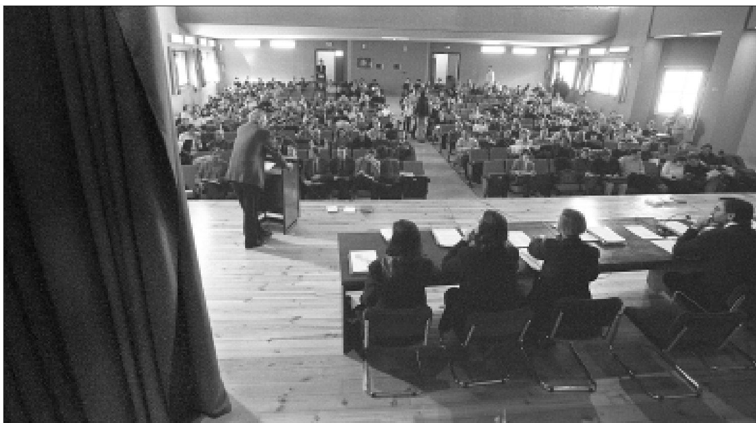
El rector, durant una de les seues intervencions, ahir, davant el Claustre.