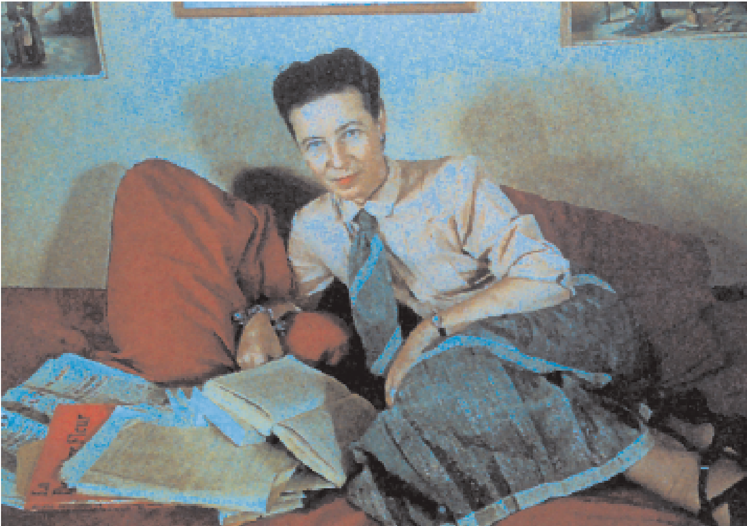
La Universitat reedita el llibre feminista clau escrit per Simone de Beauvoir