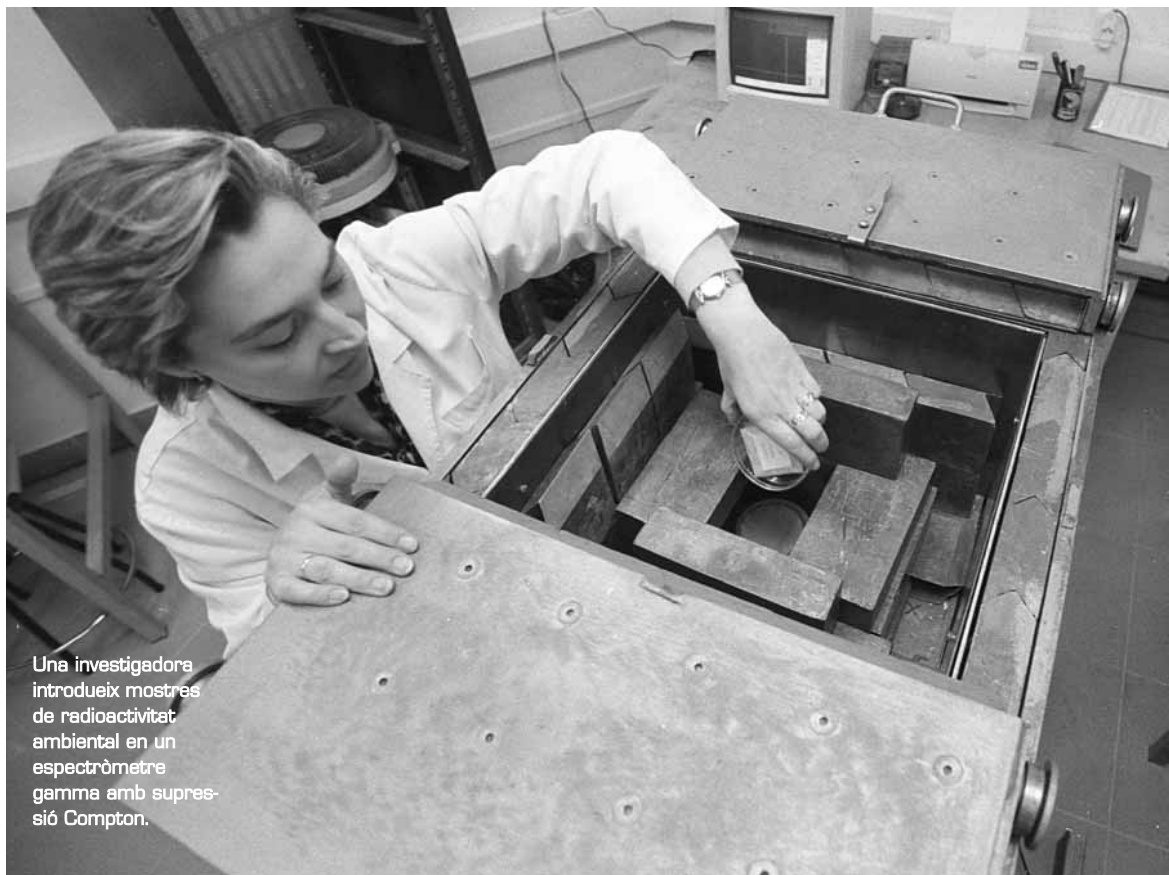
Una investigadora introdueix mostres de radioactivitat ambiental en un espectròmetre gamma amb supressió Compton.

La tecnologia de materials, l'electromagnetisme, la tecnologia microelectrònica, optoelectrònica i de comunicacions, l'acústica ambiental, els transductors o els detectors de radiació són només alguns dels camps de treball en els quals es desenvolupa la recerca del Departament de Física Aplicada de la Universitat. Temes que potser ens sonen a xinès però que avaluen directament aspectes tan transcendentals com ara la contaminació radioactiva, el soroll industrial o el funcionament de les comunicacions.