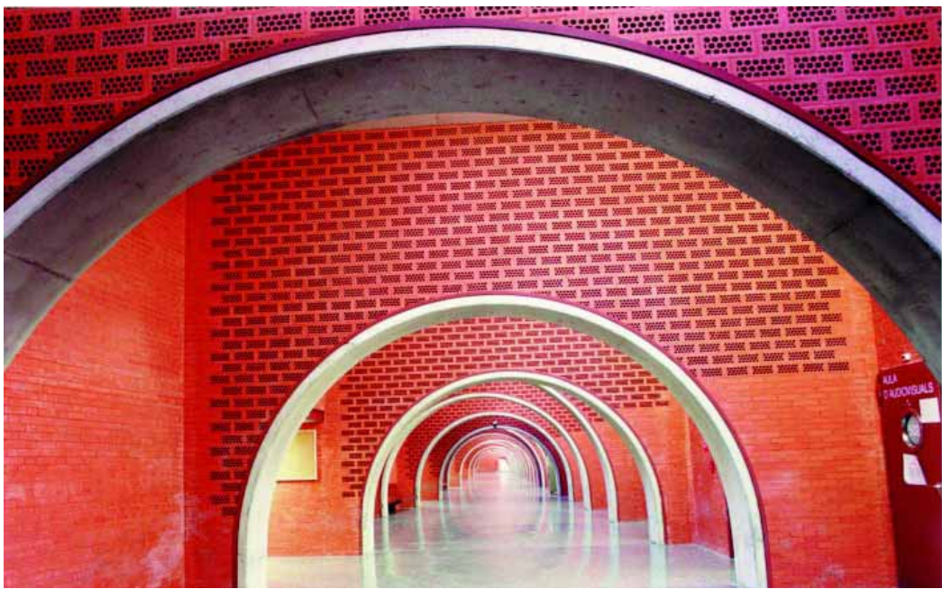
Interior d'un dels edificis del Campus dels Tarongers.

S'incrementa en un 52% el nombre de beques respecte al 1998