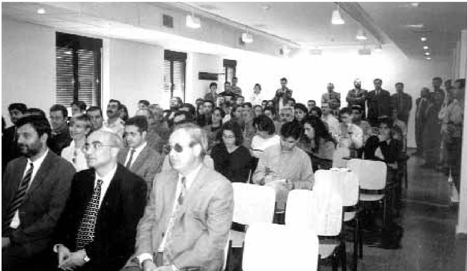
Acte de presentació de la nova extensió universitària a Ontinyent.

Els estudiants de l'extensió universitària d'Ontinyent valoren el tracte directe mig any després d'iniciar el curs