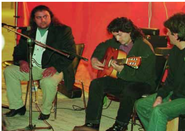
El grup de flamenc, durant la seua actuació.

gant entre bucs-aularis i ofegants entre les rajoles, dia a dia, ens hem donat de nassos contra l'infranquejable formigó. Ens despertem i cridem de ràbia i així organitzem aquestes jornades contra el monstre de l'especulació”. Així de contundents s'expressaven els membres d'Auje a l'hora de donar raons de l'organització d'aquestes jornades contra l'especulació urbanística. Sota la premissa que la desinformació i la manipulació informativa són una de les causes que afavoreixen la poca resposta social davant dels efectes devastadors de l'especulació, els membres d'Auje buscaven gent compromesa que estiguera interessada a conèixer com evitar que la ciutat es convertís en un