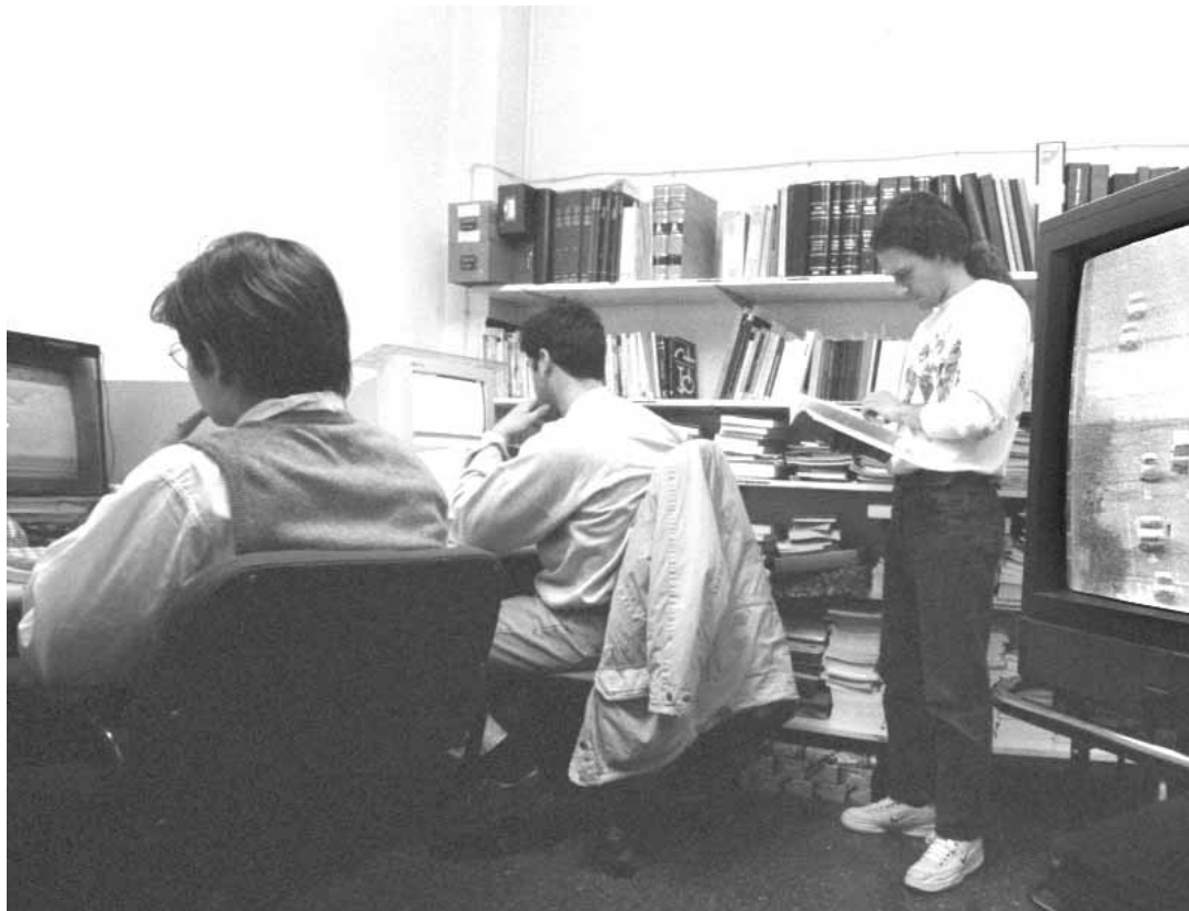
Estudiants, el Departament de Teoria de l'Educació.

Formació a empreses privades i públiques. Ensenyament. Educació ambiental. Formació de professorat. Empreses fabricants de joguets. Ludoteques. Presons. Cases d'acolliment. Tribunals de menors.