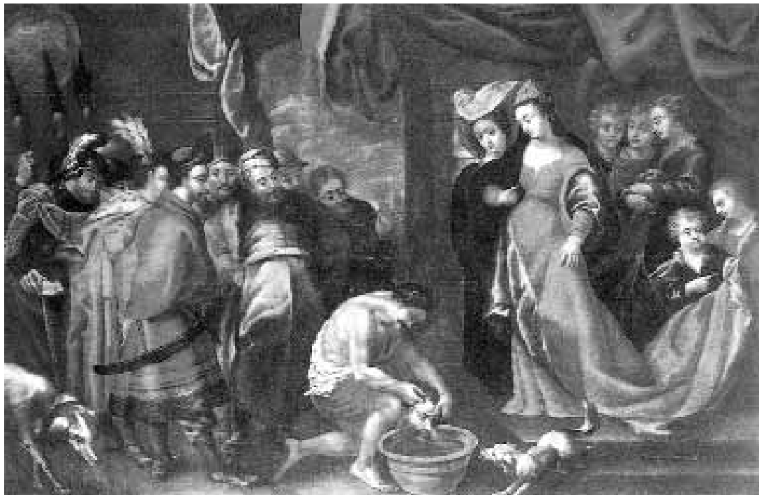
Una de les obres restaurades del projecte Thesaurus.

A més, aquesta proposta vol incentivar els esforços destinats