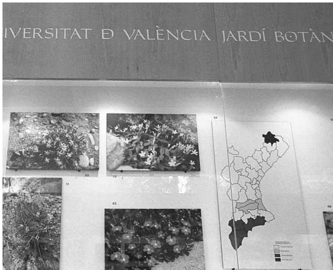
Fotografies i mapes de l'exposició sobre la flora valenciana amenaçada.

El Jardí Botànic ofereix una exposició sobre el fenomen endèmic