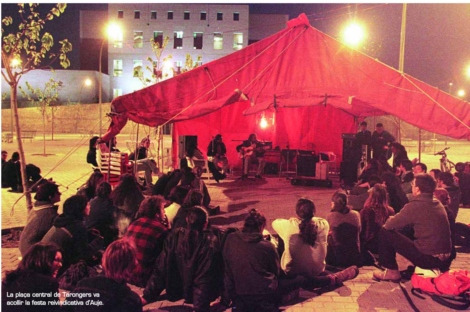
La plaça central de Tarongers va acollir la festa reivindicativa d'Auje.