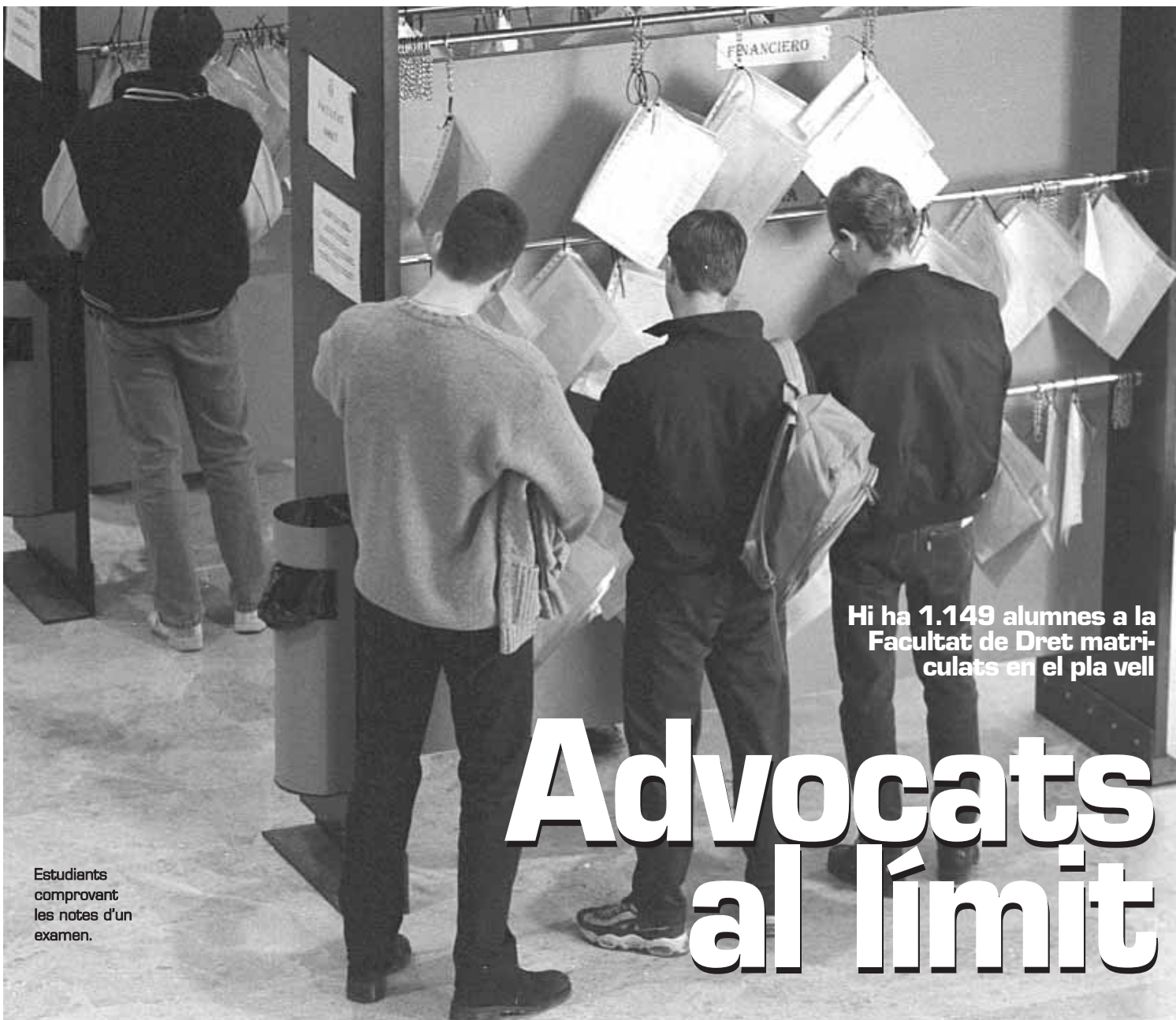
Estudiants comprovant les notes d'un examen.

Hi ha 1.149 alumnes a la Facultat de Dret matriculats en el pla vell