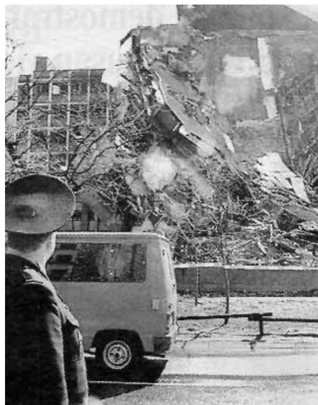
Edifici del Ministeri de l'Interior a Belgrad bombardejat per l'OTAN.

Es tracta d'una concepció tribal de la identitat que està en la base de la majoria de les matances i dels conflictes de sang que s'han produït en els darrers anys. Com es pot afrontar aquest problema? En opinió de Maalouf, és necessari i urgent elaborar una nova concepció de la identitat. Més encara en l'època de mundialització en què vivim, amb un procés accelerat d'almalgama i mescla que ens envolta a tots. La identitat de cada persona