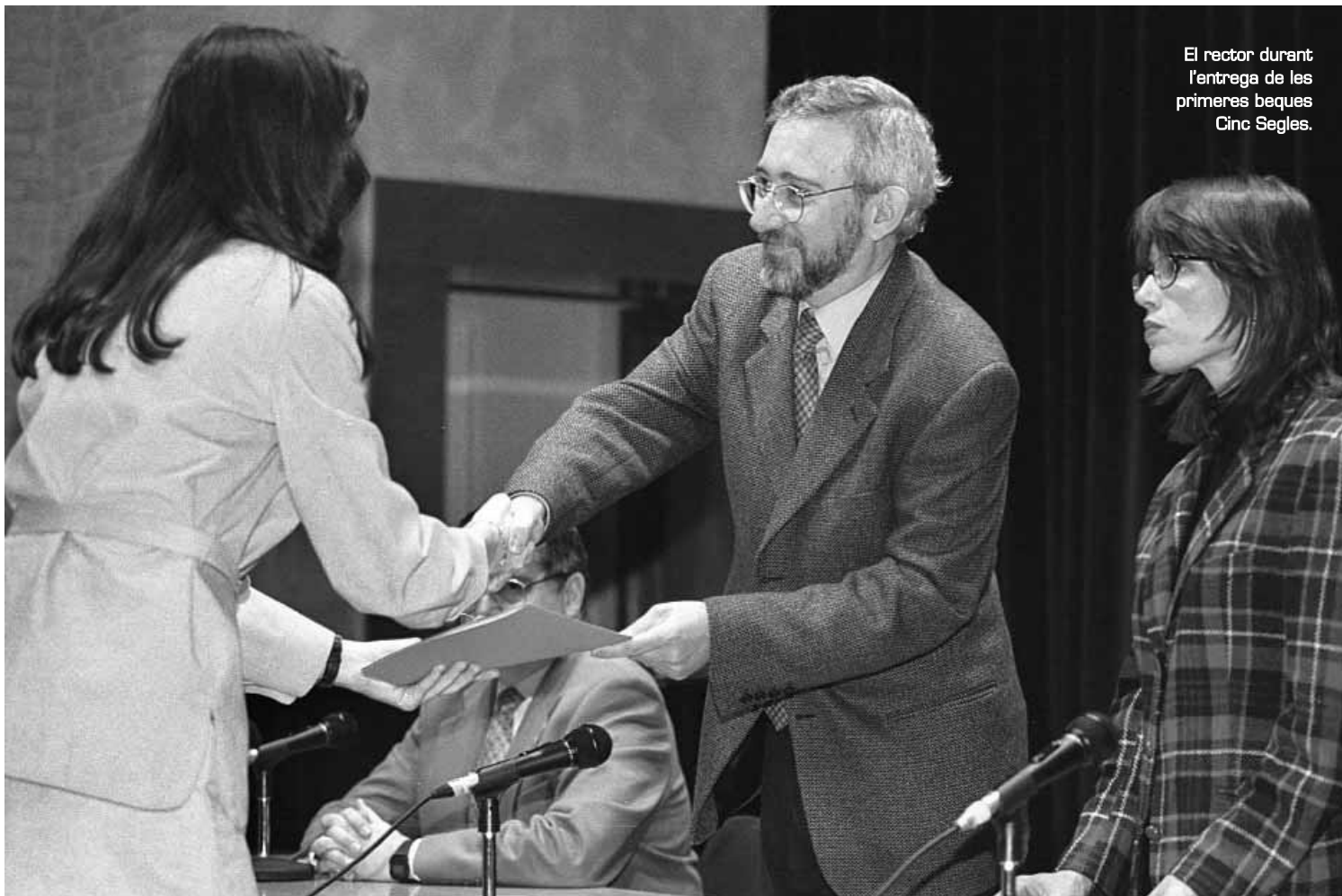
El rector durant l'entrega de les primeres beques Cinc Segles.

SABIES QUE...? Entre els mesos de juliol i agost d'enguany, una expedició de la Universitat de València emprendre l'ascensió a la muntanya Gasherbrum II (Pakistan), de 8.035 metres d'altitud. Simultàniament s'hi desplegarà un programa científic i d'investigació.