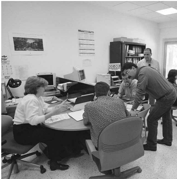
Sindicalistes reunits en un dels nous locals de la Universitat.