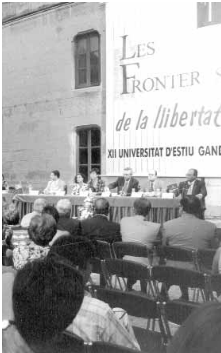
Imatge d'arxiu d'una sessió de la Universitat d'Estiu de Gandia.

La interdisciplinarietat és la característica principal d'aquests cursos, que barregen matèries de ciències socials amb altres de l'àrea de salut, educació, ciències bàsiques i humanitats: Conservar la memòria, representar la societat; La investigació científica i artística; Les passions i la justícia; Nou ordre escolar; nou quefer; De bèsties i poetes: la divulgació