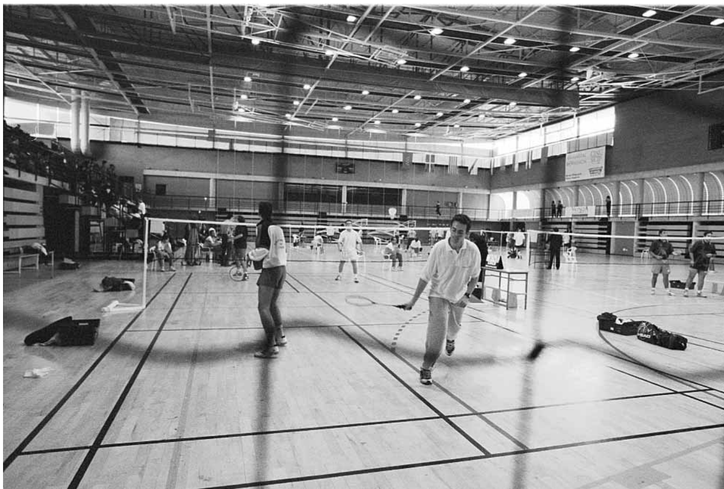
El bàdminton fou la disciplina en què la Universitat aconseguí més victòries.