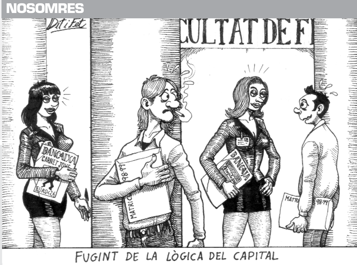
FUGINT DE LA LòGICA DEL CAPITAL

Organitza: L'Orfeo Universitari de València, en col·laboració amb el Festival d'Òpera de Requena. Duració: Dies 17, 19, 20, 21 i 23 de maig. Lloc: Dia 17: A la Sala de Junes de l'Antiga Escola d'Empresarials. C/Arts Gràfiques, 13. Rest de dies: Al Teatre Principal de Requena. Preu: Alumnes actius: 25.000 pessetes; alumnes oients: universitaris, 7.000, públic en general, 9.000. Observacions: Per als alumnes actius es requereix un grau mitjà de cant. Es farà una prova de selecció per a la qual caldrà preparar una obra de tres minuts. Caldrà dur abans la partitura i el currículum. Més informació: Al telèfon 96 398 31 96.