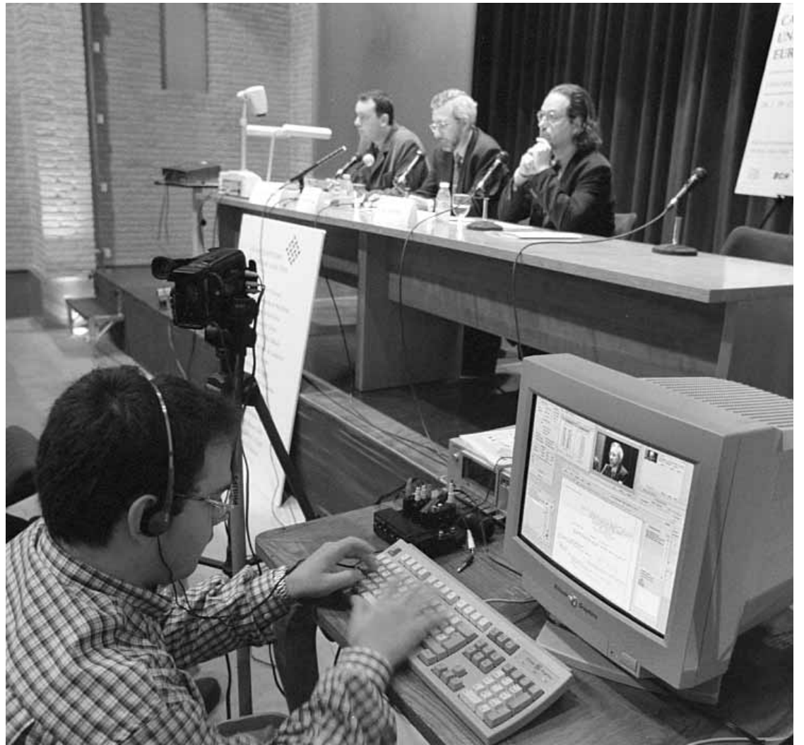
Moment de la inauguració del III Debat Universitari.

Tanmateix, aquesta tasca investigadora no està suficientment recolzada per la política científica de la Comissió Europea, tot i que la recerca naix del treball de deu mil universitats amb huit milions d'estudiants i un milió d'acadèmics. Maddox va comentar el fet que "la Unió Europea no finança de la mateixa manera la investigació aplicada a les empreses com la investigació bàsica i, amb dos bilions de dòlars de pressupost anual, la Comissió hauria de coordinar una mena de superorganització científica universitària capaç d'establir polítiques reals d'ava-