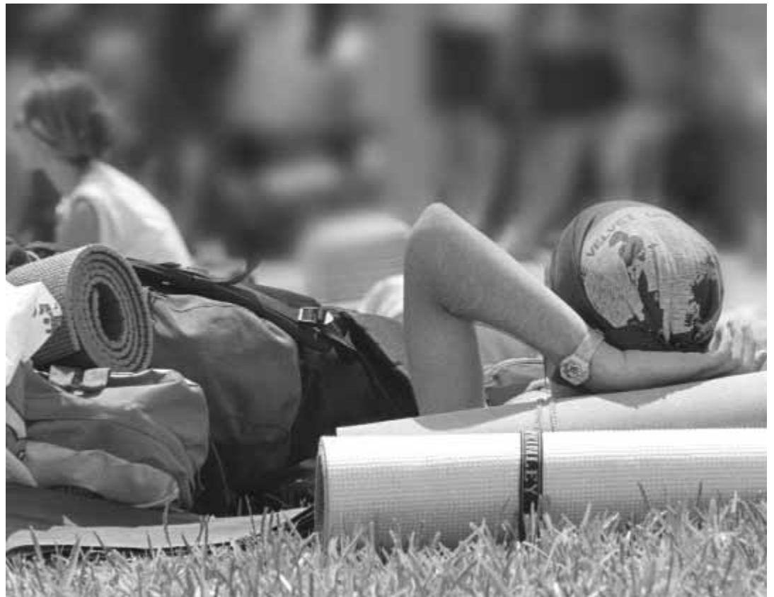
Una estudianta preparada per a iniciar un viatge.

la resta de la comissió de viatge d'Història prepararen la Festa de la Mistela , amb un grup musical format per estudiants de la Uni-