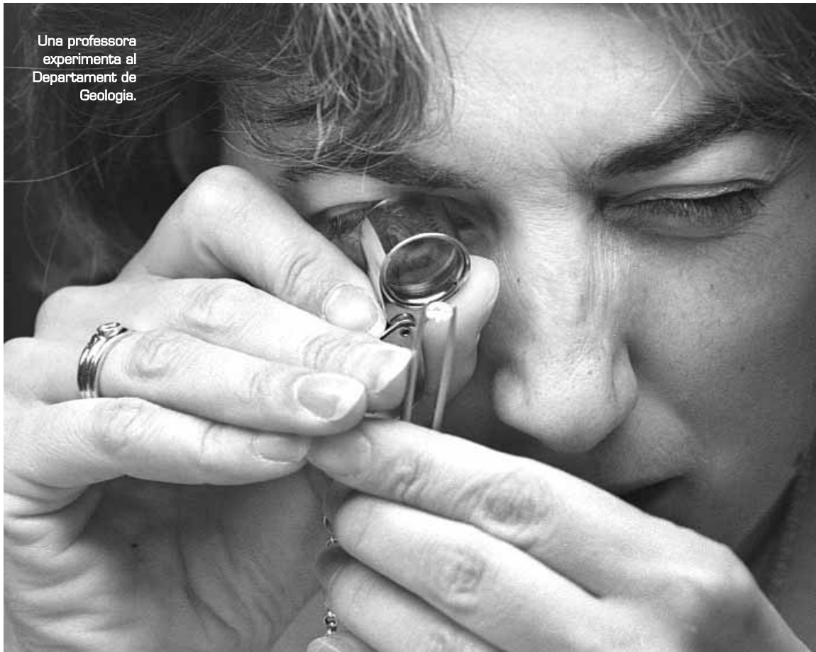
Una professora experimenta al Departament de Geologia.

Com a ciència que estudia l'origen, composició, estructura i evolució de la Terra, la Geologia ens revela els secrets més amagats del nostre planeta i tot allò que ha pogut conduir-lo al seu estat actual. Al Departament de Geologia de la Universitat es desenvolupen diversos projectes de recerca adreçats a aprofundir encara més aquests coneixements aplicables en diversos camps, com ara la tecnologia de materials, la cartografia, la indústria petroquímica i ceràmica i el sector de la construcció, entre altres.