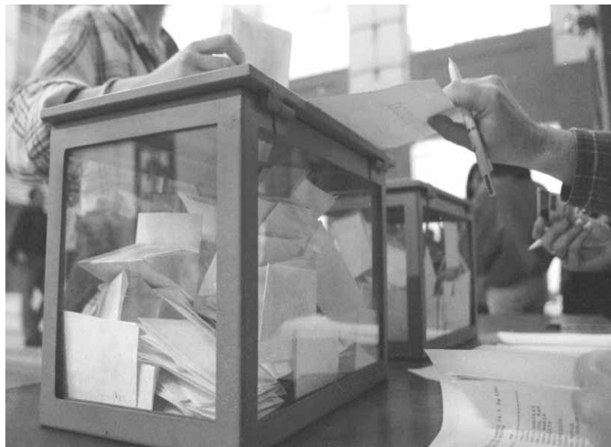
Una urna d'uns anteriors comicis.

Només Tàrsilo Piles es va referir a la demanda dels estudiants del transport gratuït. "Ningú no ha estat capaç de firmar un programa de subvencions que permeta el transport gratuït per als estudiants com passa en altres ciutats espanyoles. El 28 de juny del 1998 jo vaig presentar una moció i el PP la va votar en contra", va dir el candidat d'Unio Valenciana en una clara interpel·lació al representant del Partit Popular present en la taula,