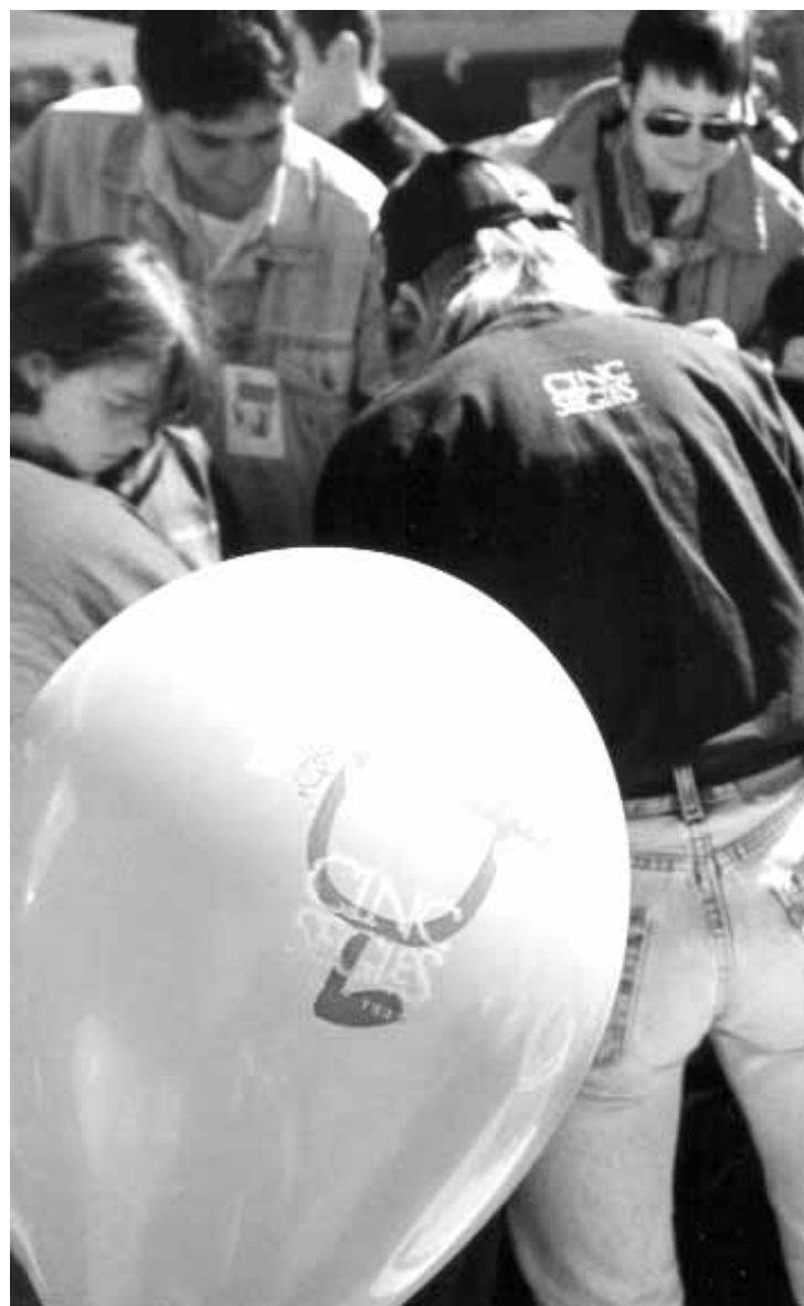
Participants en les trobades de les escoles en valencià.