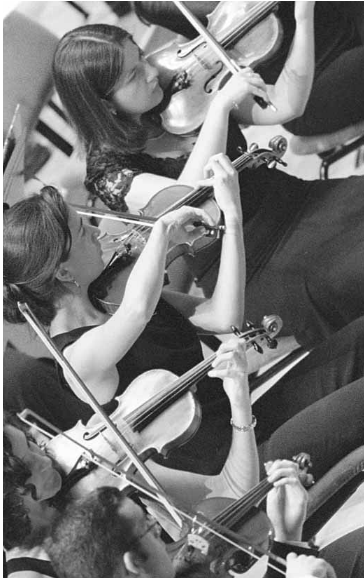
Violins de l'Orquestra durant el concert en memòria de Menuhin.

L'agrupació també ha actuat a tot arreu del País Valencià en