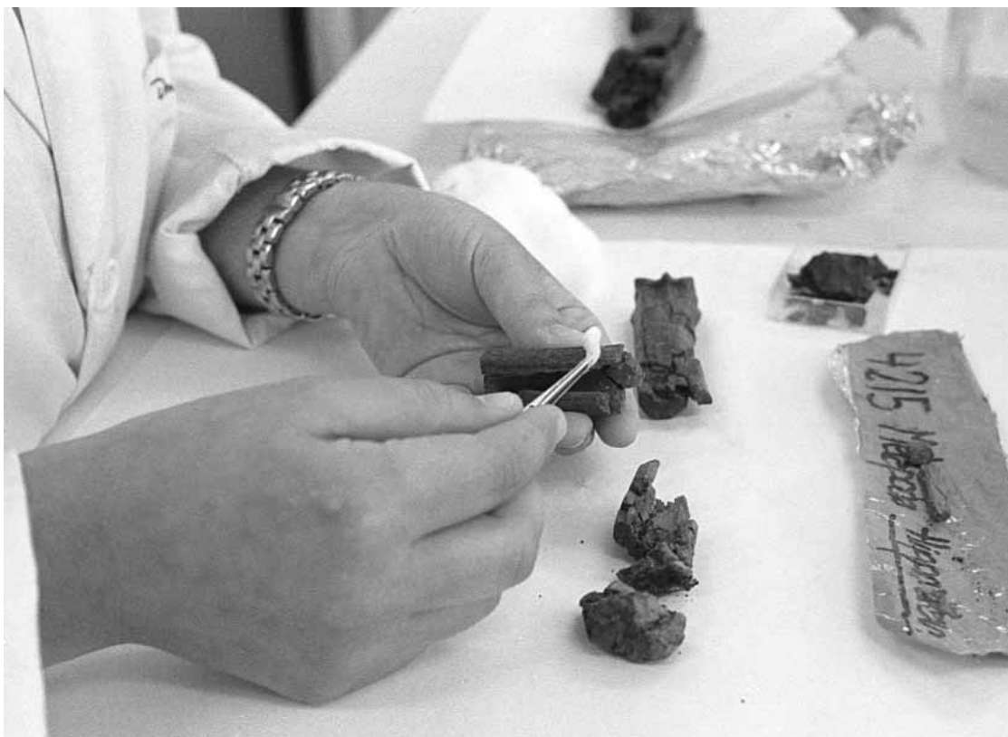
Un investigador analitza ossos al Departament de Paleontologia.

L'últim període del Mesozoic és el Cretaci. A València, el Cretaci continental està força representat i es coneixen els seus dinosaures: els hadrosaures (ornitopodes) de talla mitjana (uns deu metres de llarg), de la zona de Tous, i els sauropodes de Xera. El descobriment, a Àlaba, d'ambre cretaci amb una rica fauna d'insectes ha fet que tot un equip d'especialistes, entre els quals hi ha un membre del Departament de Geologia, s'haja abocat al seu estudi. Ací es troben els primers avantpassats de grups d'insectes prou comuns