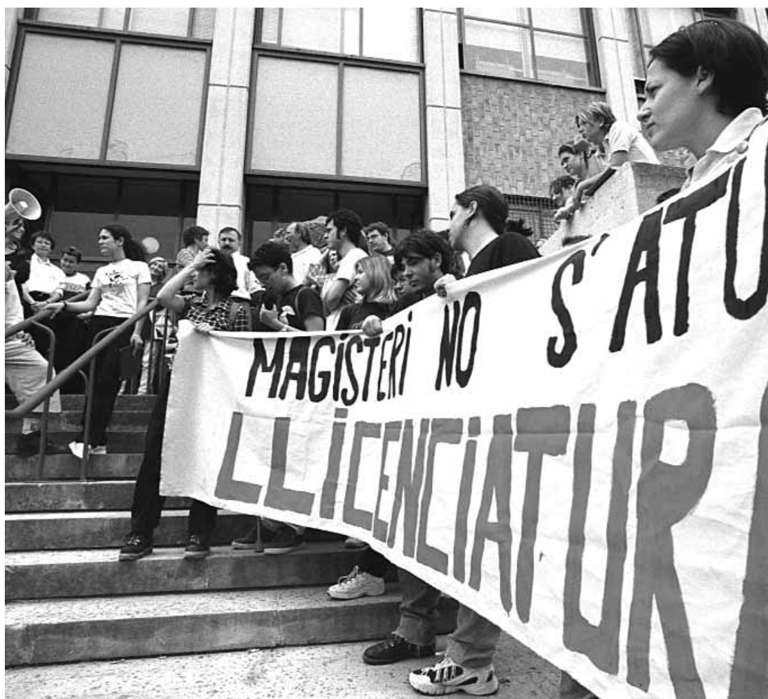
Concentració d'estudiants de Magisteri reclamant la Facultat.

Els estudiants de Magisteri de tot l'Estat s'apleguen en la plataforma SEREM (Sectorial Estatal de Representants d'Estudiants de Magisteri).