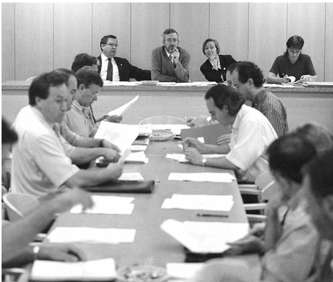
Un moment de la Junta de Govern de la Universitat celebrada durant aquesta setmana.

La Universitat de València imparteix un total de 51 titulacions. De les quals, 14 ja han iniciat la reforma de la reforma. A més, Farmàcia i Medicina ja publicaren els seus plans reformats en el BOE durant el 1998 i algunes titulacions noves ja s'imparteixen d'acord amb la normativa del Reial Decret del