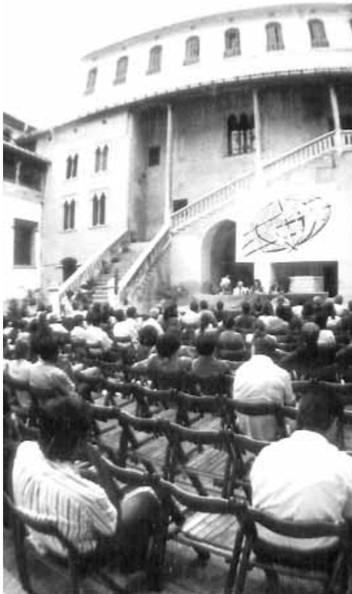
Una sessió de la Universitat d'Estiu en una edició anterior.