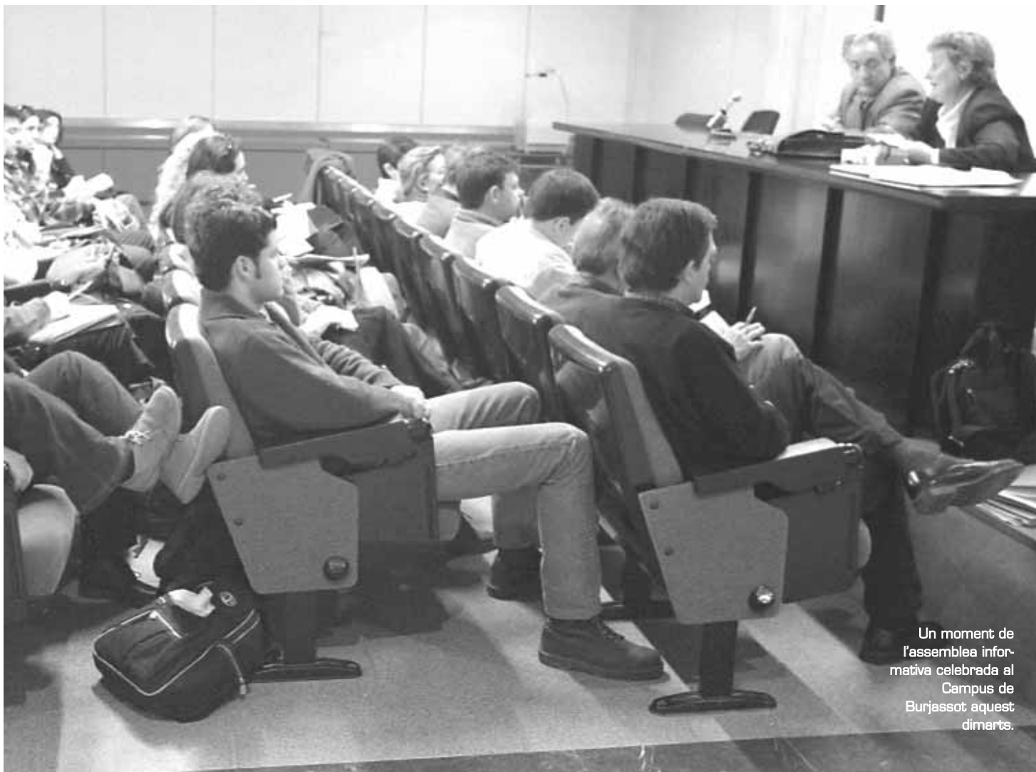
Un moment de l'assemblea informativa celebrada al Campus de Burjassot aquest dimarts.

Els alumnes s'interessen per les universitats nord-americanes, espanyoles i de parla catalana