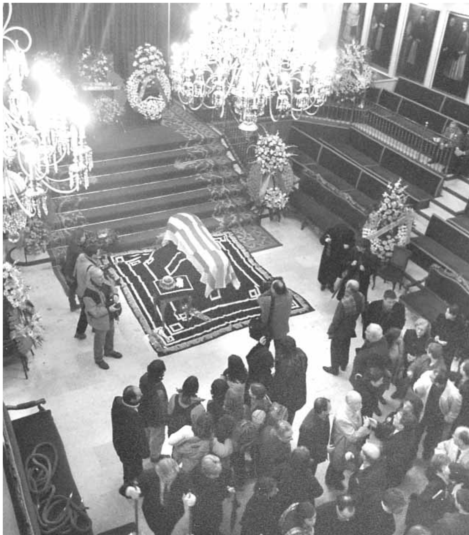
Capella ardent d'Enric Valor, instal·lada al Paranimf de la Universitat.