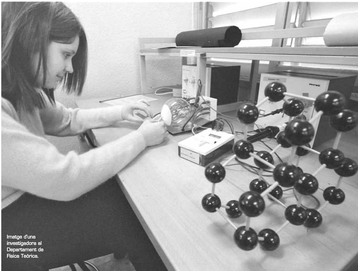
Imatge d'una investigadora al Departament de Física Teòrica.