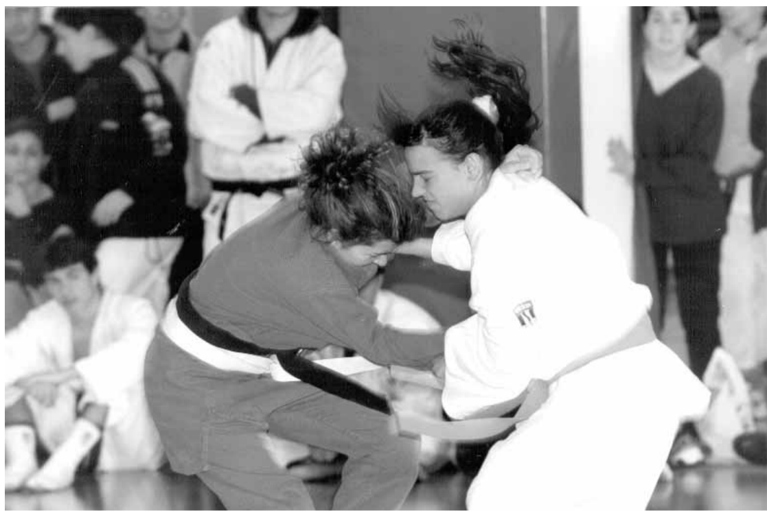
Dues practicants de judo en un campionat.

Unes instal·lacions de qualitat faciliten les competicions