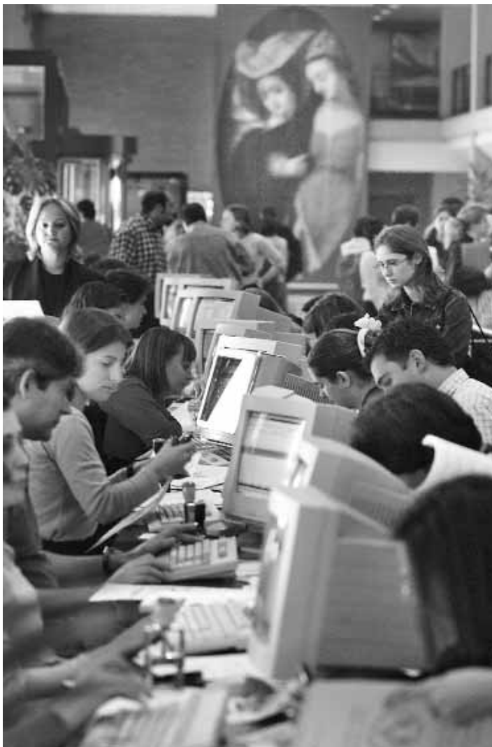
Estudiants de la Universitat de València en el moment de la matrícula.

Tornant al cas de Catalunya, s'ha de dir que aquests cursos són voluntaris i estan previstos per als alumnes que vénen de l'ensenyament secundari, tot recomanant-se si la nota d'accés a la Universitat és de menys d'un punt sobre la nota de tall, o si l'alumne creu que no domina suficientment alguna de