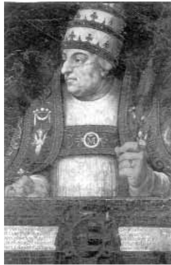
Alexandre VI, papa Borja.