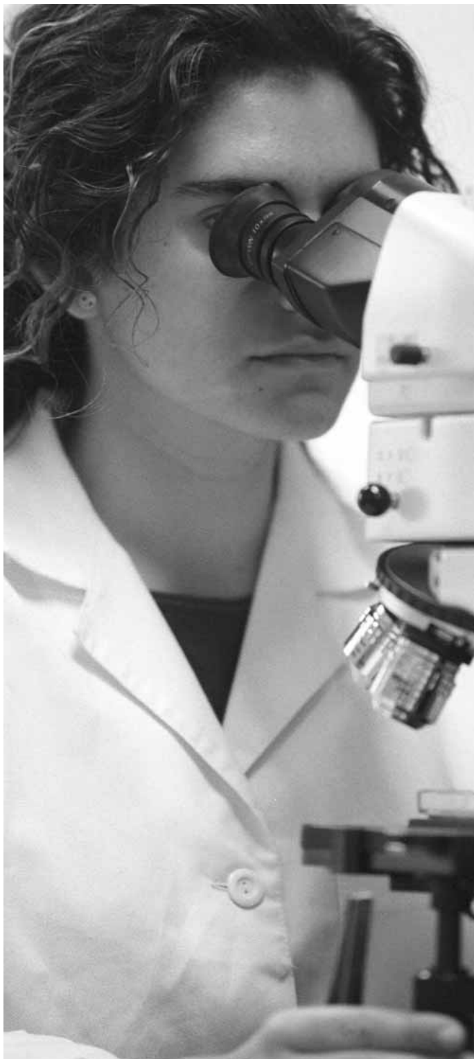
Una investigadora en un centre de la Universitat.

Així les coses, la incertesa professional és l'única cosa clara que, hui en dia, tenen els joves investigadors. Un nou viratge a la situació podria ser un canvi en la Llei de la Reforma Universitària. Per a