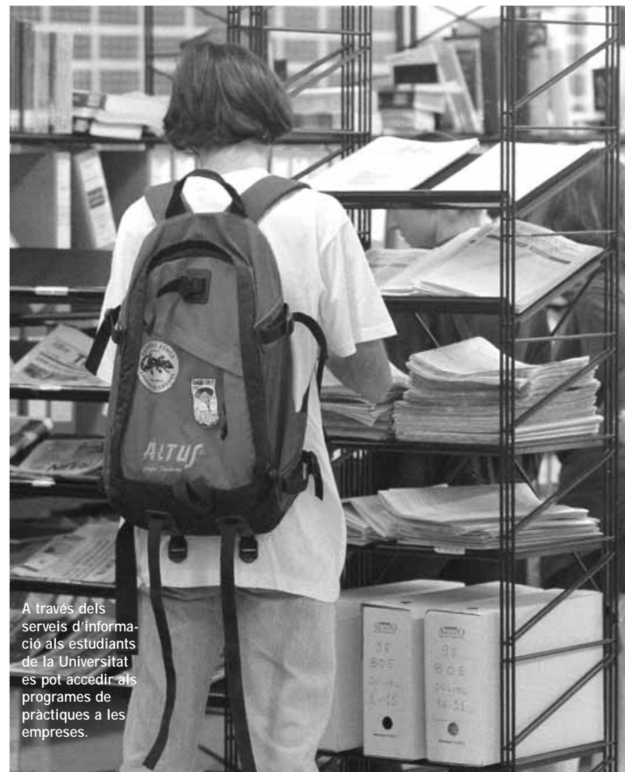
A través dels serveis d'informació als estudiants de la Universitat es pot accedir als programes de pràctiques a les empreses.