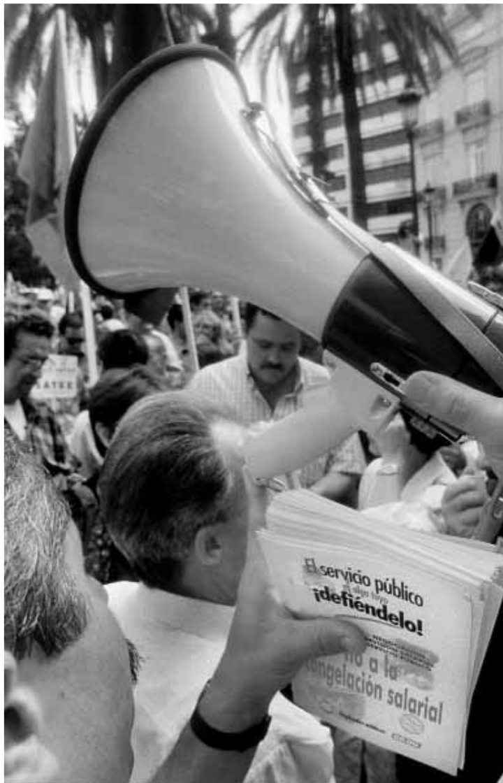
Imatge d'arxiu d'una manifestació contra la congelació salarial.

El secretari per a la negociació ha anunciat que la primera mesura que es prendrà és demanar adhesions a través del