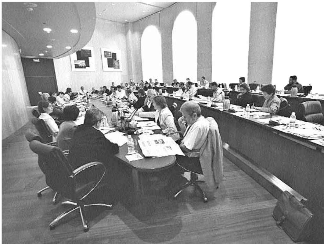
Imatge de la reunió celebrada dimarts passat.

D'altra banda, el rector va comunicar al Consell de Govern