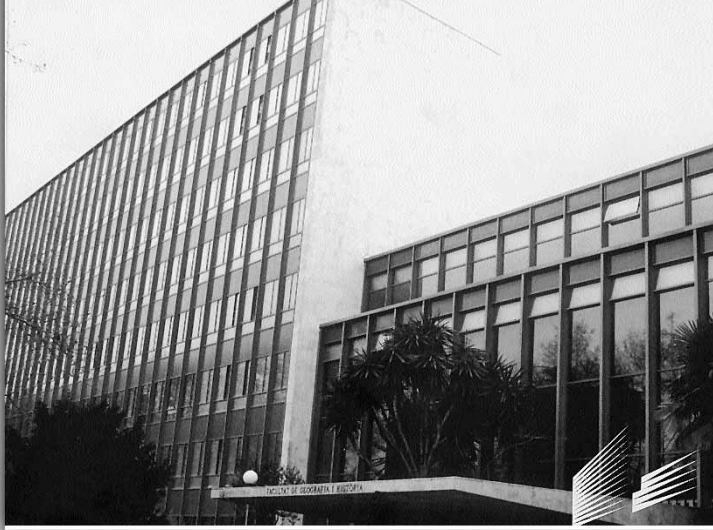
Portada del catàleg.

estudiat els integrants d'aquest projecte. L'interés de fer una mirada retrospectiva sobre la Universitat de València dels darrers vint anys queda reflectit en les fotografies que han recuperat del passat.