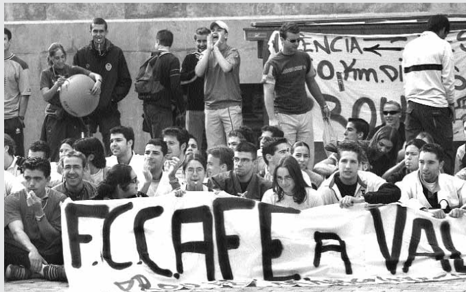
Imatge de la protesta dels estudiants.

El Consell de Govern va convidar un representant dels estudiants de la Facultat de Ciències de l'Activitat Física i l'Esport (FCAFE) perquè informe sobre la situació d'aquest centre, situat a Xest, el trasllat del qual a un dels campus universitaris és objecte de reivindicacions dels alumnes. El representant estudiantil va exposar els problemes que suposa desplaçar-se a un centre situat a trenta quilòmetres de la ciutat, els quaranta anys d'antiguitat de les instal·lacions del que va ser creat com a uni-