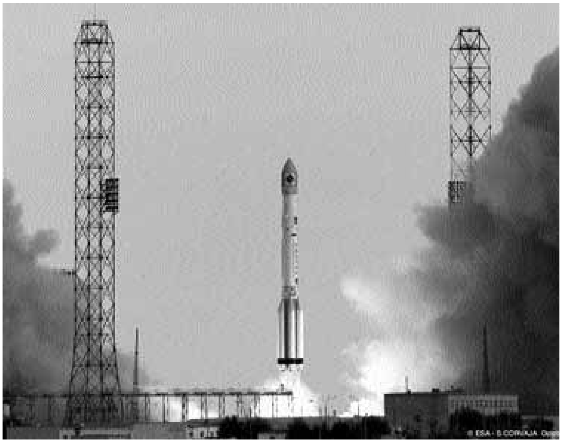
Imatge del llançament del coet que portava el satèl·lit Integral el dia 17 d'octubre.

Encara que les dades per a l'estudi científic no començaran a