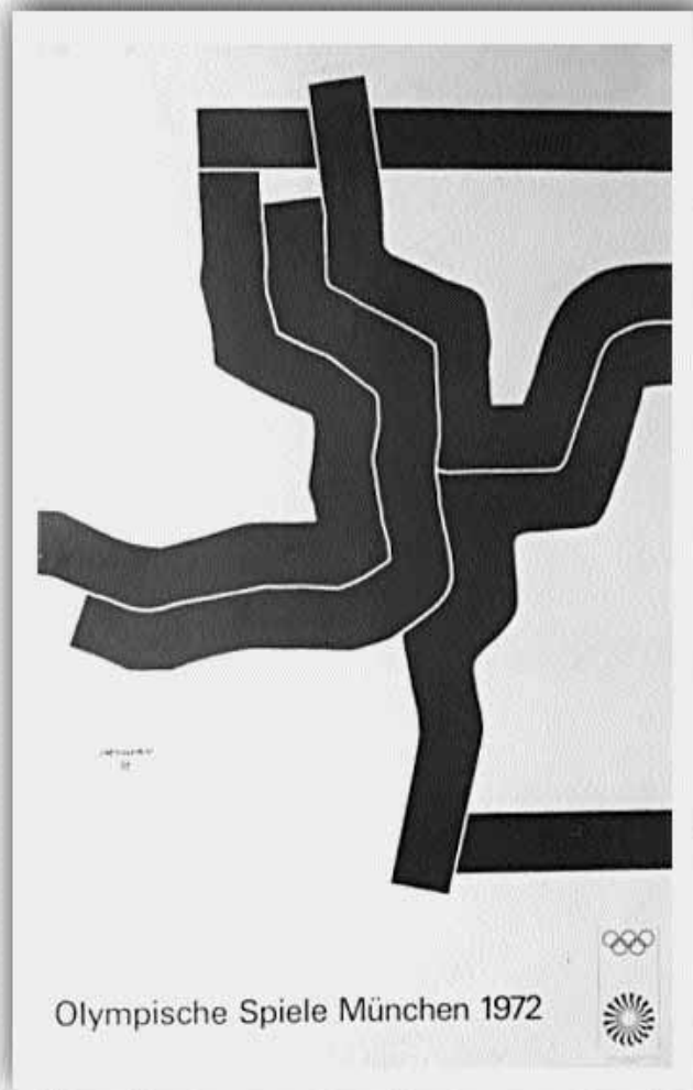
Cartell d'Eduardo Chillida per als Jocs Olímpics de 1972.

Els Jocs Olímpics, que van ser reinstaurats a la ciutat d'Atenes el 1896, van nàixer amb la intenció de recuperar la filosofia de l'olimpisme del món clàssic grec. Les Olimpíades s'han convertit en un fenomen universal l'impacte econòmic, social i esportiu