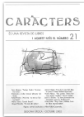
Nova portada de Caràcters .