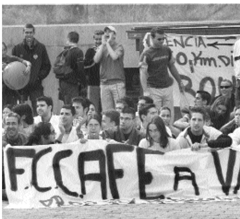
Estudiants d'Educació Física en una manifestació recent.

Dimarts passat, els estudiants d'Educació Física van fer una aturada de deu minuts en el mateix centre. Professors, alumnes i personal d'administració i serveis es van reunir al Saló d'Actes per tal conèixer la situació en què es troben les negociacions amb l'equip rectoral. També s'hi va llegir un manifest en el qual es demanava el trasllat a València per al pròxim any. Els representants d'estudiants van explicar que l'equip rectoral s'ha compromès a mantindre reunions mensuals amb els membres del centre per tal de