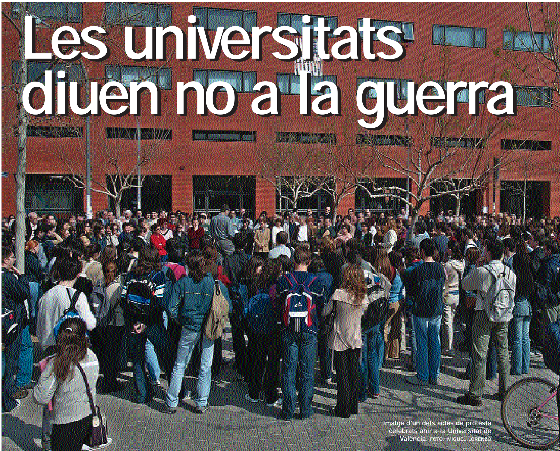
Imatge d'un dels actes de protesta celebrats ahir a la Universitat de València.

Centenars de persones (professors, estudiants i personal d'administració i serveis) se concentraren a migdia d'ahir, dimecres, a les portes de tots els centres i serveis de la Universitat de València per a expressar el rebuig a la guerra. La mateixa iniciativa es va repetir en totes les universitats espanyoles. El rector va llegir el manifest pacifista aprovat pel Claustre.