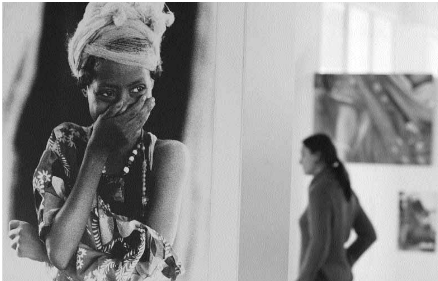
Imatge d'una de les fotografies de l'exposició del Jardí Botànic.