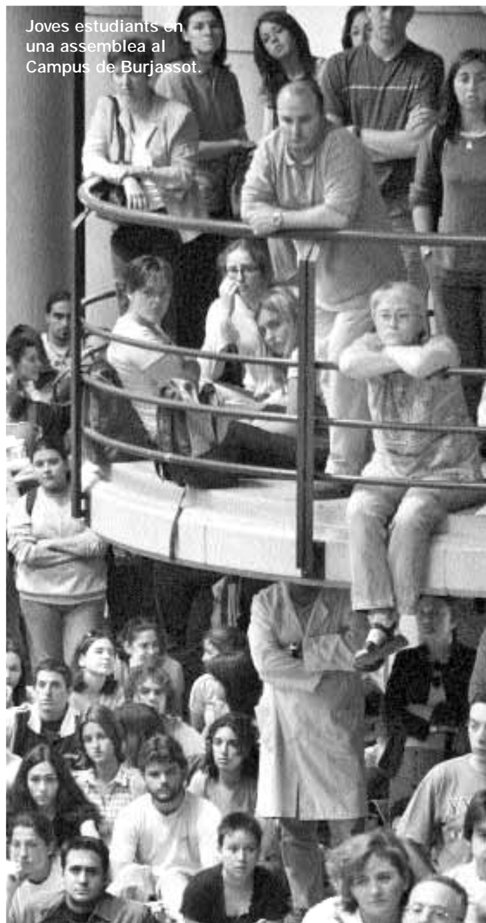
Joves estudiants en una assemblea al Campus de Burjassot.

Aquesta interrelació entre el Consell de Cent Joves i l'ajuntament ha donat lloc a programes concrets, com ara una extensa oferta lúdica i cultural per a gaudir de la nit al llarg de tot l'any anomenada Barcelona Bonanit , en la qual s'inclouen concerts, esports, cinema, exposicions, teatre i, fins i tot, sales d'estudi a biblioteques en horari nocturn. I per tal de fer de veritat accessibles totes aquestes activitats, l'Entitat Metropolitana de Transports no va dubtar en crear una nova línia d'autobús nocturn, redissenyar les parades d'altres