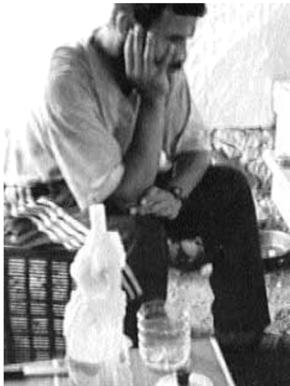
Un fotograma del documental sobre El Ejido.

Per a la realització d'aquest documental, un reporter marroquí conviu amb els seus compatriotes amb la intenció de retratar fidelment la relació entre el marroquí i l'agricultor, una relació que va esclatar amb violència ara fa tres anys i que es manifesta en aquest