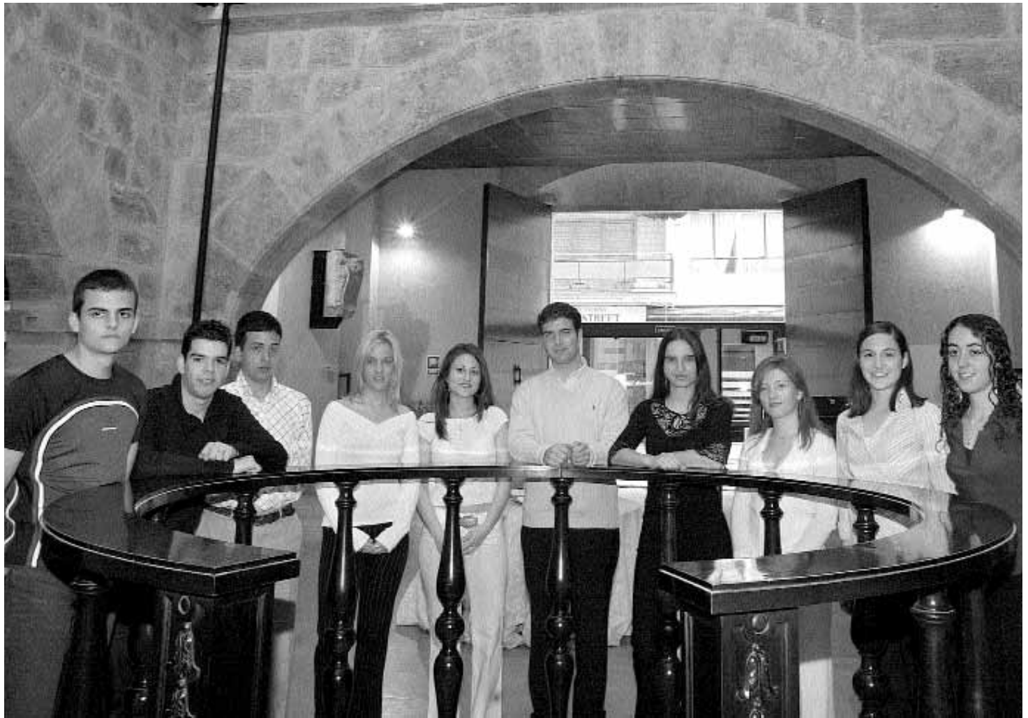
Estudiants premiats pels millors resultats en la Primera Olimpíada d'Economia celebrada a la Universitat.