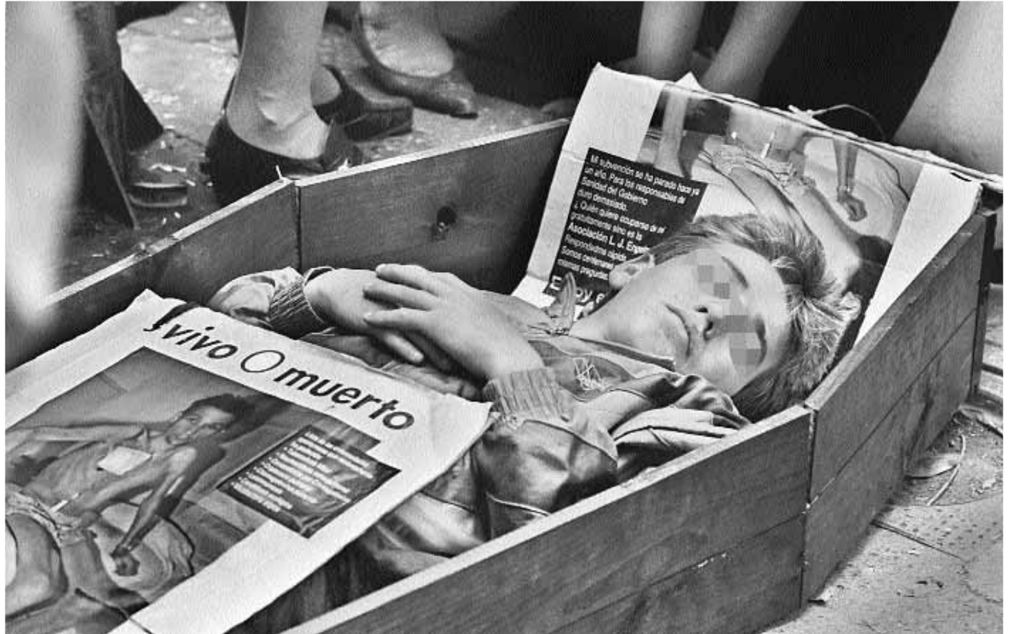
Un acte de conscienciació sobre la malaltia de la sida, en una imatge d'arxiu.

Amb tot, a pesar de les xifres que mostren una realitat tan crua, sobretot a l'Europa occidental s'ha assentat la idea entre els joves (tant homosexuals com heterosexuals) que el VIH és una epidèmia d'una altra època, d'uns altres continents... Que ja no mata, que es pot viure tranquil·lament amb la sida. Amb aquestes fal·làcies es justifica la