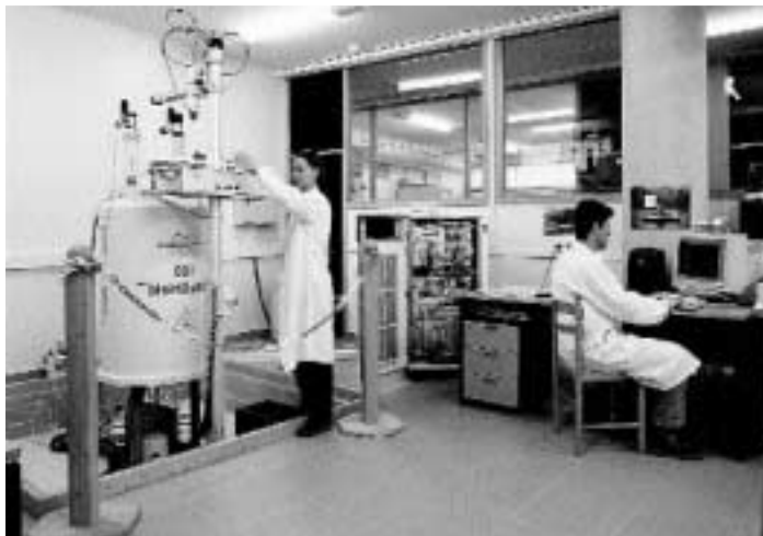
Secció de Ressonància Magnètica del Servei de Suport a la Investigació.

Pel que fa al primer factor, la Universitat destaca especialment per tindre el nivell més alt d'Espanya en publicacions sobre Agricultura i Aliments. La quantitat de publicacions en Química i en Física i Astronomia és una altra dada important que l'informe subratlla quan es refereix a aquesta institució. Respecte al nombre de citacions, és a dir l'impacte de la recerca, l'Astro-