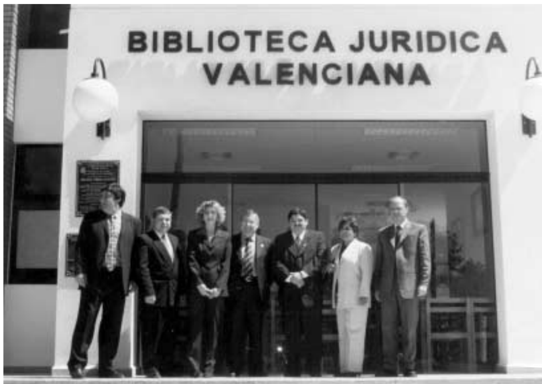
El rector, en el centre, a la porta de la biblioteca inaugurada a Bolívia.