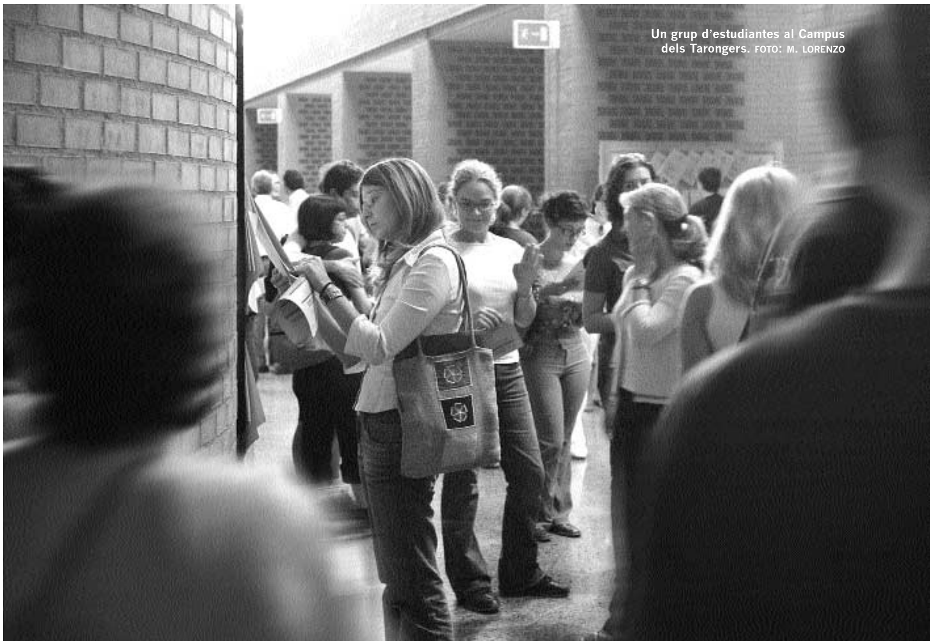
Un grup d'estudiantes al Campus dels Tarongers.