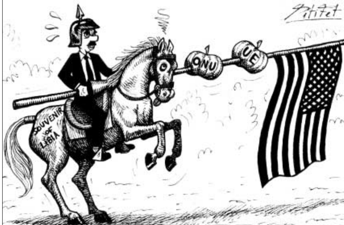
EL PRESIDENT SORPRÉS JUGANT AL PATI DE LA MONCLOA