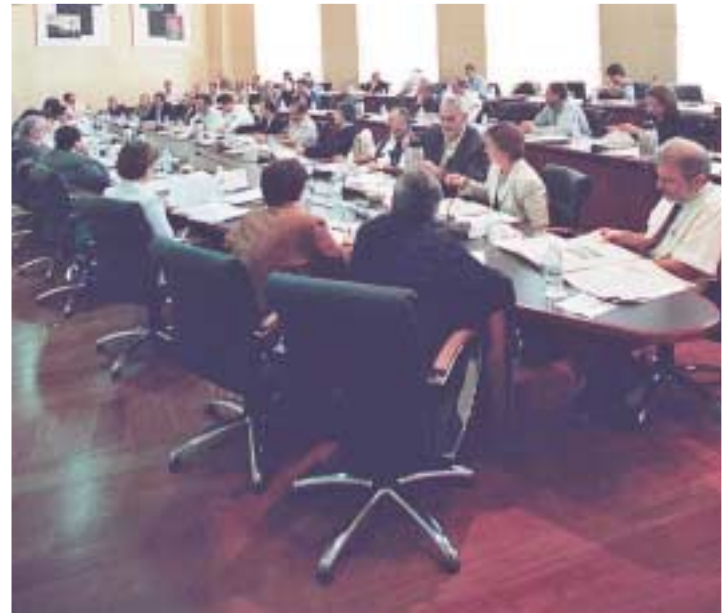
Una imatge d'arxiu d'un Consell de Govern.

També van ser aprovats en el Consell de Govern els preus públics dels col·legis majors Rector Peset i Lluís Vives, així com l'autorització per a la signatura de diversos convenis.