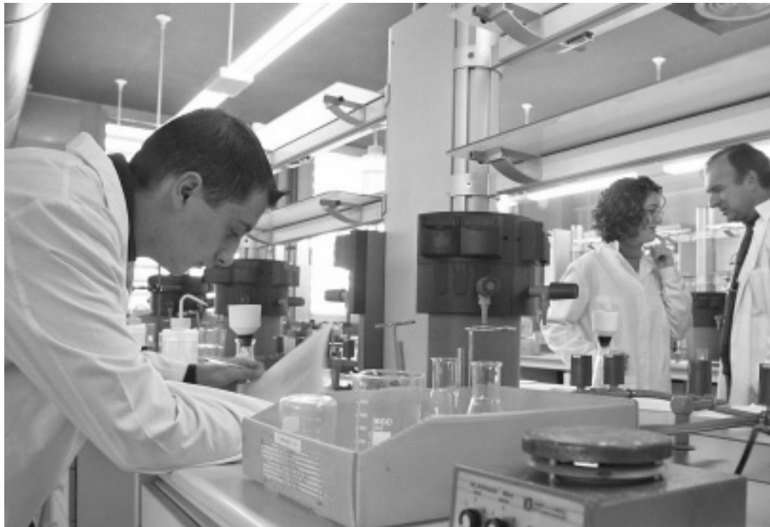
Una imatge d'arxiu d'un laboratori de la Universitat de València.