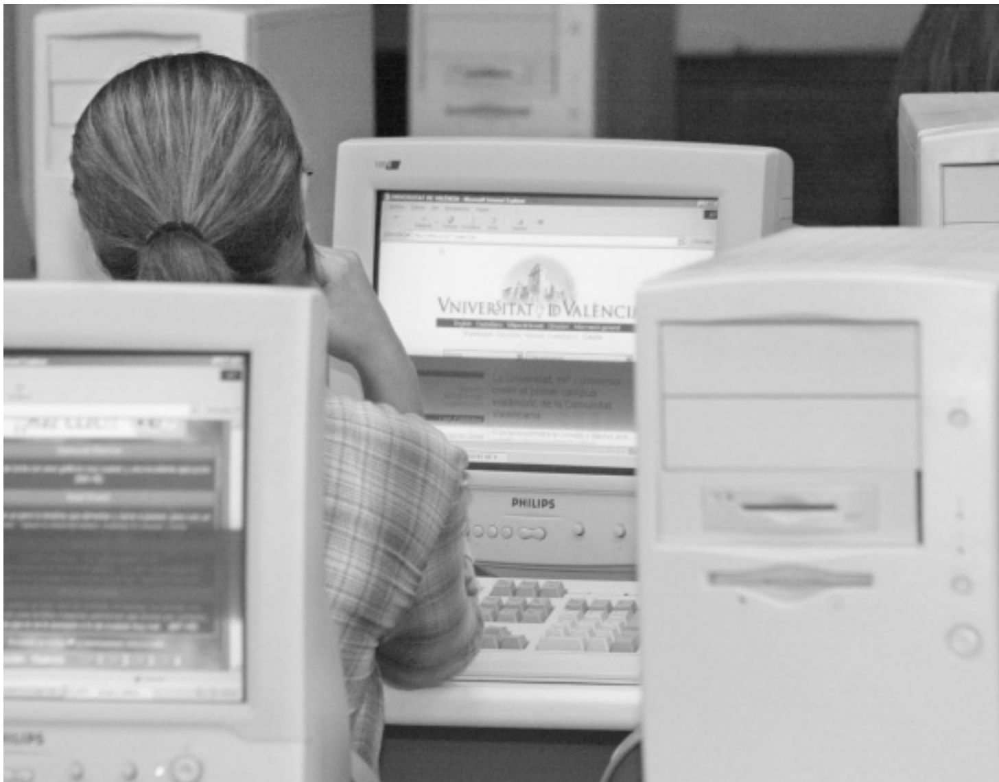
Una estudianta, en una aula d'informàtica de la Universitat de València.