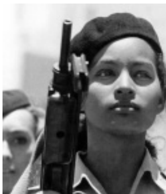
Fotografia d'Alberto Díaz (Korda)

Els anys de Sierra Maestra i de la Revolució van extreure el valor documental de la fotografia i van assenyalar la consolidació del fotoperiodisme a Cuba. Moltes d'aquestes imatges –en les quals és