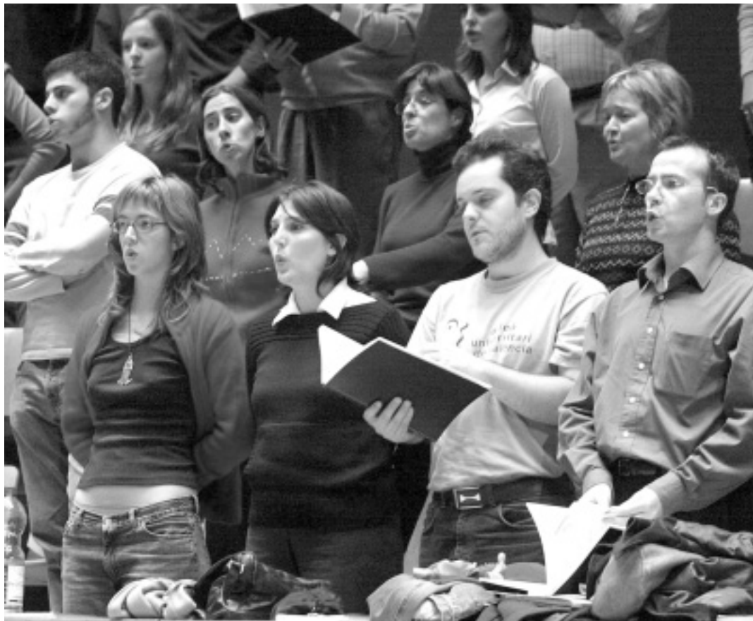
Un assaig de 'Le Revenant' el passat dimarts.