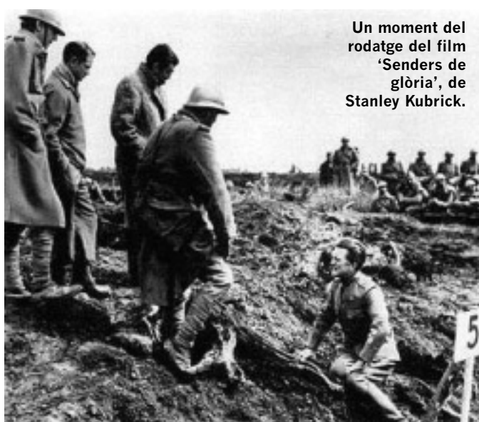
Un moment del rodatge del film 'Senders de gloria', de Stanley Kubrick.

En totes les sessions es farà primer una xicoteta presentació i després de la pel·lícula hi haurà un debat entre els assistents. Els organitzadors han destacat que volen que aquest cicle els recorde,