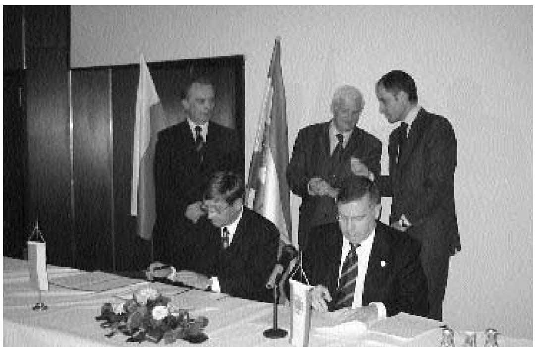
Moment de la signatura del conveni marc de col·laboració entre la Universitat de València i la Universitat de Gdansk.

La delegació valenciana va visitar l'Institut d'Estudis Ibèrics