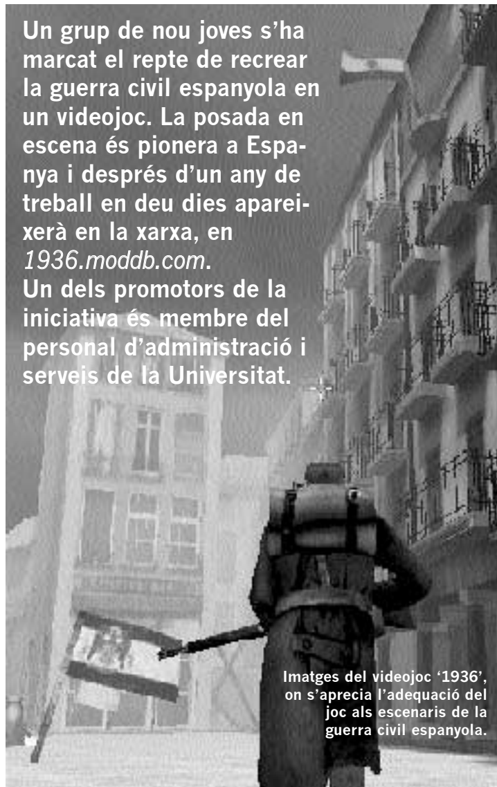
Imatges del videojoc '1936', on s'aprecia l'adequació del joc als escenaris de la guerra civil espanyola.

Un grup de nou joves s'ha marcat el repte de recrear la guerra civil espanyola en un videojoc. La posada en escena és pionera a Espanya i després d'un any de treball en deu dies apareixerà en la xarxa, en 1936.moddb.com . Un dels promotors de la iniciativa és membre del personal d'administració i serveis de la Universitat.