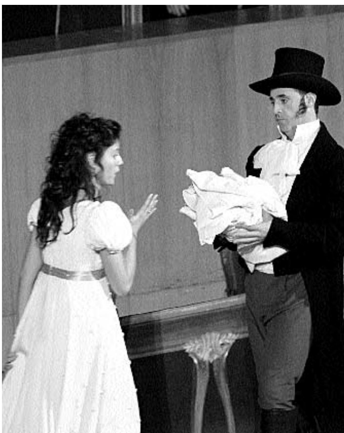
Diversos moments de la representació de 'Le Revenant' al Palau de la Música.

de València continua recolzant la difusió de la cultura musical pròpia.