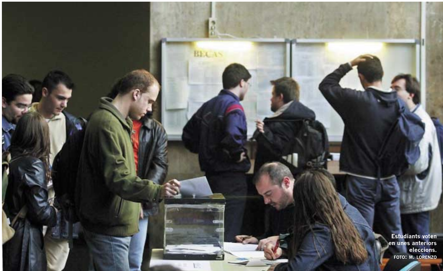
Estudiants voten en unes anteriors eleccions.