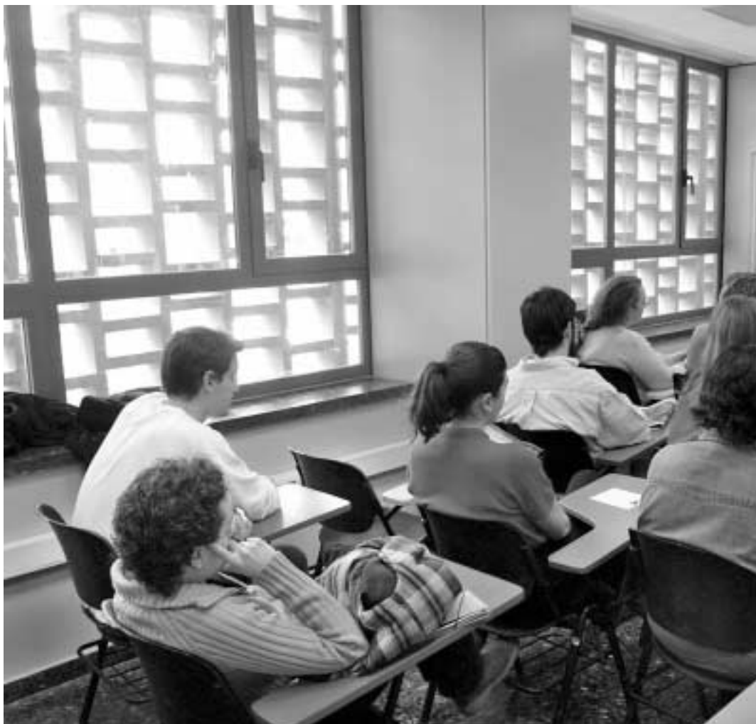
Imatge d'arxiu d'estudiants de la Universitat de València.