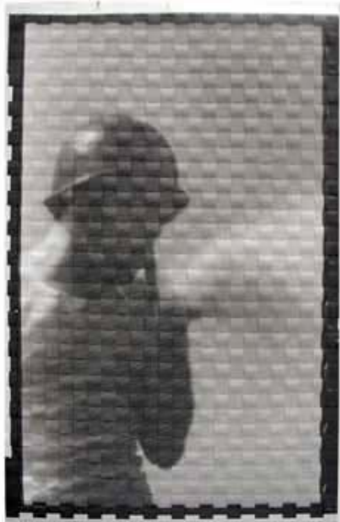
Una de les obres exposades en la mostra.

La Biennal, sensible des dels seus orígens, el 1990, a l'art social i compromés, no ha volgut eludir un fenomen tan polièdric i candent en l'actualitat com el de la violència. L'enfocament crític característic de les biennals va en paral·lel al criteri que ha seguit Jesús Martínez Guerricabeitia a l'hora de confeccionar la col·lecció d'art contemporani que el 1999 va donar a la Universitat de