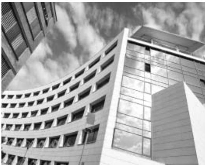
Edifici Jeroni Muñoz de la Universitat on es troba el SCSIE.

Si bé l'aïllament del gen s'ha dut a terme a la Universitat de Heidelberg, els responsables del treball han acudit a la Universitat per a realitzar les anàlisis sobre el funcionament del gen. Així,