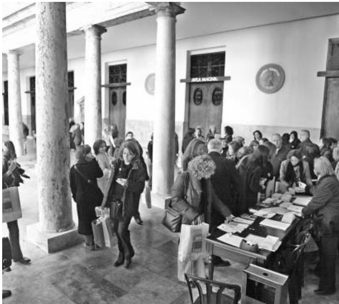
Un moment de la jornada d'orientació celebrada ahir.