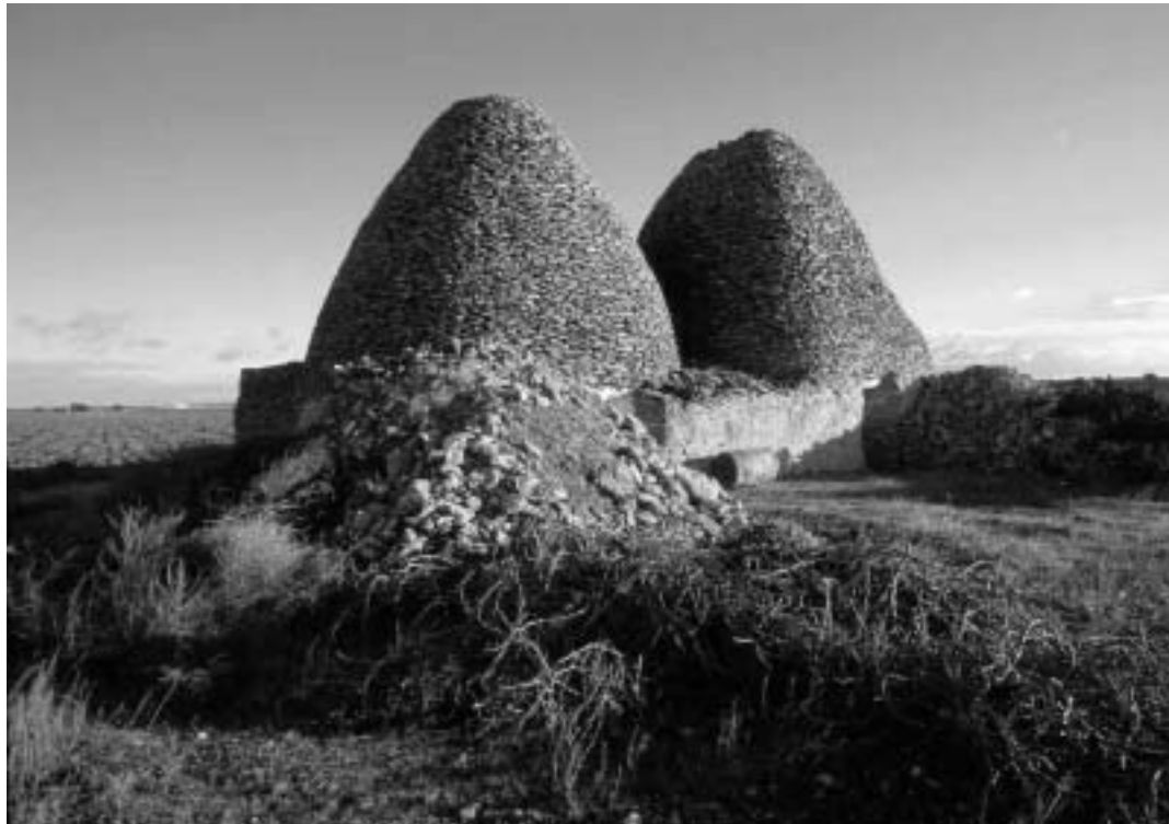
Una de les fotografies de Francesc Jarque de la mostra de la Nau.

que uneix arqueologia i arquitectura. El fotògraf, que va reconèixer sentir-se "fascinat" pel "gran micromón de la construcció de pedra", va demanar que les administracions públiques han de tindre una posició clara davant d'aquesta herència moltes vegades considerada de segona fila i han de crear un organisme per a conservar-la. "La política acapara art i cultura", tot i que, "dissortadament, sembla més rendible per al protagonisme dels polítics la posada en escena d'esdeveniments