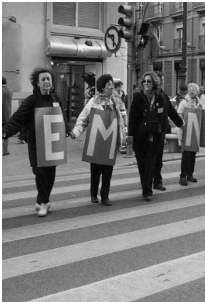
Imatge de la manifestació del Dia de la Dona a València.