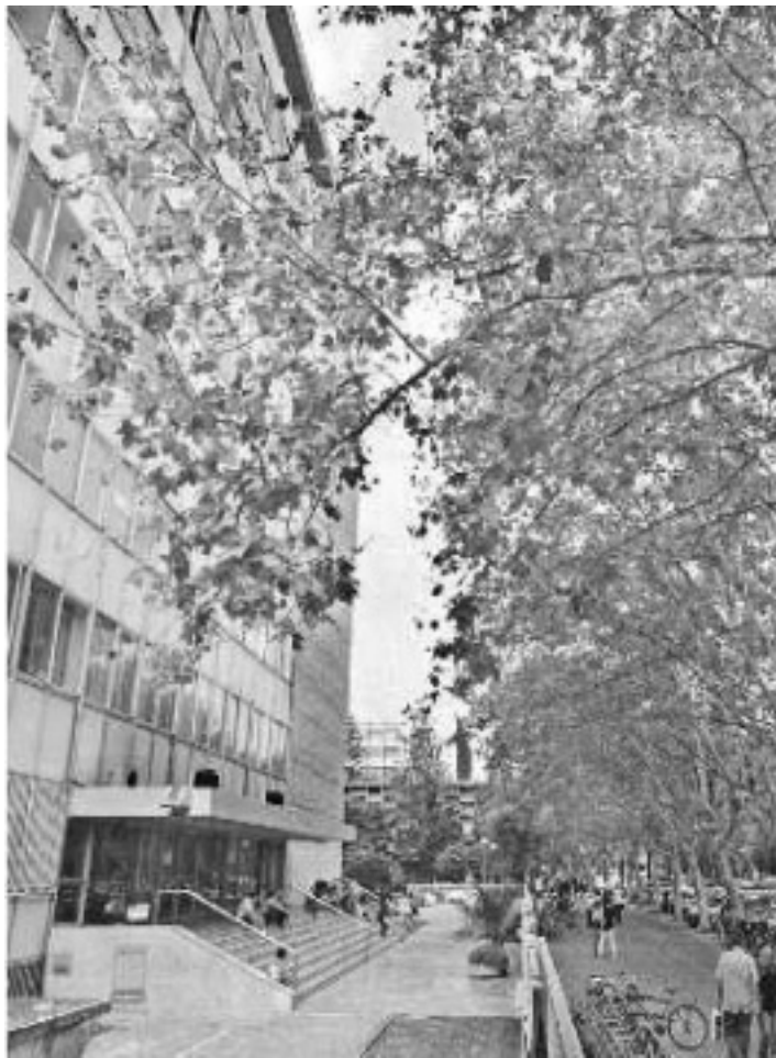
Façana de la Facultat de Filologia.

Per contra, el tribunal considera que aquestes persones queden exemptes de la prova, en les mateixes condicions que els que estan en possessió de