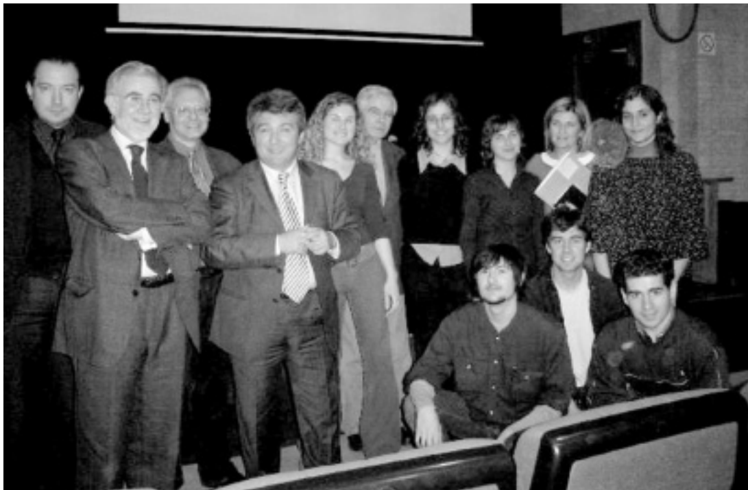
Els participants de la taula amb alguns dels assistents al debat.