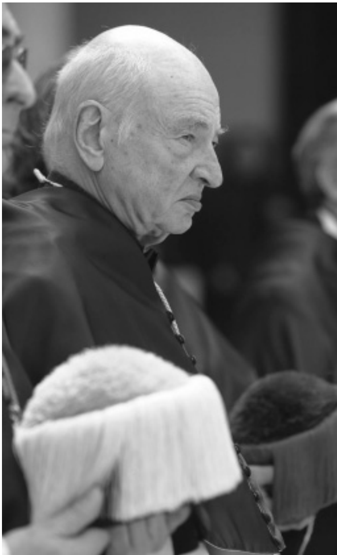
Edgar Morin, durant l'acte d'investidura com a doctor 'honoris causa'.