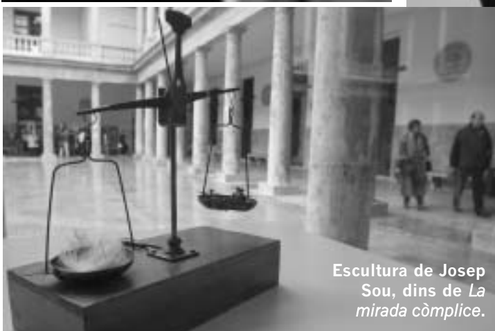
Escultura de Josep Sou, dins de La mirada còmplice .

tilacions producte dels quiròfans es vinculen amb una idea de bellesa que forma part de la història de les aparences. Està oberta fins al 6 de juny.