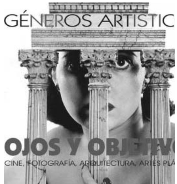
Detall del cartell del cicle.

L'assistència a les conferències és lliure, però cal matricular-se en el curs per a obtenir el certificat acreditatiu d'assistència.