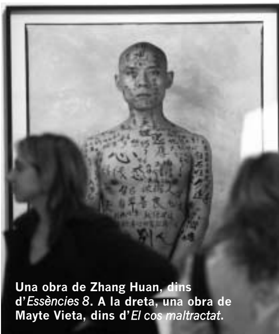
Una obra de Zhang Huan, dins d' Essències 8 . A la dreta, una obra de Mayte Vieta, dins d' El cos maltractat .

Una vegada més, el Patronat Martínez Guerricabeitia trau a la palestra un tema d'actualitat: els rituals que la societat contemporània ens imposa per a formar part de qualsevol col·lectivitat i que en ocasions s'utilitzen com a instruments subtils de manipulació. La moda, el culte al cos o les automu-