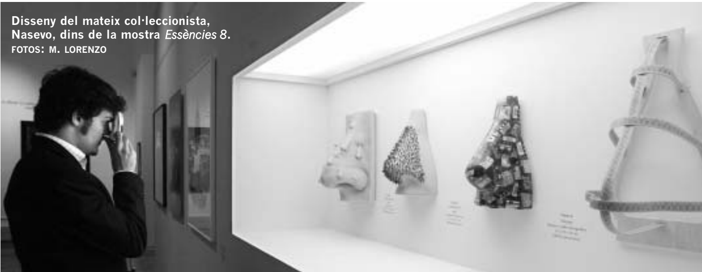
Disseny del mateix col·leccionista, Nasevo, dins de la mostra Essències 8 .