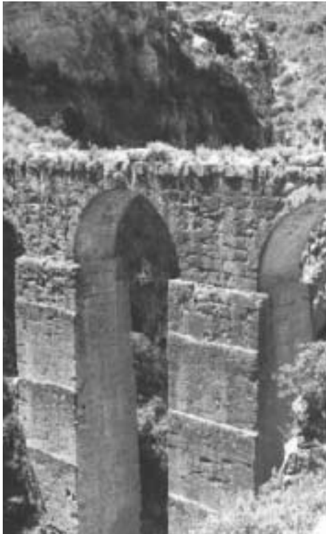
A l'esquerra, retrat de Cavanilles. Dalt, imatge de l'aqüeducte de Peña Cortada, a Xelva.