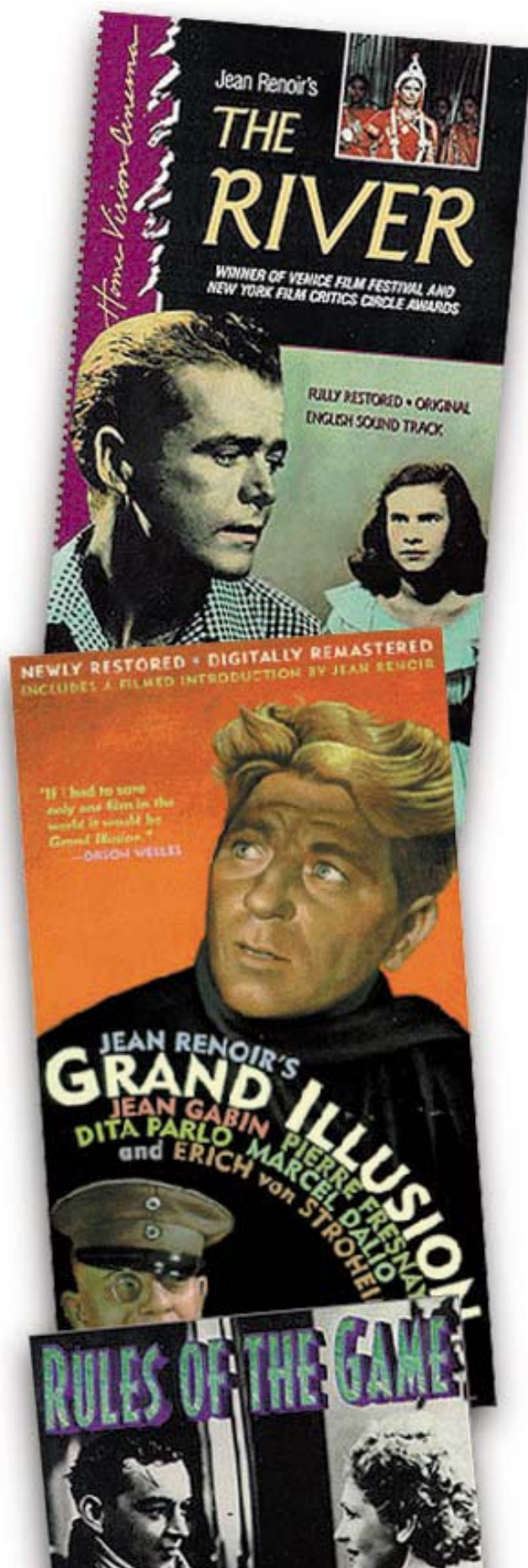
Cartells d'algunes de les pel·lícules del cicle.

La regla del juego , produïda el 1939, va ser censurada. Tots els personatges pertanyen a la burgesia i acaben tenint culpa d'alguna cosa, és una crítica al món burgès. Un ric aristòcrata vol deixar la seua amant per a conservar l'amor de la seua esposa, que està sent festejada per un aviador. Durant una