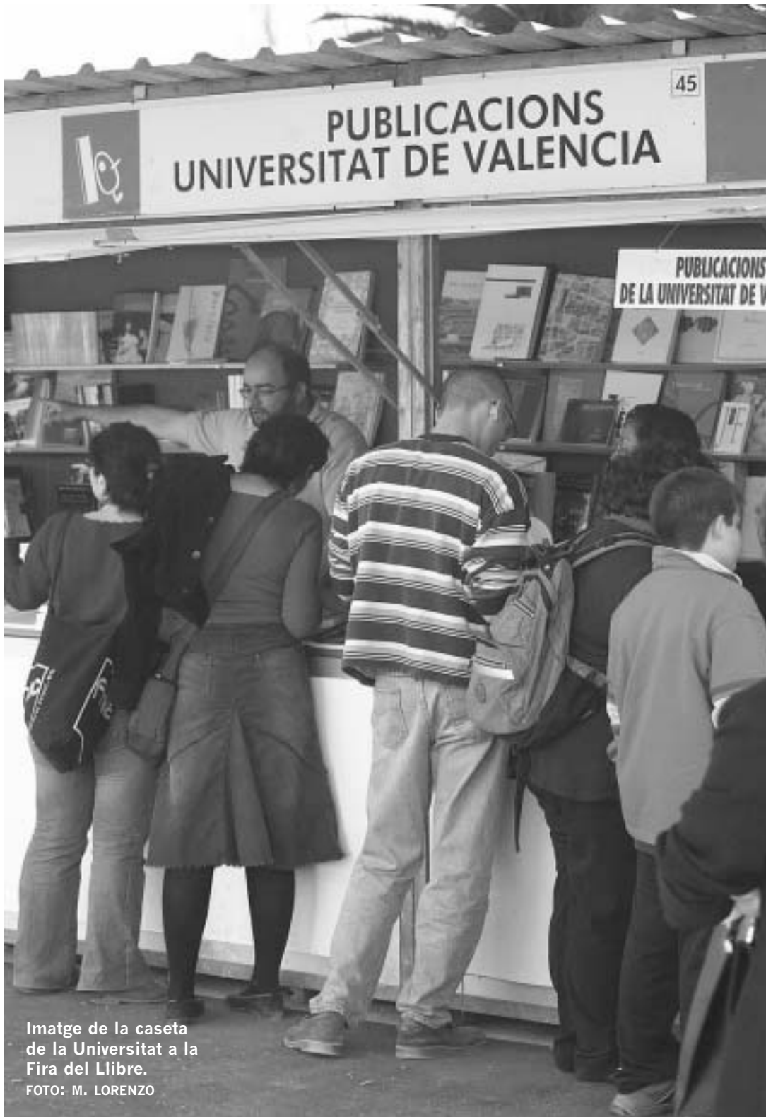
Imatge de la caseta de la Universitat a la Fira del Llibre.

Ahir dimecres, 28 d'abril, es va donar a conèixer la col·lecció Història i Memòria del Fran-