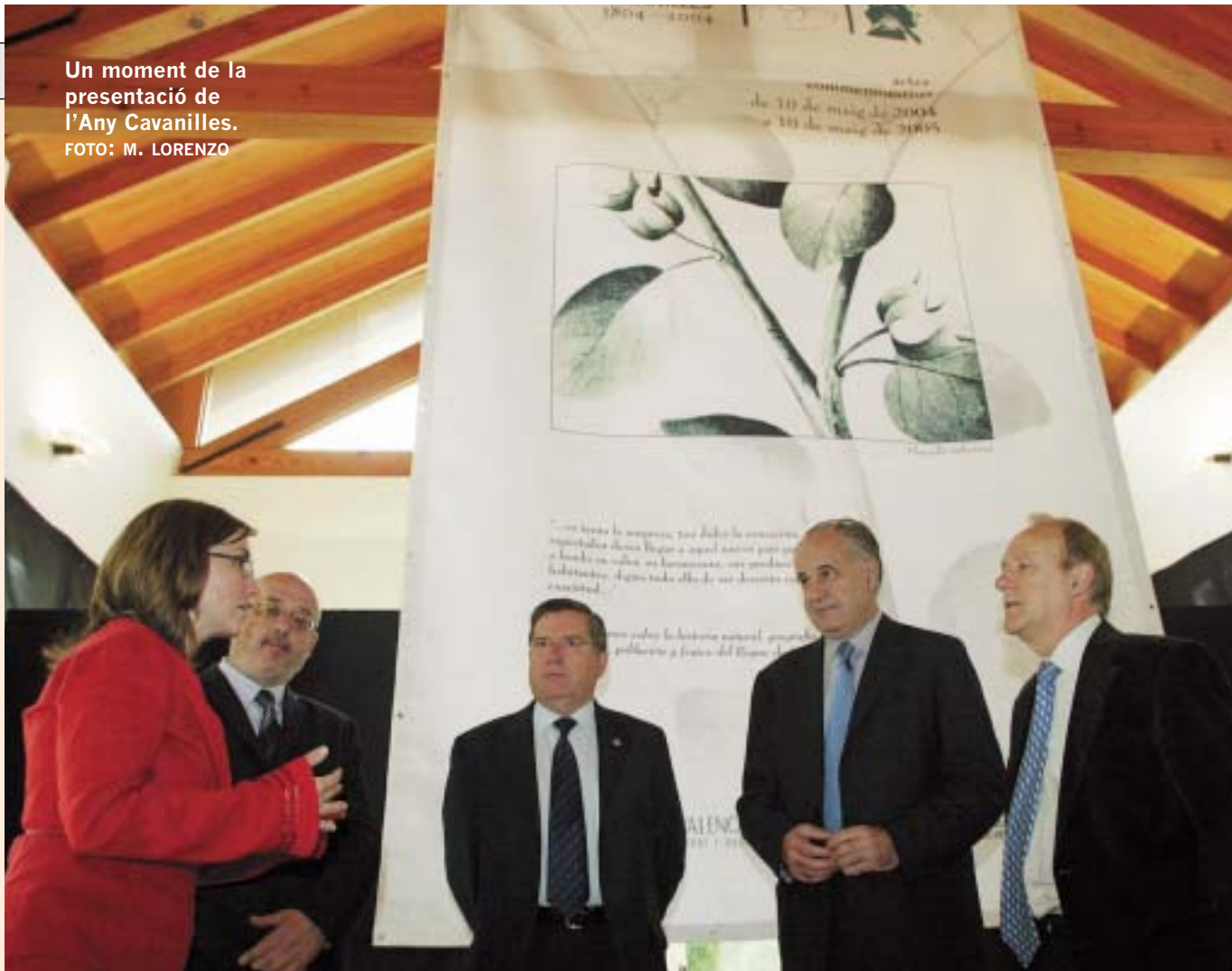
Un moment de la presentació de l'Any Cavanilles.

L'Any Cavanilles començà dilluns 10 de maig del 2004, just dos-cents anys després de la seua mort, i finalitzarà el mateix dia de l'any 2005. El programa complet d'activitats es pot trobar en la web www.cth.gva.es/v/2004anycavanilles .