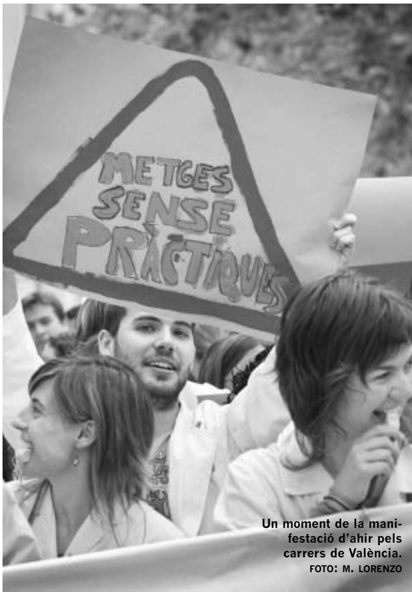
Un moment de la manifestació d'ahir pels carrers de València.

La detecció d'aquests problemes els ha dut a mobilitzar-se durant els darrers dies i ahir dimecres dia 12 van protagonitzar una