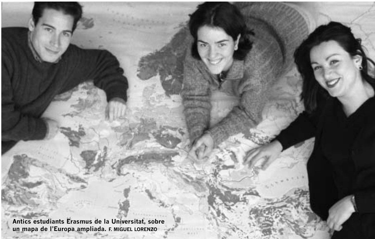
Antics estudiants Erasmus de la Universitat, sobre un mapa de l'Europa ampliada.