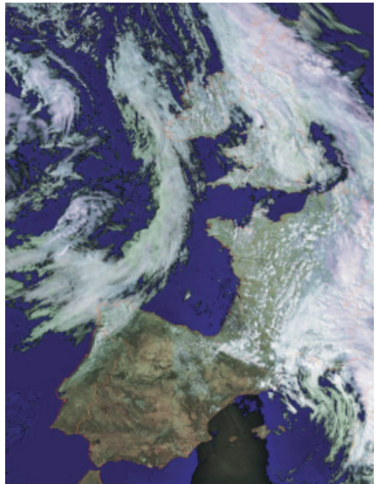
El llibre analitza la situació ambiental de la mar Mediterrània.

El treball s'obri amb una visió panoràmica de la problemàtica ambiental, presenta l'ecologia en tant que ciència i s'endinsa en el preocupant tema de la pèrdua accelerada de la biodiversitat. A continuació analitza la situació ambiental de la mar Mediterrània, que fa ampliable a tots els oceans, i aporta alguns estudis de casos determinats d'agressió ambiental, tan diversos com ara el de l'Antàrtida o el del Pla Hidrològic Nacional, entre altres.