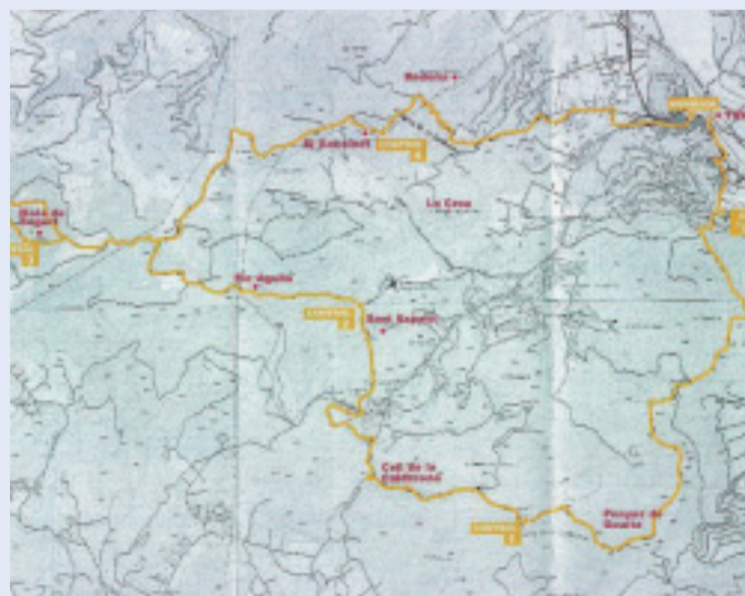
Mapa d'algunes rutes per la serra Calderona.

Organitza: Jardí Botànic. Durada: 21 hores. Dates: 26 d'octubre, 2, 9, 16 i 23 de novembre i 3 de desembre. Horari: De 18 a 21 hores. Preu: 80 euros. Lloc: Jardí Botànic. C/Quart 80. Informació: 96 315 68 00 i www.uv.es/jardibotanic/cultura