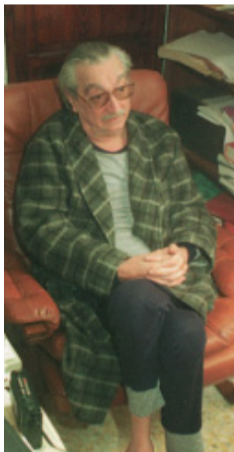
Joan Fuster.