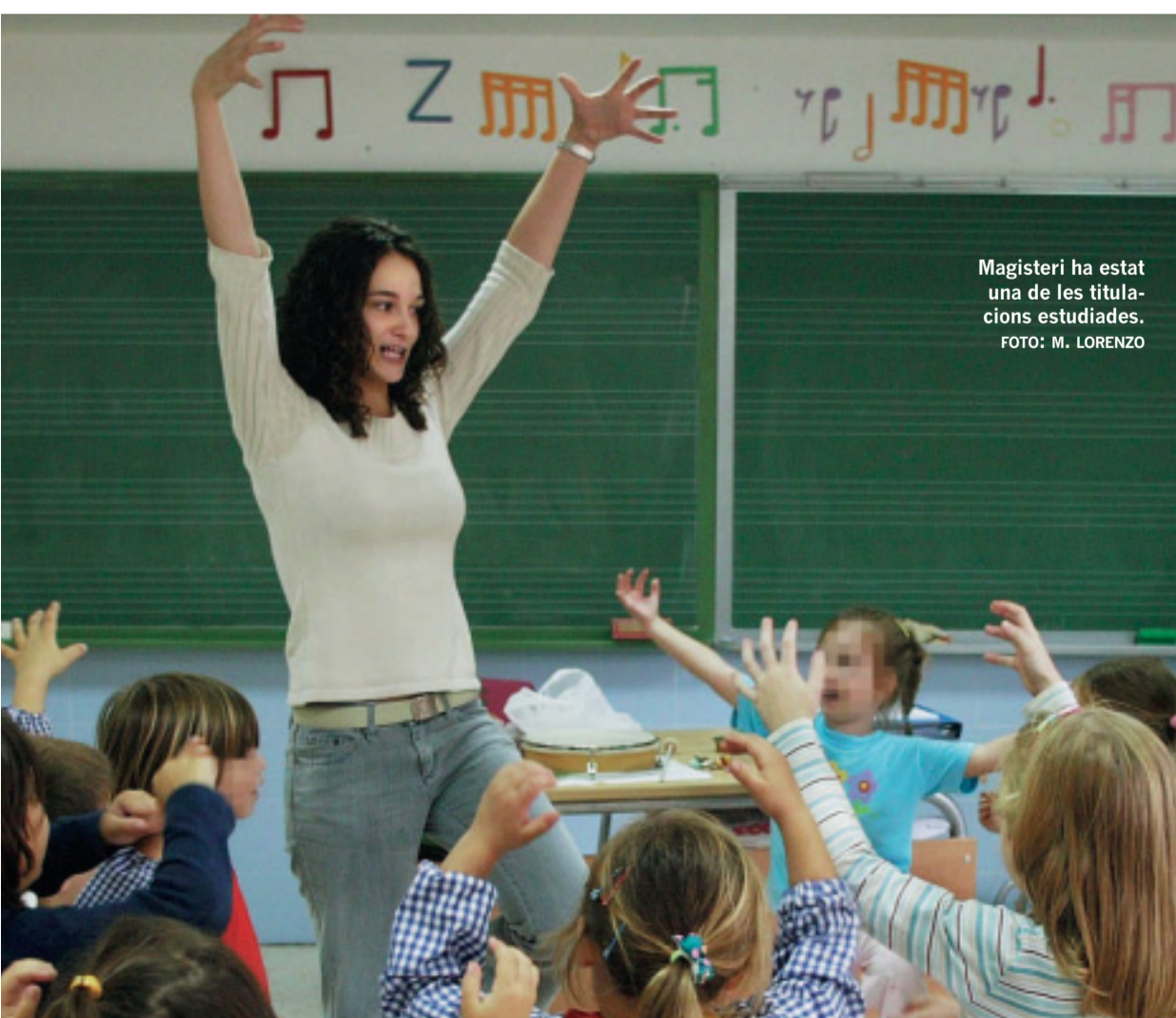
Magisteri ha estat una de les titulacions estudiades.

El 64,2% de les enquestades eren dones davant el 35,8% d'homes. En el moment de l'enquesta, el 77,8% dels entrevistats era econòmicament independent.