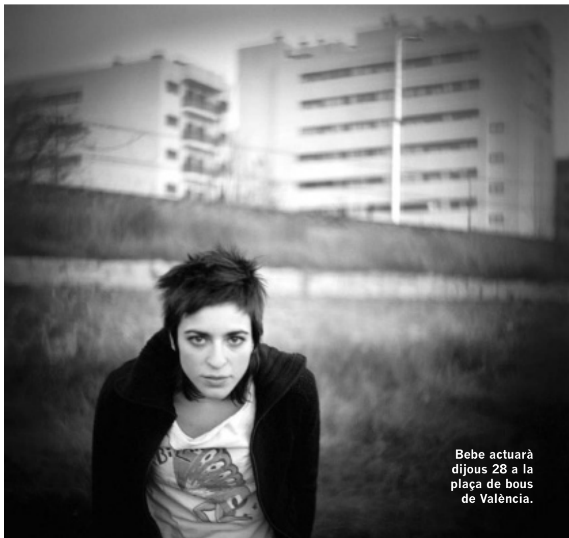
Bebe actuarà dijous 28 a la plaça de bous de València.

Els col·lectius i les associacions de la Universitat de València també organitzen activitats socioculturals en el marc de la Benvinguda. Poden trobar les seues propostes en l'adreça: www.uv.es/cade/benvinguda