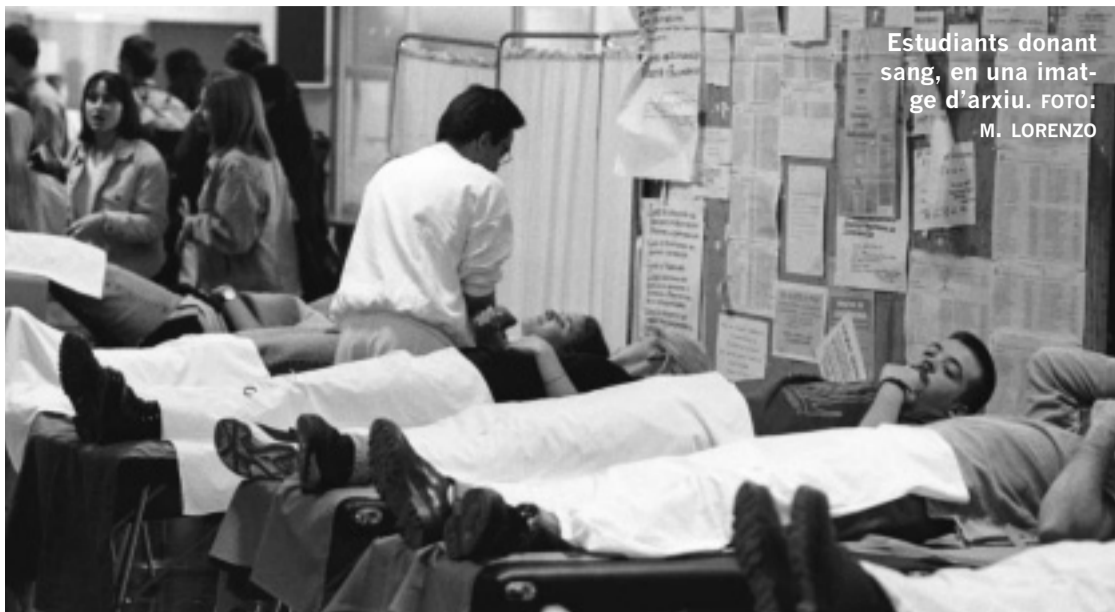
Estudiants donant sang, en una imatge d'arxiu.