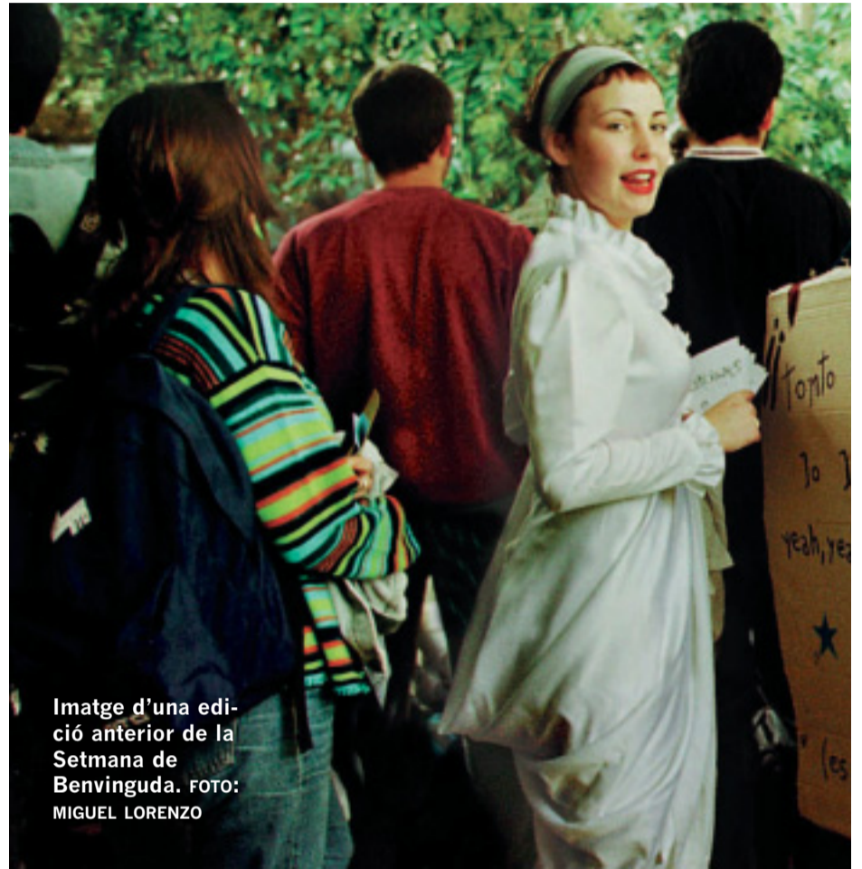
Imatge d'una edició anterior de la Setmana de Benvinguda.

Per tal de conèixer la inserció laboral dels titulats de la Universitat de València, l'OPAL (en la imatge inferior, la silueta del seu logo) ha efectuat un exhaustiu estudi que aporta dades reveladores que milloraran a partir d'ara les possibilitats de futur dels estudiants. L'informe s'ha centrat en catorze titulacions i els seus resultats aporten les darreres tendències de les eixides professionals de les carreres universitàries analitzades, així com el grau de satisfacció dels titulats, el sou mitjà que cobren o el temps que tarden en trobar feina, que s'ha establert en menys de sis mesos. Pàgs. 6/7