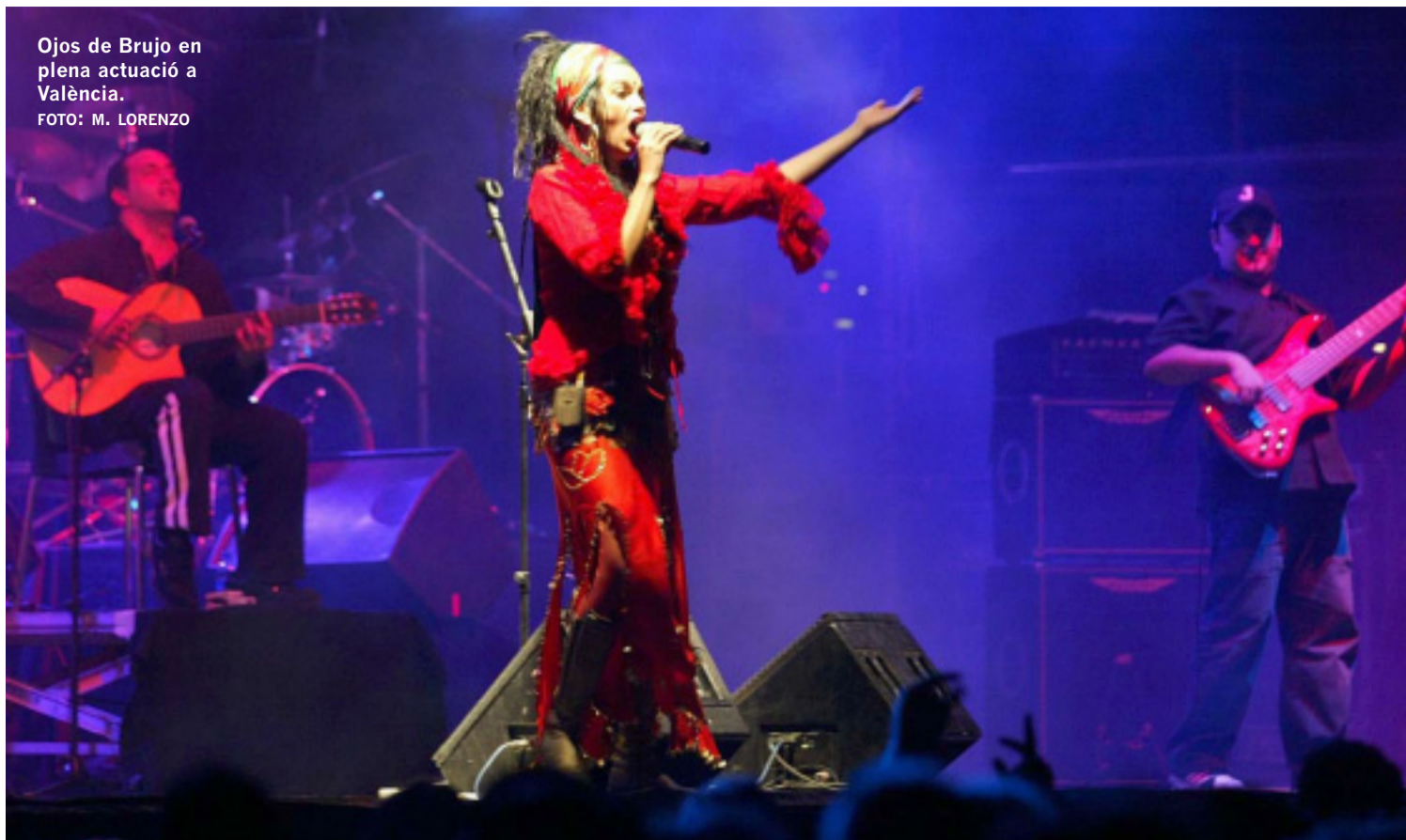
Ojos de Brujo en plena actuació a València.