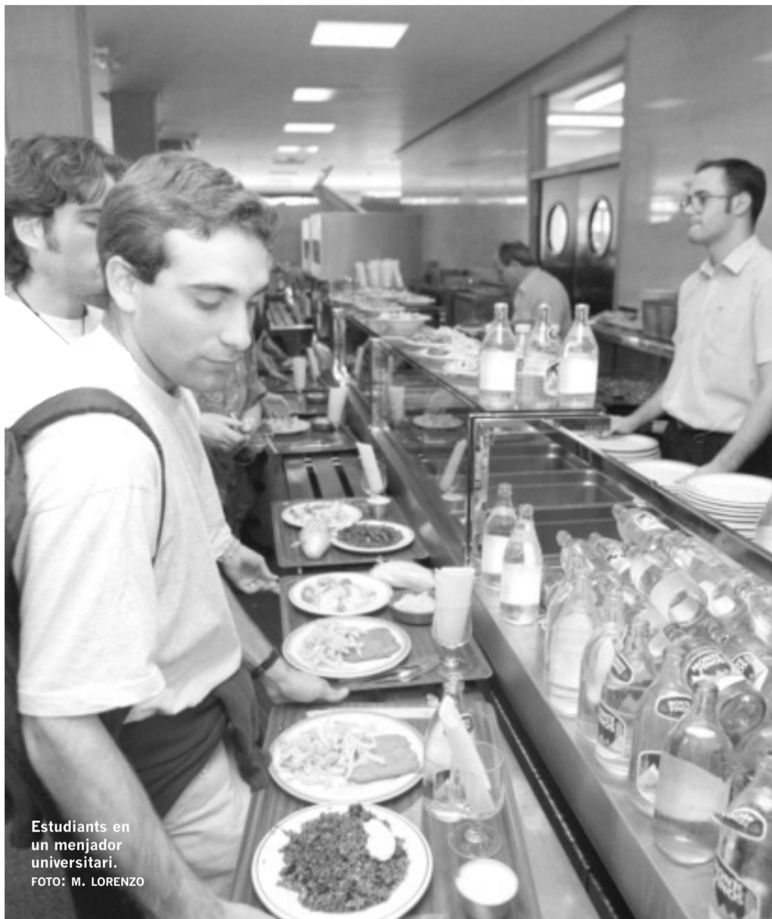
Estudiants en un menjador universitari.

experts en Nutrició defineixen la dietètica com "l'art de combinar els aliments. A partir del coneixement profund de l'ésser humà es propaguen formes d'alimentació variades i suficients, que cobreixen les necessitats tant en la salut com en la malaltia".