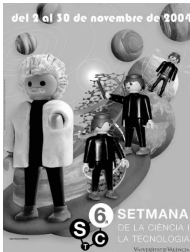
Cartell de la VI Setmana de la Ciència.