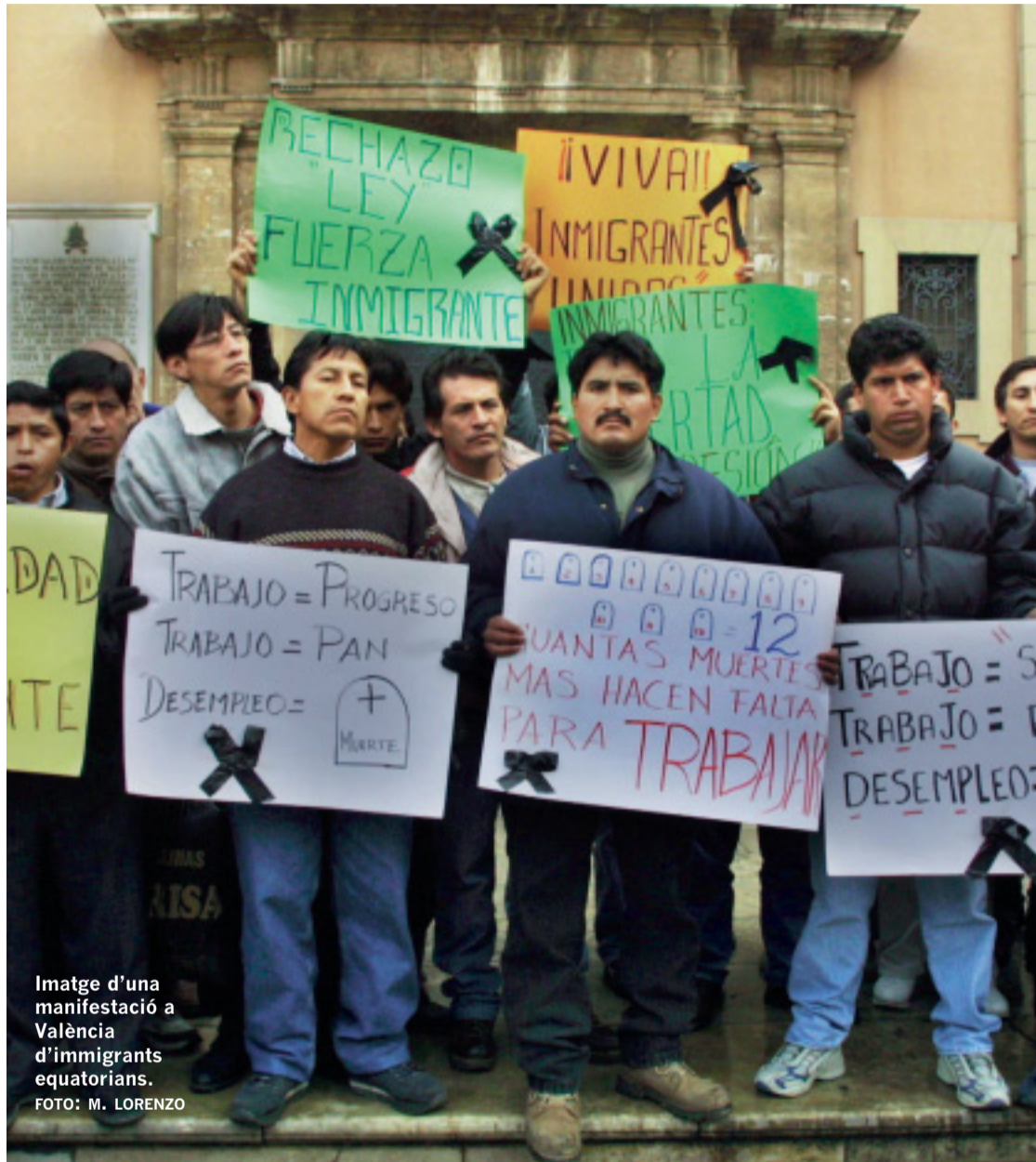
Imatge d'una manifestació a València d'immigrants equatorians.

En el seminari s'han presentat, a més, els plans d'integració de comunitats autònomes, com ara la catalana o l'andalusa, i s'hi han exposat les paradoxes que presenten els processos migratoris.