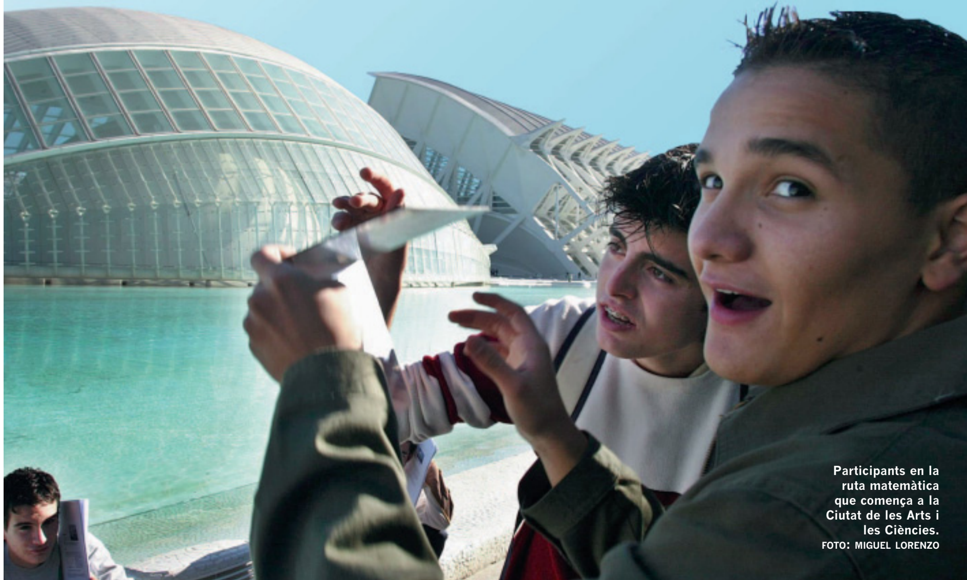
Participants en la ruta matemàtica que comença a la Ciutat de les Arts i les Ciències.

El catedràtic Víctor Navarro ha recuperat un text de l'astrònom valencià Jeroni Muñoz. El Consell Valencià de Cultura l'ha editat amb un estudi crític. Pàg. 12