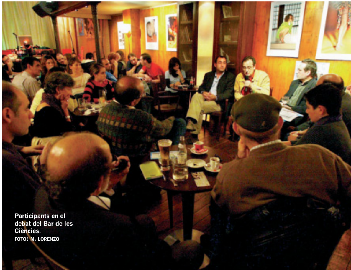
Participants en el debat del Bar de les Ciències.

Això precisament és el que ha fet la Càtedra de Divulgació de la Ciència, que, amb la nova proposta del Bar de les Ciències, ha muntat una tertúlia on experts, pro-