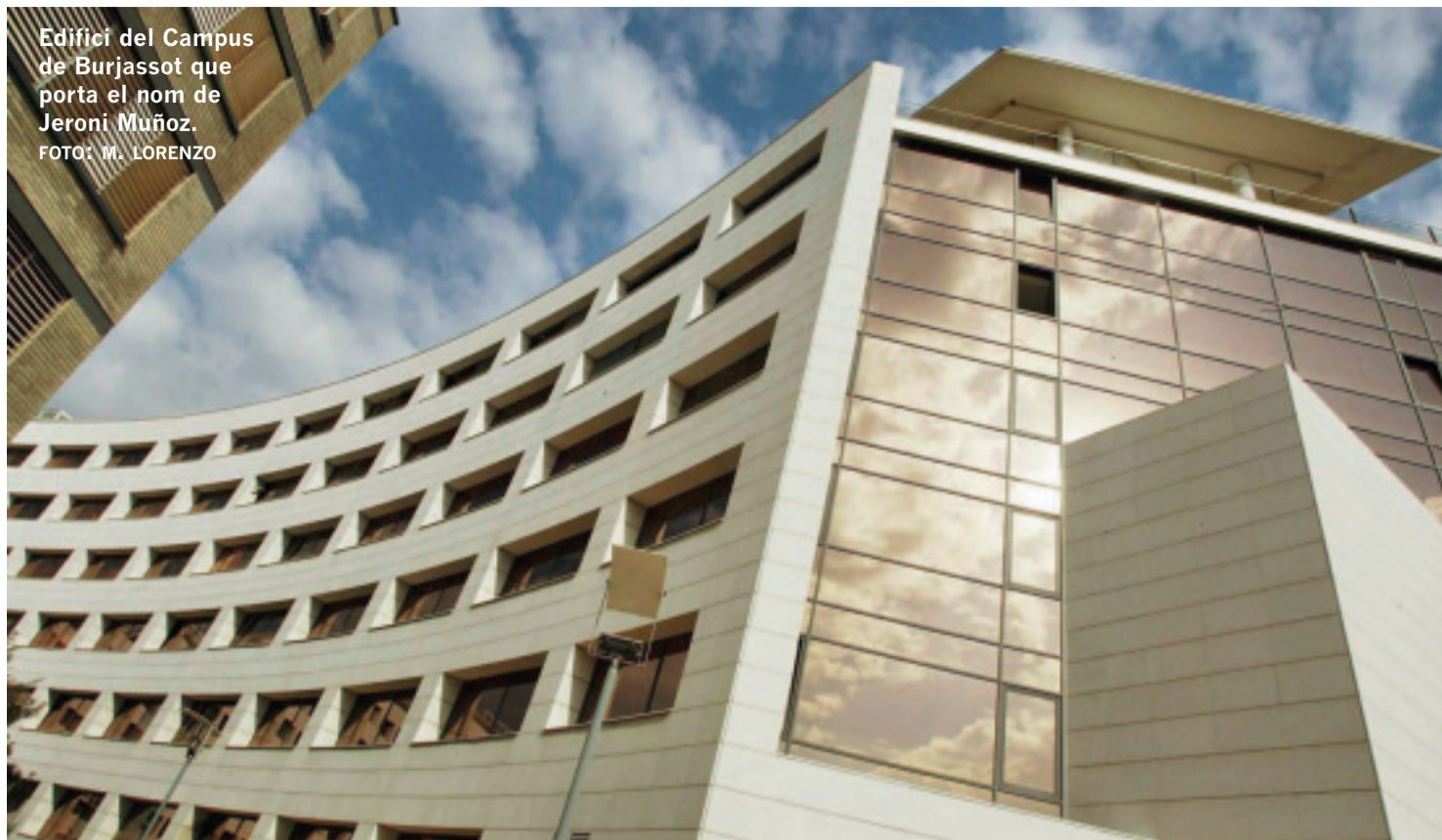
Edifici del Campus de Burjassot que porta el nom de Jeroni Muñoz.