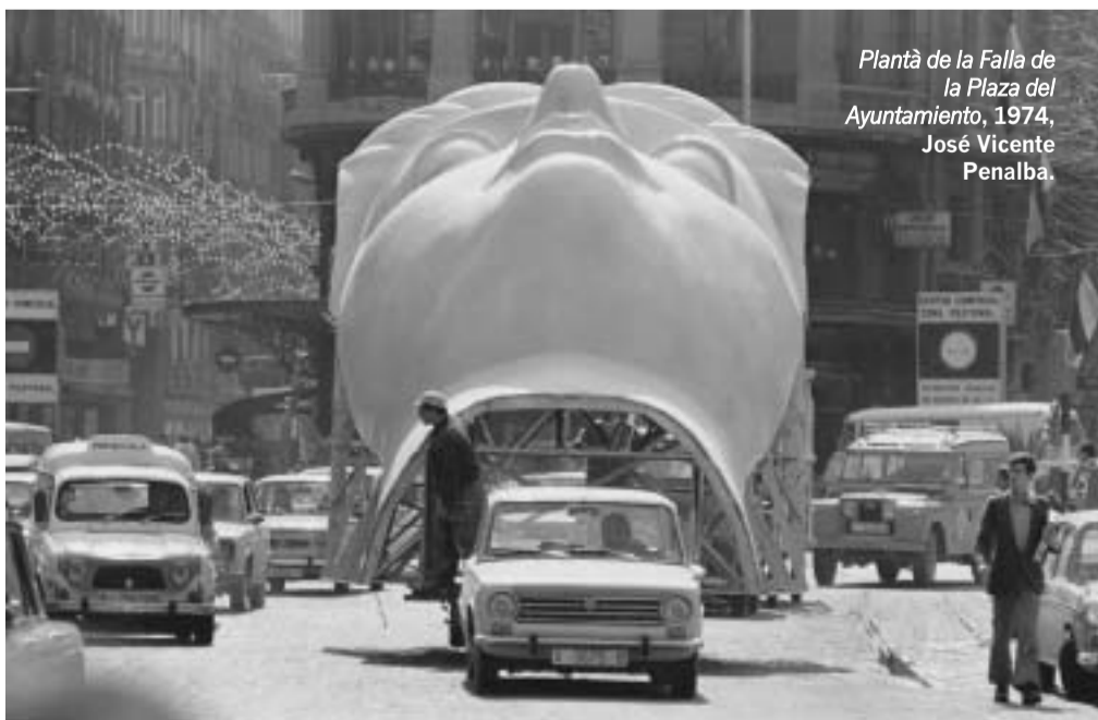
Plantà de la Falla de la Plaza del Ayuntamiento, 1974