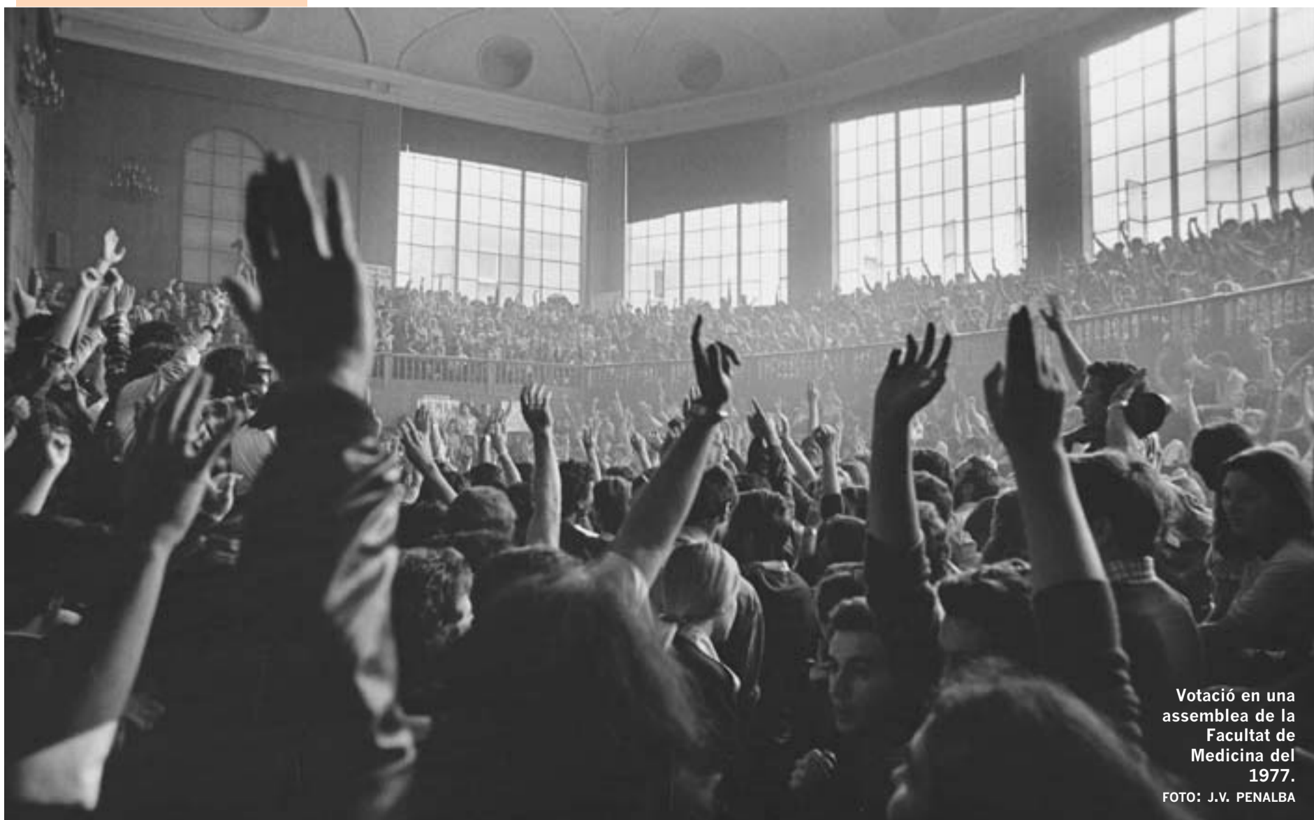
Votació en una assemblea de la Facultat de Medicina del 1977.

El proper dijous, dia 2 de desembre, se celebren les eleccions per a renovar els representants dels estudiants al Claustre de la Universitat de València. Els centres triaran 75 estudiants per al màxim òrgan de representació universitari. Els integrants de les candidatures podran fer campanya electoral des del proper dilluns. La votació del dia 2 començarà a les 10 hores i les urnes es tancaran a les 20. La Junta Electoral proclamarà els resultats provisionals el dia 9 de desembre. Pàg. 3