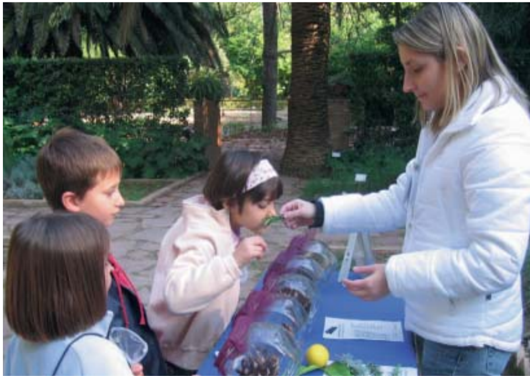
Xiquets i xiquetes participant en la festa del Botànic del passat diumenge.