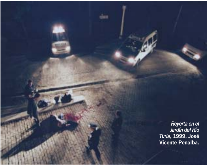
Reyeria en el Jardín del Río Turia, 1999, José Vicente Penalba.