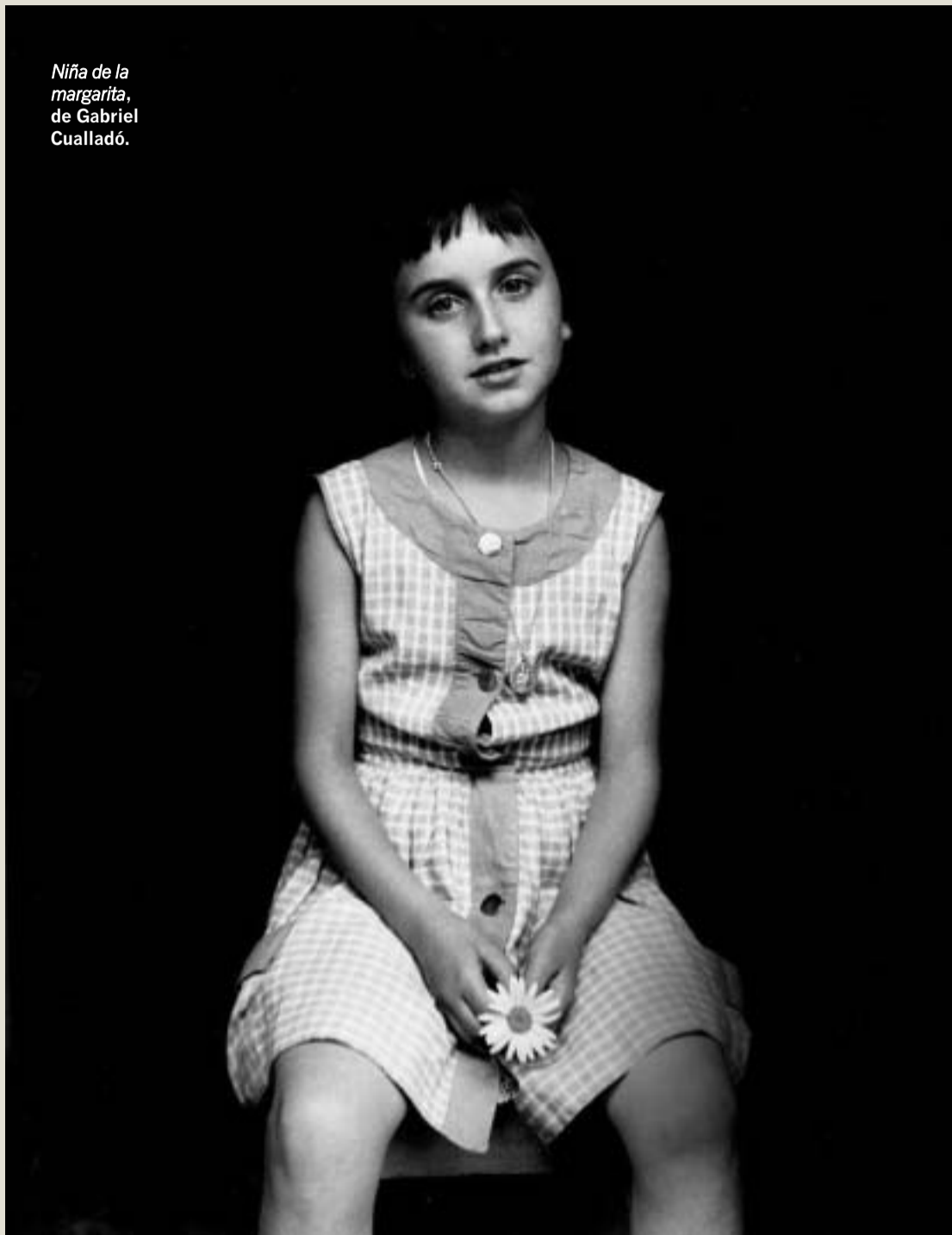
Niña de la margarita, de Gabriel Cualladó.