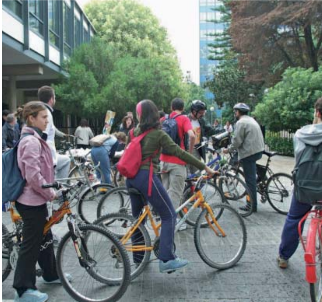
Estudiants de la Universitat durant una manifestació per a exigir més carrils bici.

“Estem vivint una situació d'autèntica emergència planetària, marcada per tot un seguit de greus problemes estretament vinculats: contaminació i degradació dels ecosistemes, exhauriment dels recursos naturals, creixement incontrolat de la població mundial, desequilibris insostenibles, conflictes destructius, pèrdua de diversitat biològica i cultural”. Així comença el manifest de les Nacions Unides. El text continua: “Els educadors, en general, no estem parant suficient atenció a aquesta situació, tot i algunes crides com les de Nacions Unides en les Cimeres de la Terra (Rio 1992 i Johannesburg 2002). Cal, per això, assumir un compromís amb l'objectiu que tota l'educació, tant la formal (des de l'escola primària fins a la universitat) com la informal (museus, mitjans de comunicació...) preste atenció sistemàticament a la situació del món, proporcione una percepció adient dels problemes i fomenti actituds i comportaments favorables per a