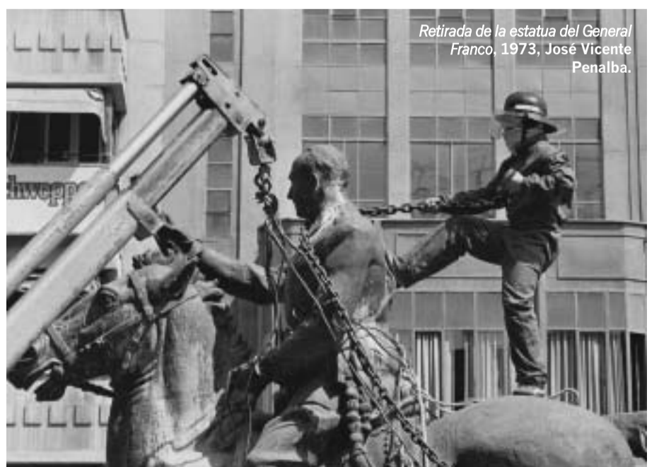
Retirada de la estatua del General Franco, 1973, José Vicente Penalba.